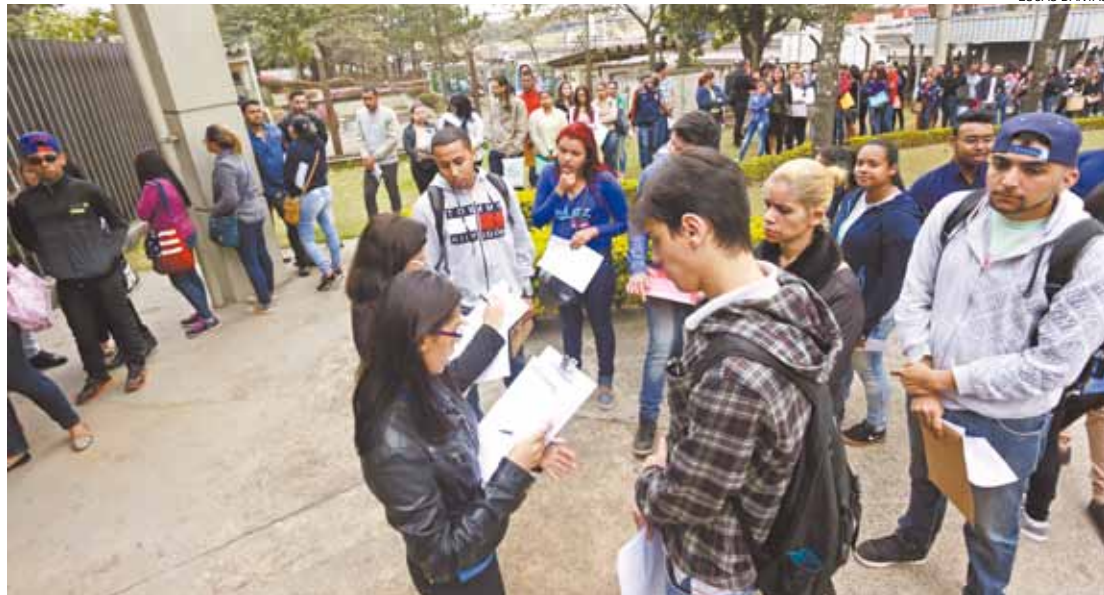
Crise - O pico das dispensas neste ano ocorreu em fevereiro, com 12.826 trabalhadores guarulhenses na rua