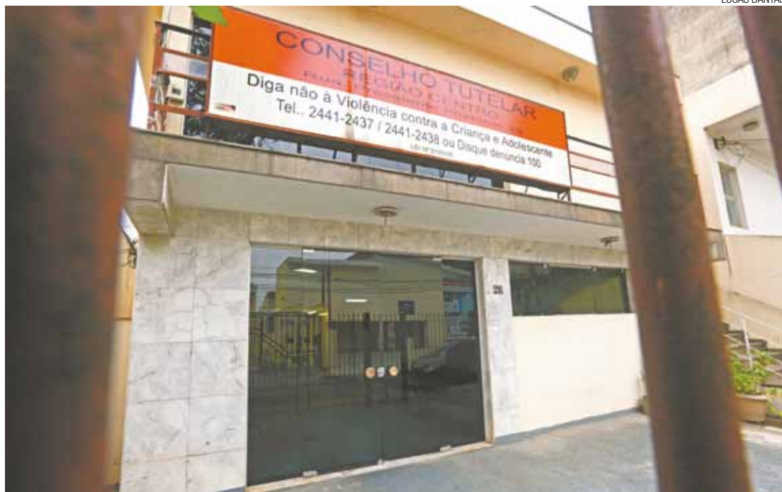
Déficit - Guarulhos deveria ter um Conselho Tutelar para cada 100 mil habitantes; há 220 candidatas para 30 vagas

“Se a eleição não for bem fiscalizada pela OAB e pelo Ministério Público, tanto na preparação quanto na estrutura, pode apresentar o mesmo resultado, disse o vereador Laércio Sandes (PMN).