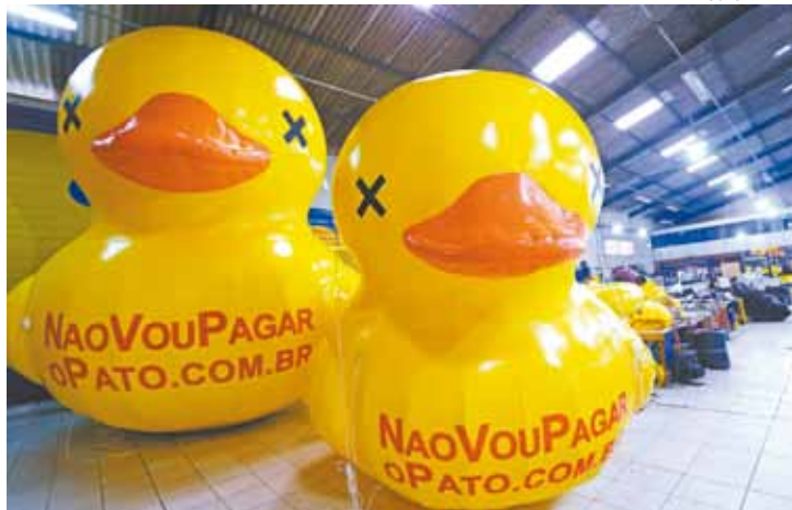
Protesto - Personagens são utilizados em manifestação pelo País

A empresa guarulhense Big Format viu a procura por bonecos infláveis crescer. "Só nos últimos dois meses foram produzidos 5 mil pixulecos de 30 cm e cerca de 50 patos em