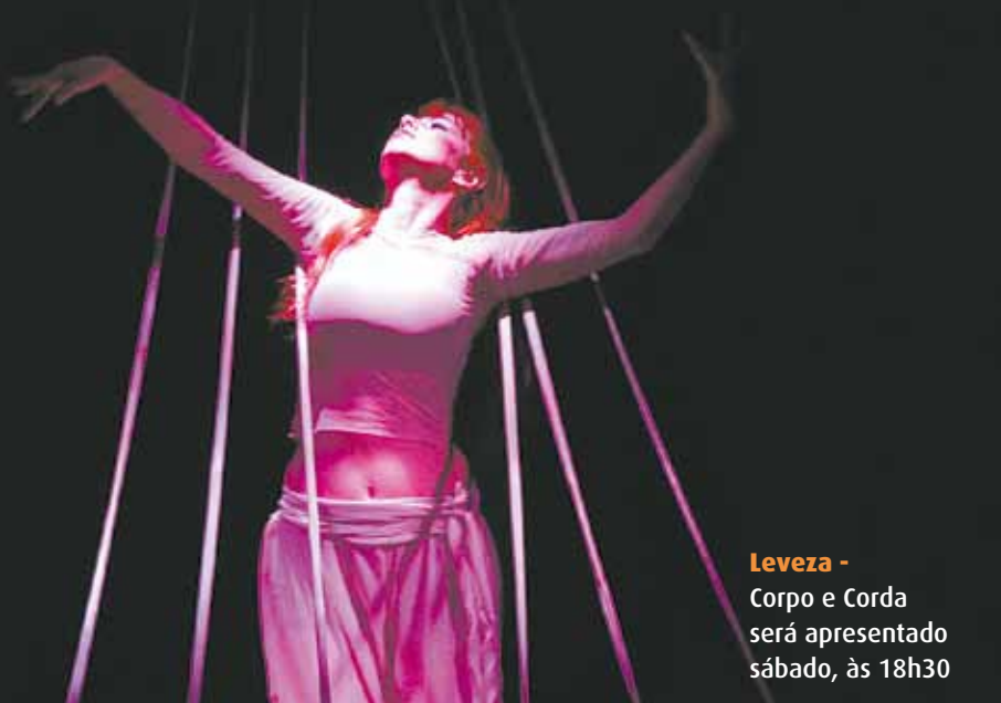
Leveza - Corpo e Corda será apresentado sábado, às 18h30