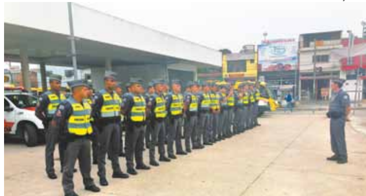
Participação - 27 alunos soldados do 26º BPM/M de Franco da Rocha