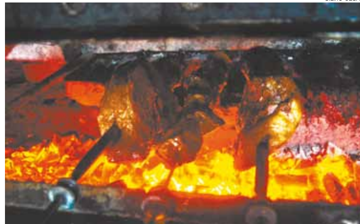
Água na boca - A picanha é o corte preferido dos churrasqueiros