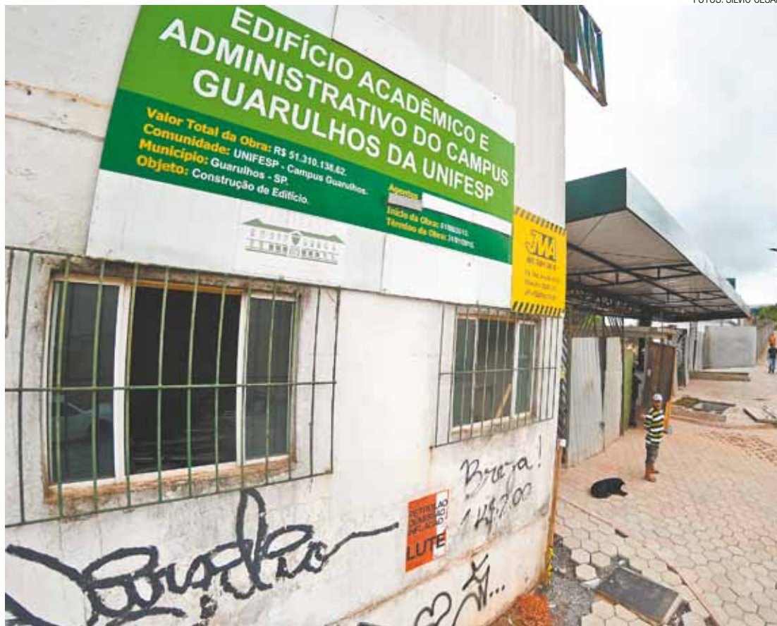
Atrasado - Obra deveria ter sido concluída em setembro, mas o prazo não foi cumprido pela Unifesp Pimentas

A Unifesp Guarulhos foi inaugurada em 2007 pelo então ministro da Educação Fernando Haddad (PT), hoje prefeito de São Paulo. Desde então, o campus tem falhas de estrutura e diversas reclamações por difícil acesso, já que a maioria dos estudantes é da Capital. No início do ano, os alunos ficaram quase três meses de greve, por causa do corte do ônibus que fazia transporte gratuito dos estudantes, de São Paulo a Guarulhos.