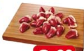
Coração de Frango