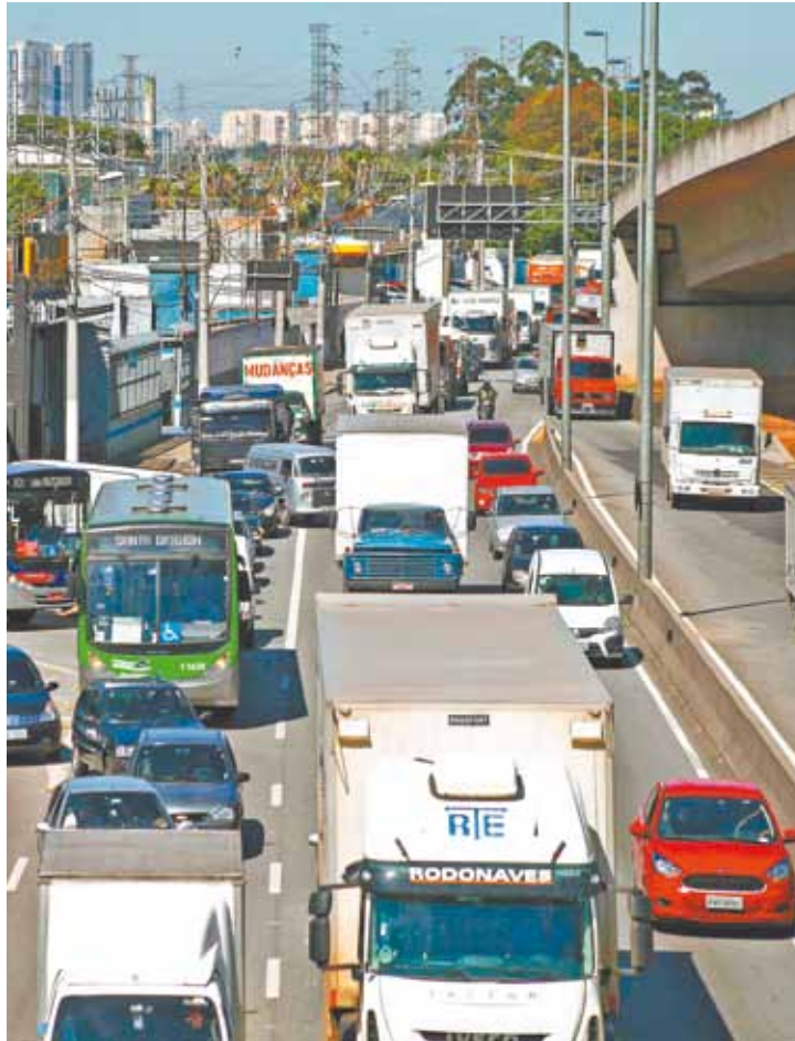
Marginal - Trânsito intenso para pegar a Ayrton Senna na tarde de ontem

A partir de hoje e nos dois dias seguintes, a segurança será reforçada nas pistas e nos aeroportos. A Ecopistas e a CCR NovaDutra contam