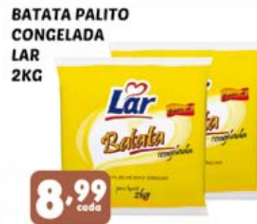
BATATA PALITO CONGELADA LAR 2KG