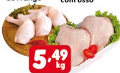
Coxa com Sobrecoxa de Frango