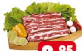
Costela Bovina P.A