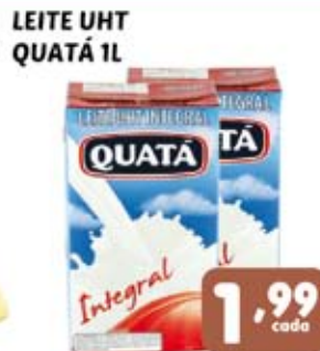
LEITE UHT QUATÁ 1L