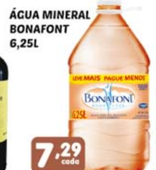
ÁGUA MINERAL BONAFONT 6,25L