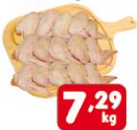
Asa de Frango