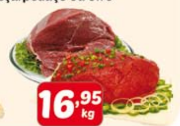
Coxão Mole ou Patinho peça/pedaço ou bife