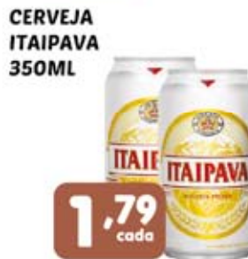
CERVEJA ITAIPAVA 350ML