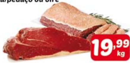
Alcatra com Maminha ou Contra filé peça/pedaço ou bife