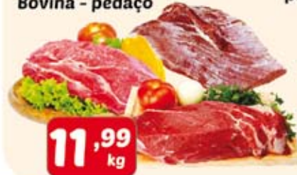
Acém/Peito ou Paleta Bovina - pedaço