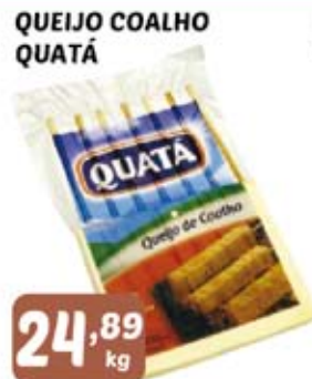
QUEIJO COALHO QUATÁ