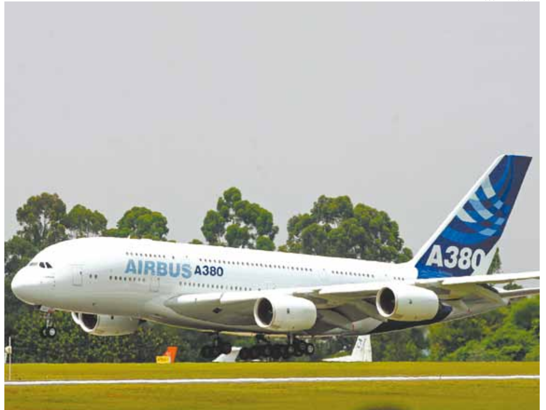
Novidade - Airbus A380 é considerado um dos maiores aviões que fazem operações comerciais do mundo

O Terminal 3 foi concebido com cinco posições para o estacionamento das aeronaves. Cada uma delas conta com duas pontes telescópicas, sendo que uma delas tem capacidade para atender ao deck superior da aeronave. Isso proporciona maior agilidade no embarque e desembarque de passageiros.