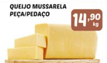
QUEIJO MUSSARELA PEÇA/PEDAÇO