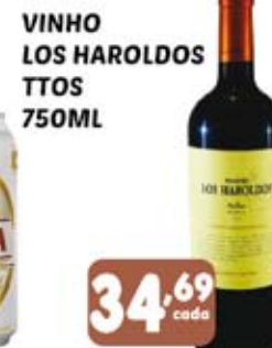
VINHO LOS HAROLDOS TTOS 750ML