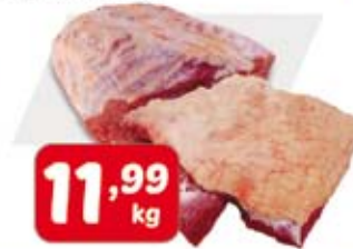
Capa de Filé peça ou Cupim peça/pedaço