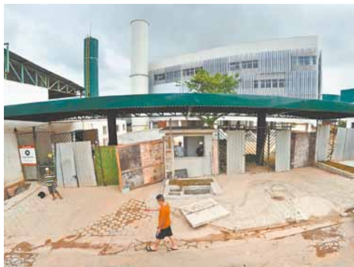
Falta bastante - Fachada da universidade mostra obras em andamento

Alunos voltarão à unidade apenas no próximo semestre