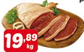
Picanha Bovina Fatiada peça