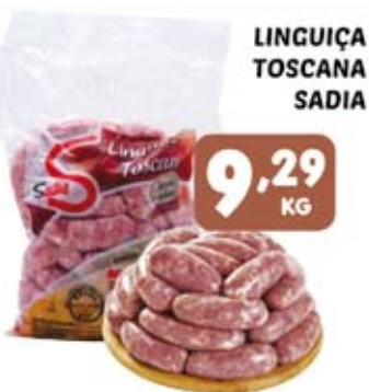
LINGUIÇA TOSCANA SADIA