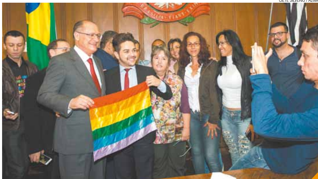
Com a bandeira - Alckmin defende medidas para proteger população LGBT de crimes homofóbicos

Para Alckmin, a medida pode reduzir as agressões. "Infelizmente, se pegar só nos últimos quatro anos de Decradi, 20% dos crimes foram de lesão. E a injustiça cometida contra uma pessoa é uma ameaça a toda sociedade. Para avançar é preciso respeitar as diferenças. E isso será conseguido com a conscientização de toda população", disse.