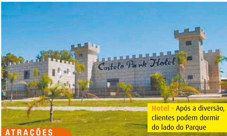
Hotel - Após a diversão, clientes podem dormir do lado do Parque