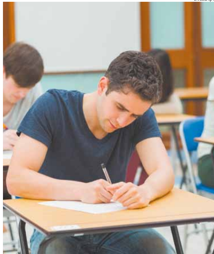
Habilidades - Teste vocacional aponta aptidões dos jovens estudantes