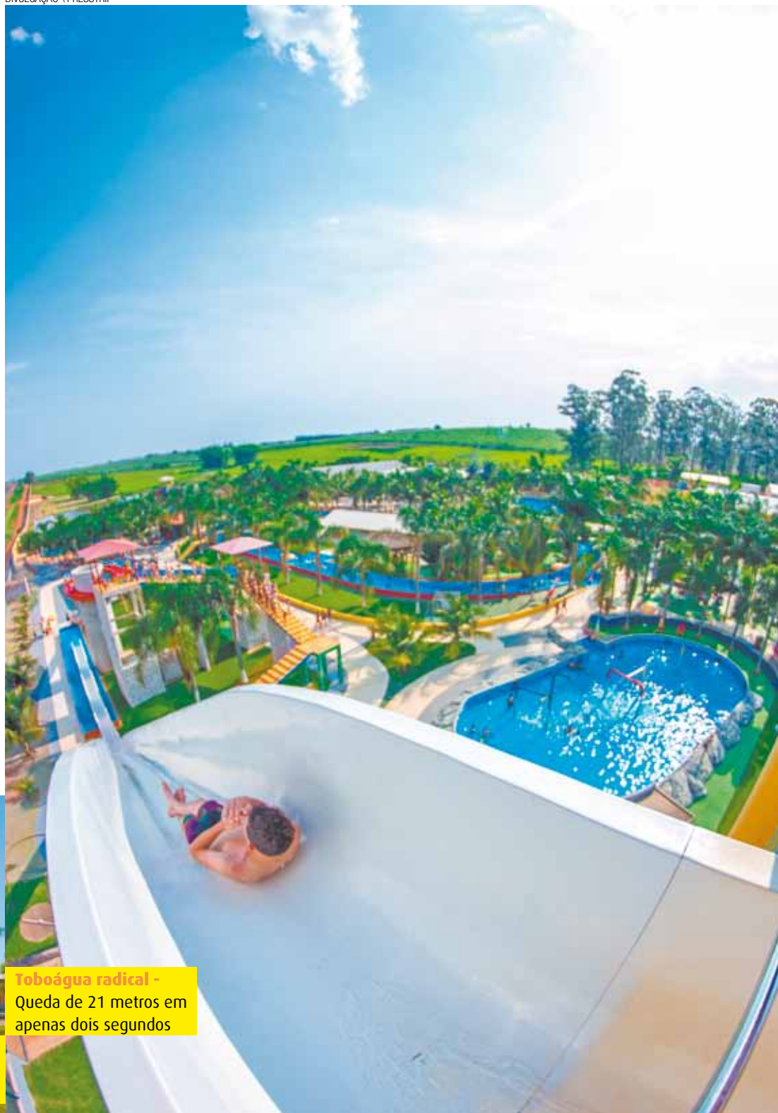
Toboáguas radical - Queda de 21 metros em apenas dois segundos