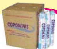
Copo desc Copomais 180ml - 100un Cada