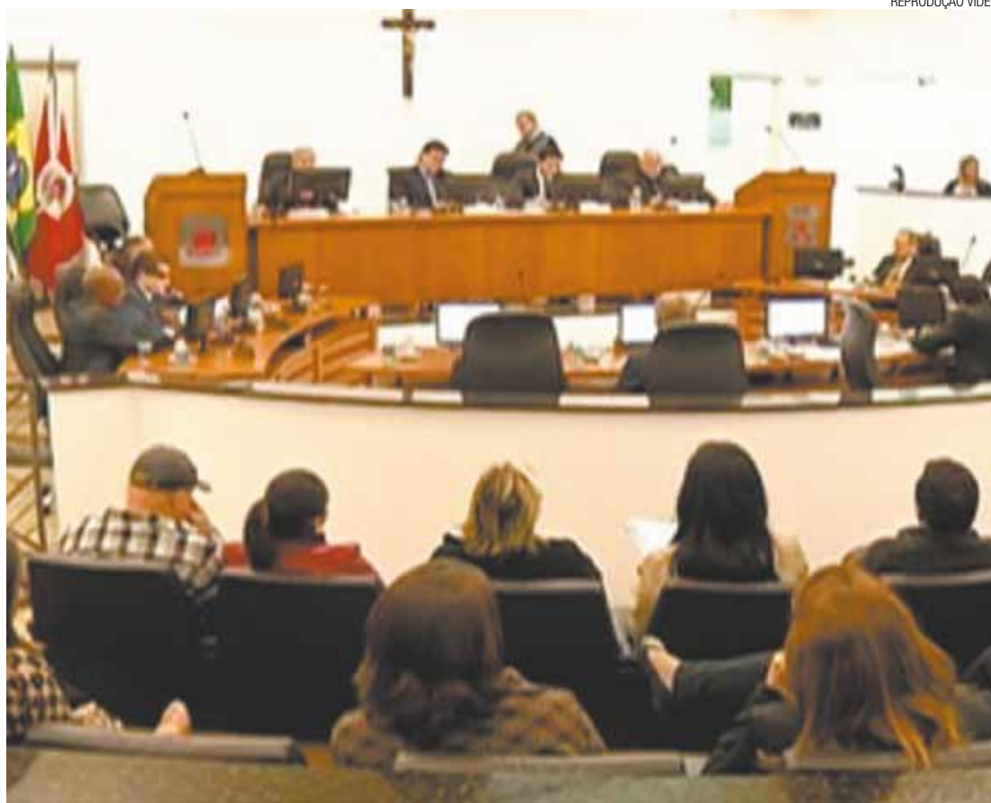
Segurança - Texto da propositura aponta a finalidade de tentar dificultar assaltos nas saídas dos bancos