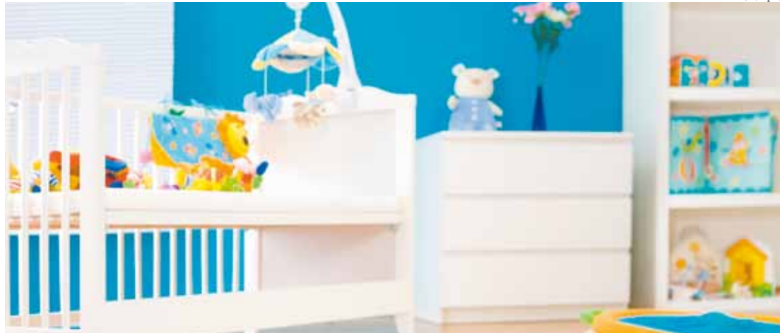
Cores claras - Transmitem tranquilidade indireta para os bebês; azul e rosa ainda são as mais indicadas