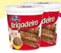
Brigadeiro Alispec 1,01Kg Cada