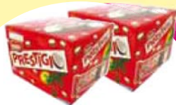
Choc. Prestigio 960g Cada