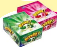
Chiclé Poosh Sabores Cada