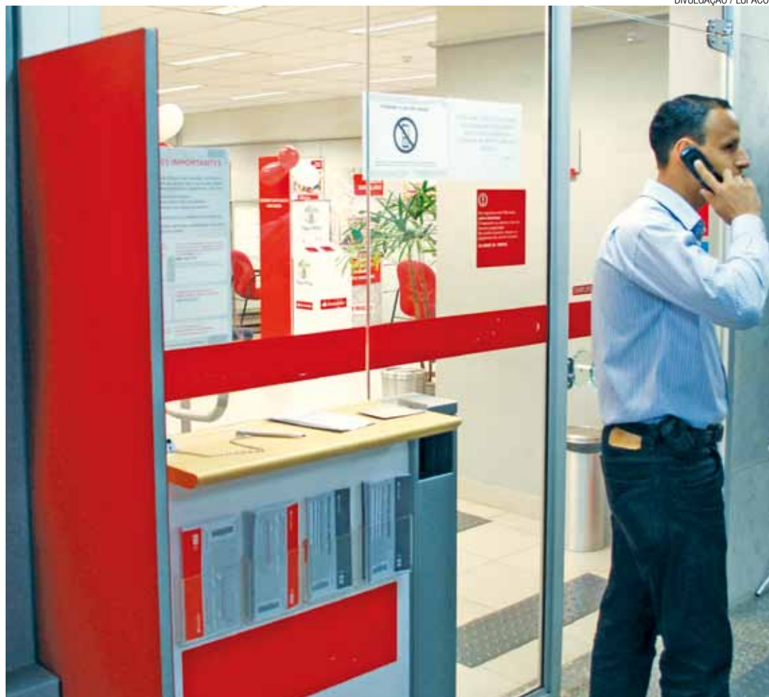
Fiscalização - Vigilantes são orientados defender o patrimônio dos bancos e têm que observar outras questões

Para o secretário, os vigilantes são orientados a defender o patrimônio dos bancos e têm que observar outras coisas além de quem está usando o celular o que compromete ainda mais a eficácia da medida.