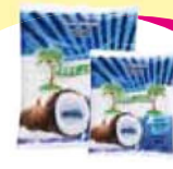
Coco Ralado Fresco 500g Cada