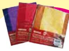
Embalagem Trufas Cromus Cada