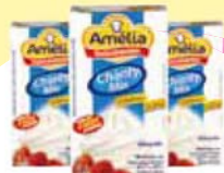
Chantilly Amelia Vigor 1kg Cada