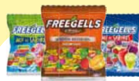
Bala Freegells 584g Cada