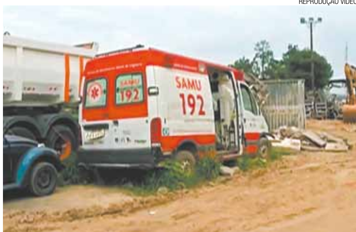
Abandono - Local tem ambulância sucateada do SAMU, além de viaturas

Ainda não se sabe ao certo o que causou o acidente. Não houve registro do caso na delegacia de Itaquaquecetuba.