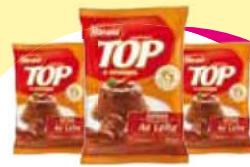
Cob Harald Gotas Leite 1,05kg Cada