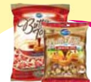
Bala Butter Toffee 750g Cada