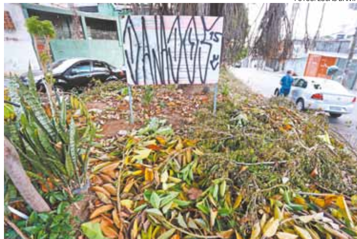
Manutenção? - Há duas semanas árvores foram podadas na Brancaleoni

Tel. 11 2408-7575 / Nextel: 7914-6992 / ID: 115*57145 www.confortarcondicionado.com.br