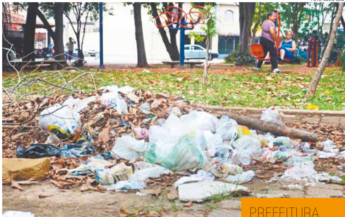
Degradação - Área verde está tomada de lixo e afasta os moradores

A reportagem da Folha Metropolitana foi duas vezes ao local em um período de 20 dias. Nas duas ocasiões encontrou lixo, uma pia de cozinha jogada no jardim, cacos de vidro espalhados pelo chão e moradores de rua e colchões embaixo de bancos.