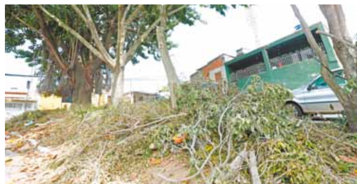
Insatisfação - Moradores pediram poda, mas não esperavam a sujeira

Feira livre estava no Anel Viário, mas foi transferida