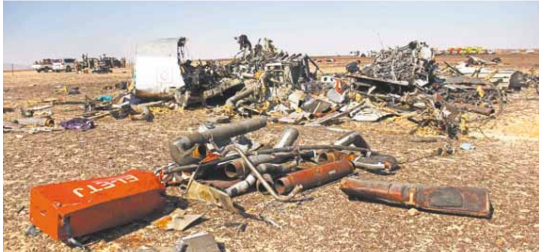
Pedaços - Avião atingiu o solo completamente despedaçado; companhia fala em um choque externo