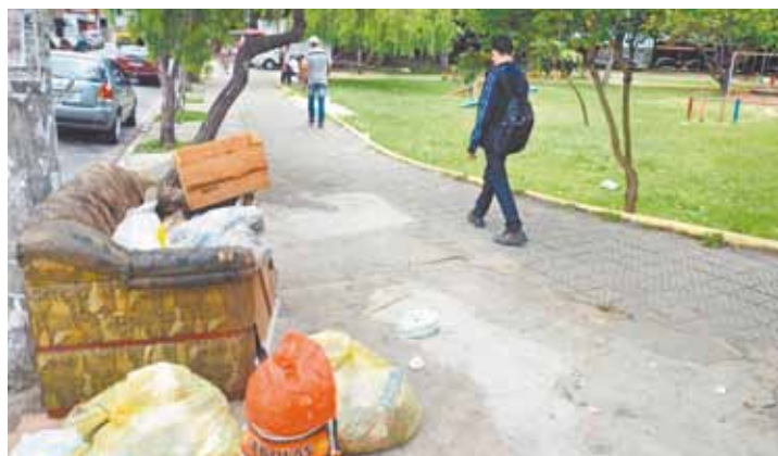
Finalidade errada - Parque virou ponto de descarte irregular de lixo

Em nota, a Prefeitura afirmou que colocará o parque em sua agenda de limpeza. Já a Secretaria de Desenvolvimento e Assistência Social disse que monitora as pessoas em situação de rua duas vezes por semana, mas essas não aceitam dormir em albergue e recusam os serviços oferecidos pela Prefeitura.