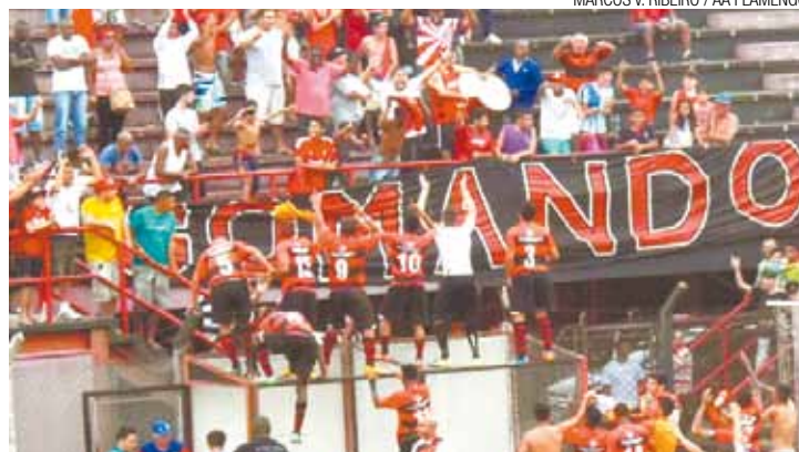
Longe de casa - Corvo manda semifinal inédita a 80 km de Guarulhos

Curiosamente, o palco da semifinal foi usado pelo adversário e parceiro Corinthians