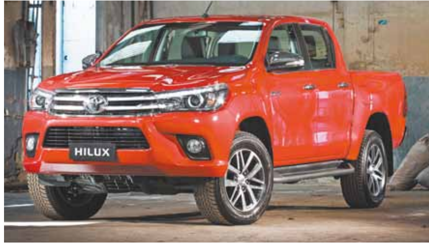
Inovação na dianteira - Faróis de LED com projetor e ajuste automático de altura