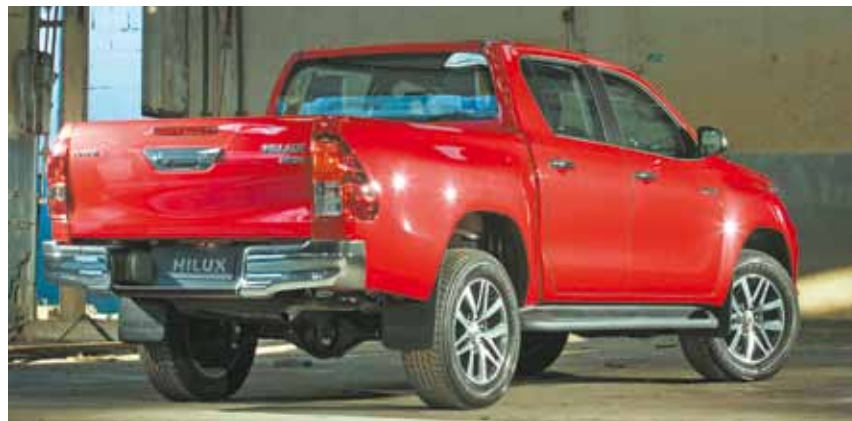
Tração 4x4 - Transmissão automática de seis velocidades na versões SR, SRV e SRX