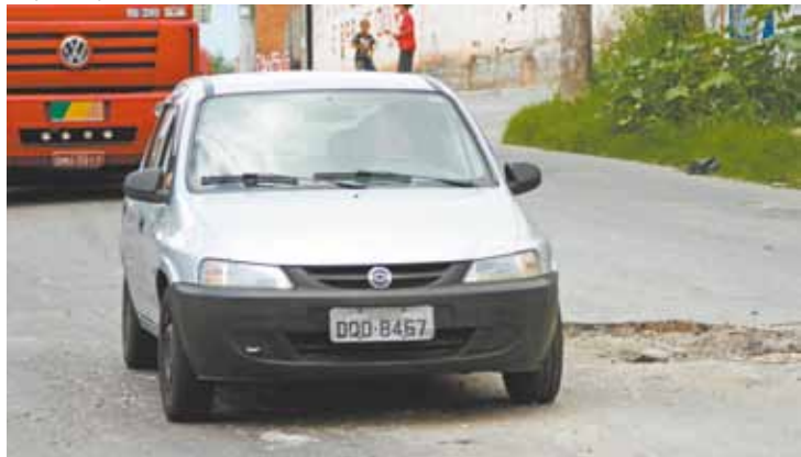
Transtorno - Buracos ficam na frente de escola do Jardim Novo Portugal