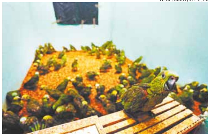
Maus tratos - Aves vivas foram encontradas em péssimas condições