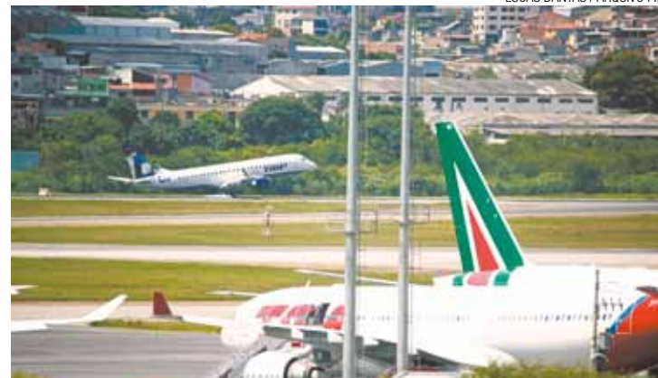
Decolando - Maior investimento do Fnac possibilita melhor infraestrutura