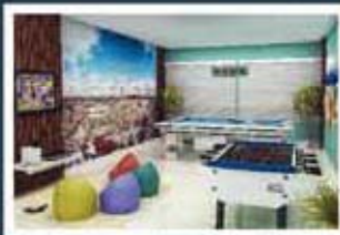
Ilustração artística do salão de jogos