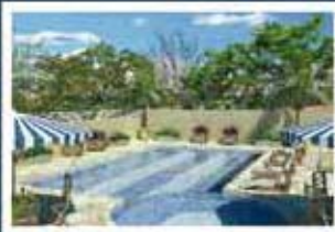
Ilustração artística da piscina