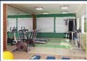
Ilustração artística do fitness