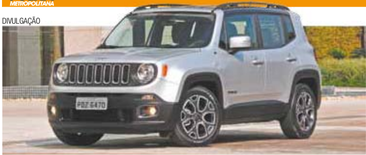
Edição limitada - Rodas aro 18', bancos de couro e teto bicolor preto