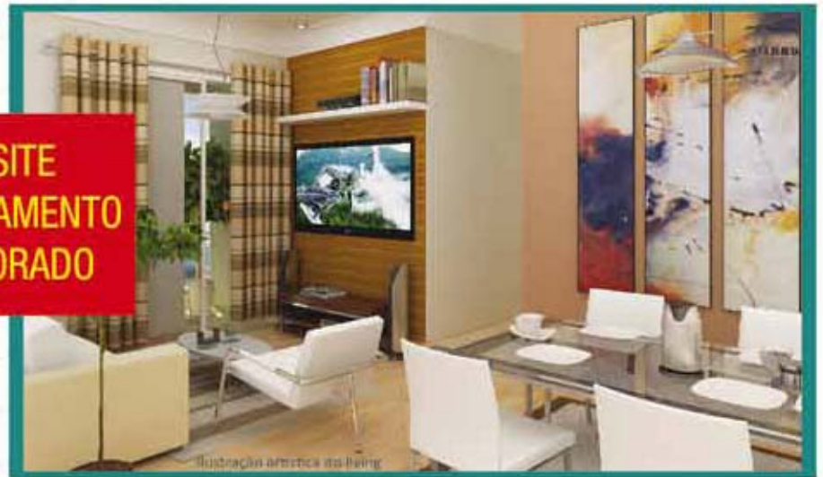
Ilustração artística do living