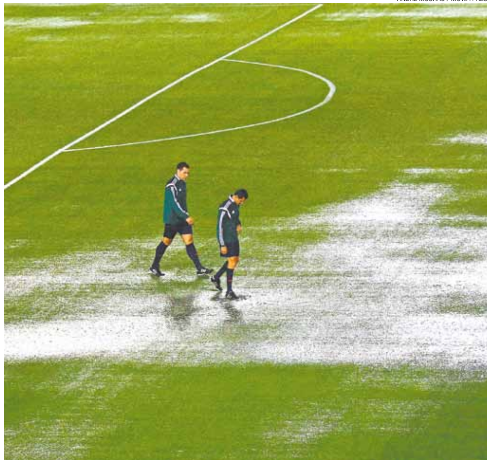
Alagado - Temporal castigou o gramado do estádio Monumental de Nuñez, ontem, e adiou a partida entre Brasil e Argentina, pelas Eliminatórias, para a noite de hoje, em Buenos Aires

A comissão técnica da Seleção Brasileira disse que a programação para o jogo contra o Peru, na terça-feira, vai ser alterada.