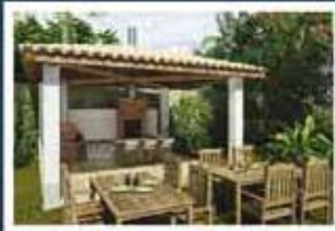
Ilustração artística da churrasqueira