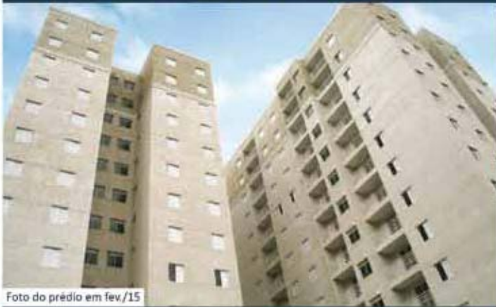
Foto do prédio em fev./15