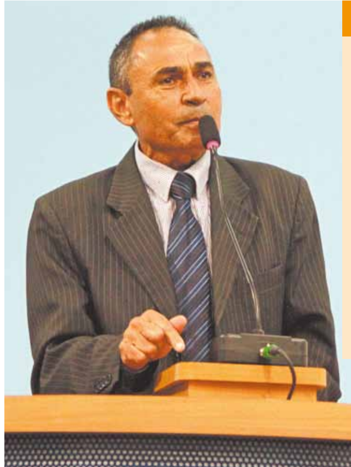
Oposição - Umbandistas torceram contra a aprovação do texto de Novinho