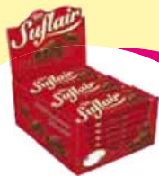
Choc. Suflair 20X50g Cada