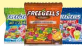
Bala Freegells 584g Cada