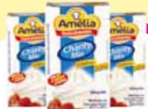
Chantilly Amelia Vigor 1kg Cada