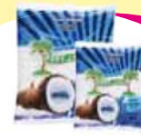
Coco Ralado Fresco 500g Cada