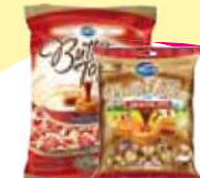
Bala Butter Toffee 750g Cada