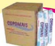
Copo desc Copomais 180ml - 100un Cada