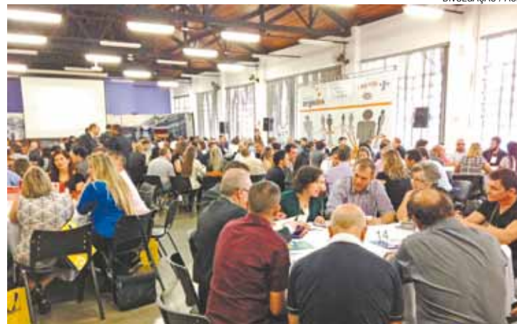
Networking - Encontro aproximou empresários de diferentes setores

Rua Silvestre Vasconcelos de Calmon, 517 – Vila Moreira – Guarulhos – SP Horário de Atendimento: 2ª à 6ª das 08:00 às 12:00 – 13:00 às 16:00