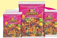
Dori gomest 1k Cada