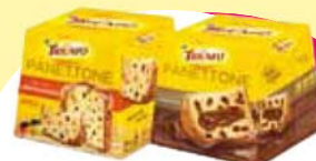
Triunfo panetone e chocotone 400g Cada