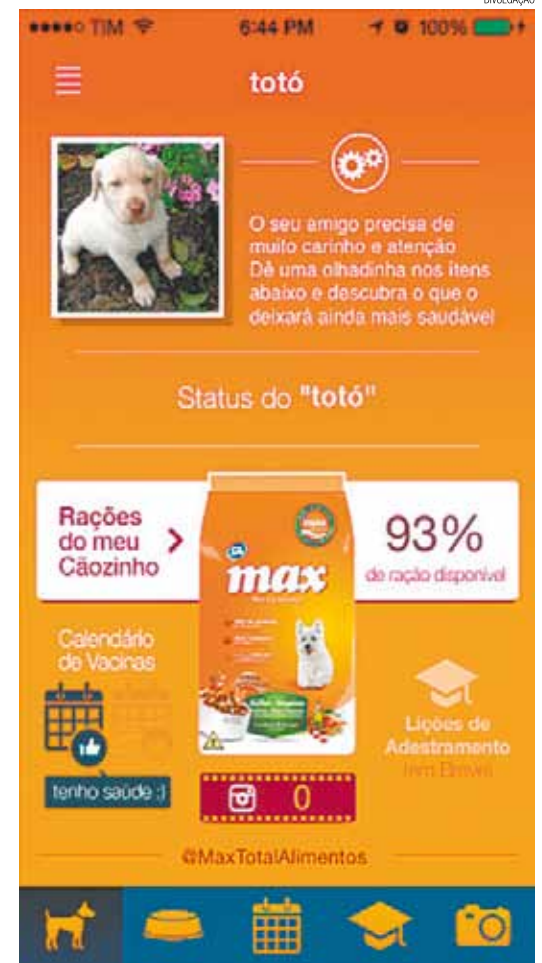
Modernidade - Smartphones têm diversas opções

Mantenha as informações de seu pet em um único local: seu smartphone. Cadastre lembretes com notificações no celular e acompanhe o peso do bichinho através de um gráfico gerado pelo app.