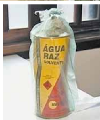
Prova - Lata de solvente foi apreendida pela polícia à época