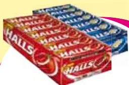
Adams drops halls 714g Cada