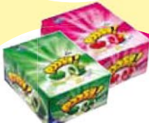
Chicle Poosh Sabores Cada