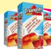
Leite Condensado mist Mineiro 395g Cada