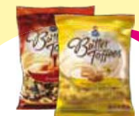
Arcor butter toffes 750g Cada