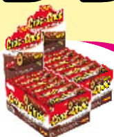
Jazam croc choc. chocolate 384g Cada