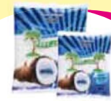
Coco Ralado Fresco 500g Cada