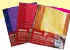
Embalagem Trufas Cromus Cada