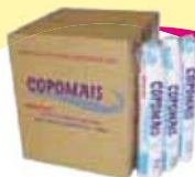
Copo desc Copomais 180ml - 100un Cada