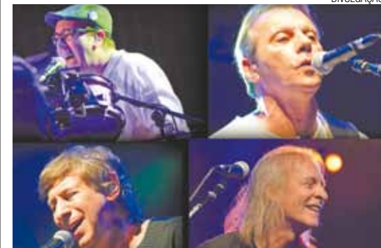
Vinís antológicos - Com a presença de clássicos