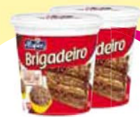
Brigadeiro Alispec 1,01Kg Cada