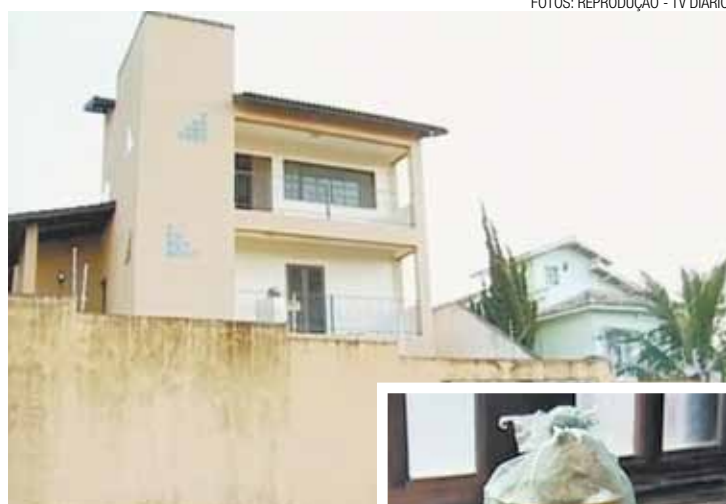
Local - República onde ocorreu o crime fica em Mogi das Cruzes

O crime aconteceu após uma reclamação de barulho feita pelo vizinho. Durante a briga, um dos moradores da república teria agredido o rapaz e o estudante de arquitetura teria colocado fogo na vítima. Na época o estudante de me-