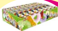
Docile pastilha mint rly 16x29g Cada