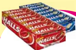
Adams drops halls 714g Cada