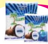
Coco Ralado Fresco 500g Cada