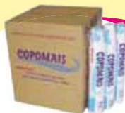
Copo desc Copomais 180ml - 100un Cada