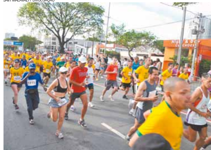
Prova - Competição acontece no dia 20, com largada no Bosque Maia

Regulamento está disponível no site k10.esp.br