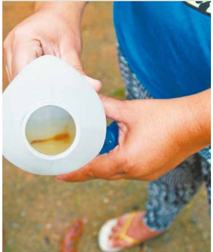
Perigo - Moradora mostra escorpião que encontrou na porta de casa

A pasta ressaltou ainda que “em todas as inspeções os moradores foram orientados sobre as medidas preventivas, visto que foi observado que eles não têm o hábito de descartar adequadamente lixo orgânico e outros resíduos, o que favorece a proliferação de roedores, escorpiões e insetos”. Uma nova vistoria está prevista para os próximos dias.