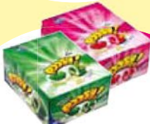
Chiclé Poosh Sabores Cada