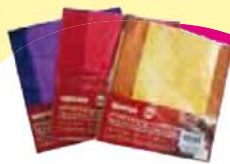
Embalagem Trufas Cromus Cada