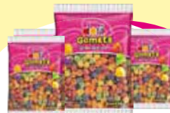
Dori gomest 1k Cada