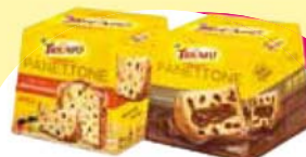
Triunfo panetone e chocotone 400g Cada