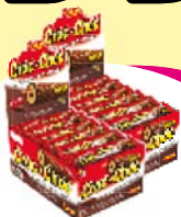
Jazam croc choc. chocolate 384g Cada