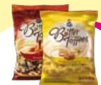
Arcor butter toffes 750g Cada