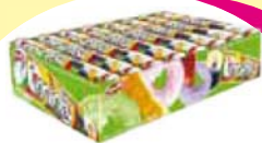
Docile pastilha mint rly 16x29g Cada