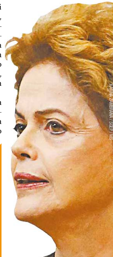
KARINA ZAMBRANA / SEEF / MS

O presidente da Câmara citou ainda o fato da revisão da meta fiscal, aprovada pelo plenário do Congresso ontem, como outro argumento para aceitar o pedido apresentado.