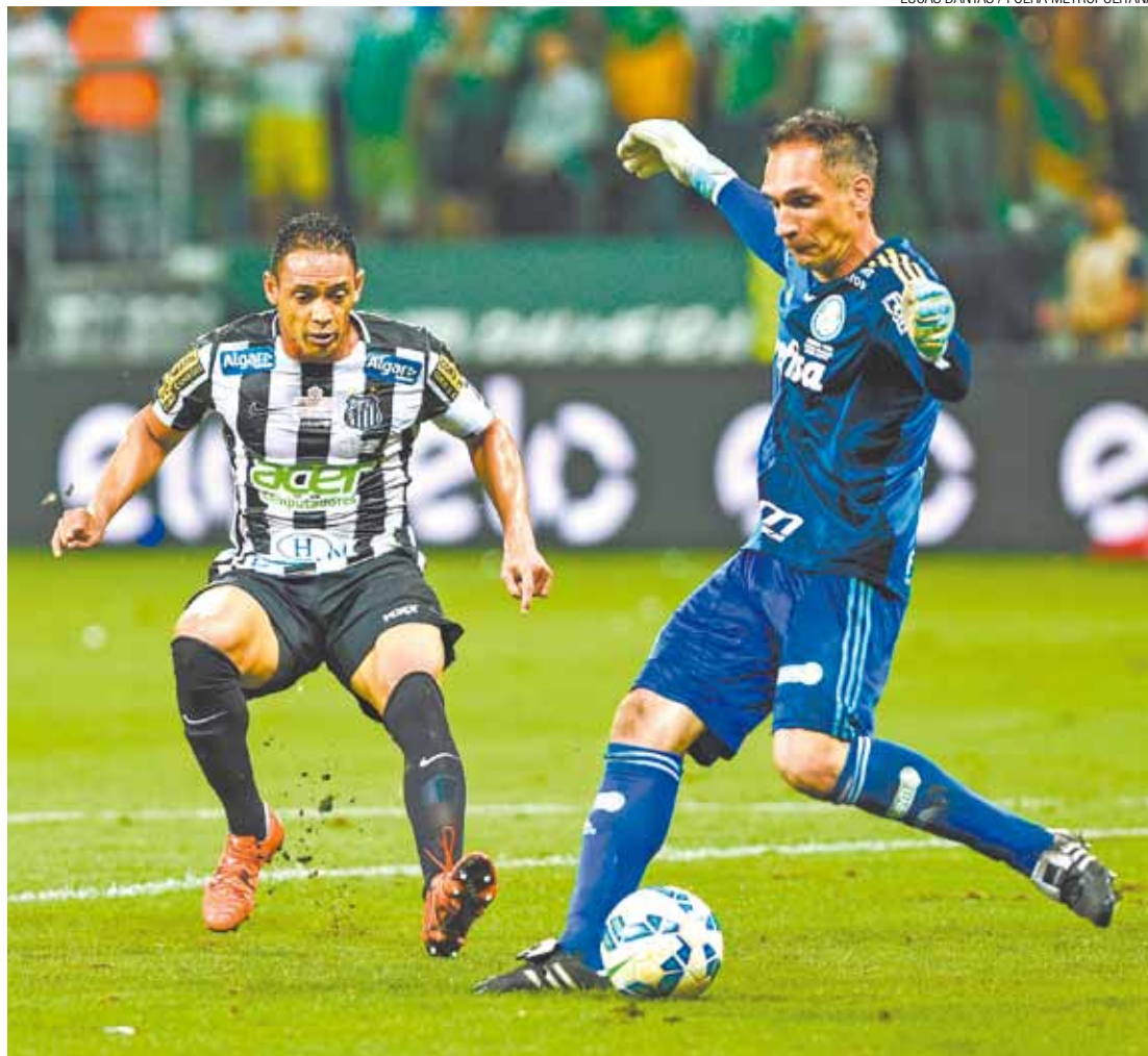
Duelo - Fernando Prass levou a melhor sobre o rival Ricardo Oliveira; seu gol de pênalti deu título ao Verdão

Vanderlei; Victor Ferraz, Gustavo Henrique, David Braz (Werley) e Zeca; Thiago Maia (Paulo Ricardo), Renato, Lucas Lima e Marquinhos Gabriel; Ricardo Oliveira e Gabriel (Geuvânio). Técnico: Dorival Júnior. GOLS - Dudu, aos 11 e aos 39, e Ricardo Oliveira, aos 41 minutos do segundo tempo. Nos pênaltis, Zé Roberto, Jackson, Cristaldo e Fernando Prass acertaram e Rafael Marques errou para o Palmeiras; Geuvânio, Lucas Lima e Ricardo Oliveira acertaram e Marquinhos Gabriel e Gustavo Henrique erraram para o Santos. CARTÕES AMARELOS - Dudu, João Pedro e Matheus Sales (Palmeiras); Gabriel (Santos). ÁRBITRO - Heber Roberto Lopes (Fifa/SC). RENDA - R$ 5.336.631,25. PÚBLICO - 39.660 pagantes. LOCAL - Estádio Allianz Parque, em São Paulo (SP).