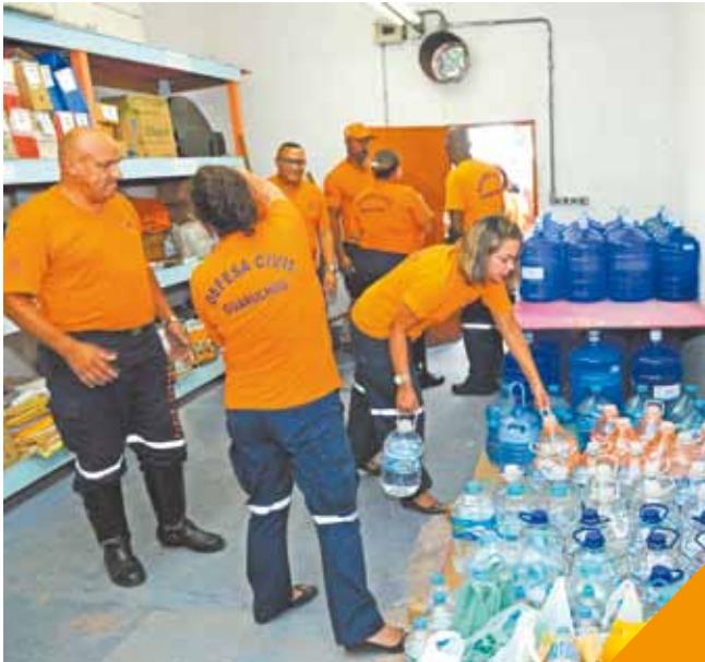
FÁBIO NUNES TEIXEIRA / PMG

Lançamento tem previsão inicial de ocorrer no dia 14