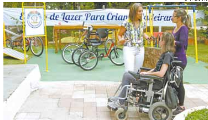
Positivo - Espaço na Vila Augusta ganha "Playground Criança Cadeirante"