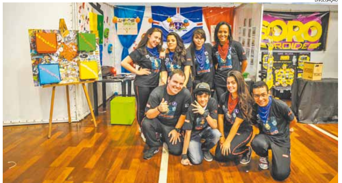
Projeto - A ideia é instalar lixos subterrâneos e um sensor avisará quando as sacolas estiverem cheias

Os times também participam do Desafio do Robô, modalidade da competição em que os alunos constroem e programam um robô autônomo capaz de cumprir missões predeterminadas.