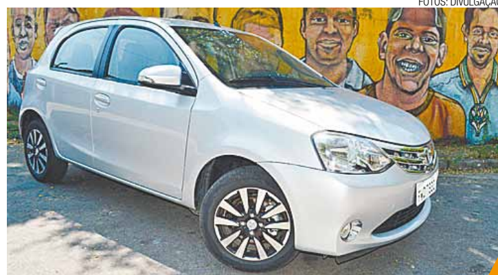
Compacto - Tem linha moderna e bastante arrojada na categoria