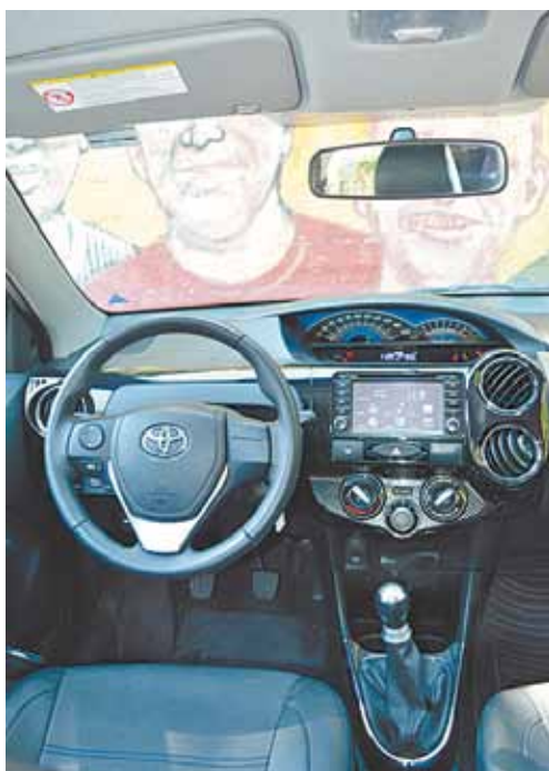
Interior - Moderno e também muito confortável

Desta forma, a Toyota deu um jeito e – de uma só vez – preparou um banho de loja e incluiu um sistema multimídia na nova versão Platinum, oferecida tanto no hatch como no sedã. O GuarulhosWeb avaliou o primeiro durante uma semana, quando pode perceber a grande evolução a partir do sistema de entretenimento incluído na versão XLS, topo de linha, batizada de Platinum. Até TV digital ele oferece quando não está em movimento. No preço, um tanto de exagero. Custa a partir dos R$ 53 mil, valor que deve fazer o consumidor pensar muito, já que a concorrência nesta faixa é repleta de opções.