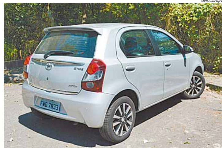
Agilidade - Na cidade ele se dá muito bem na troca de marchas