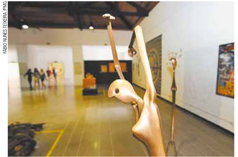
Diversidade - Salão reúne trabalhos de 34 artistas, de 14 estados

14º Salão de Arte Contemporânea de Guarulhos Em cartaz até 16 de janeiro, diariamente, das 8h às 23h Centro Municipal de Educação Adamastor - Avenida Monteiro Lobato, 734, Macedo Grátis