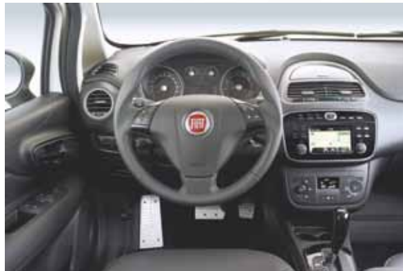
Interior - Central Multimídia Uconnect Touch NAV 5 é destaque