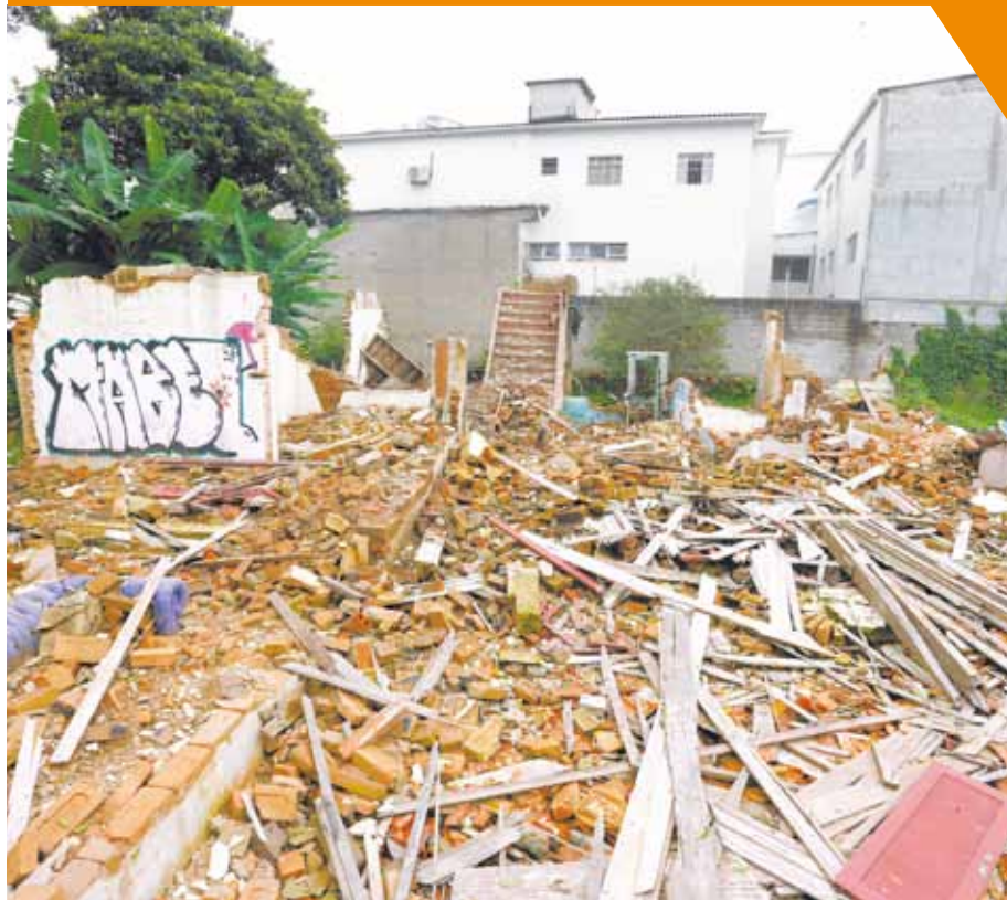
Medo - Moradores apontam criadouro de ratos na esquina da Rua Paraná com Antônio Iervolino

Terreno baldio acumula lixo e entulho na Vila Moreira Pág. 6