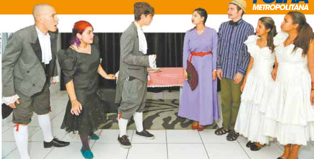
Palco - Academia DR&T apresenta duas divertidas peças, representadas por seus alunos-atores do módulo II