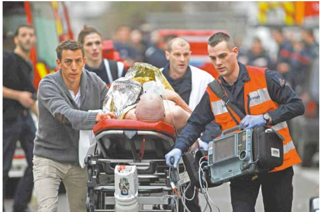
Socorro - Equipes de resgate prestam ajuda para os sobreviventes do ataque do grupo terrorista islâmico

chorando e segurando uma carta onde está escrito "Je suis Charlie" (Eu sou Charlie) frase que virou símbolo das manifestações de apoio à liberdade de expressão e em homenagem às vítimas do ataque. Após o atentado o Estado Islâmico se pronunciou dizendo que o ato dos irmãos deveria ser considerado pelos muçulmanos como heroico. Após dois dias do atentado os irmãos foram mortos, em uma operação da Polícia Francesa.