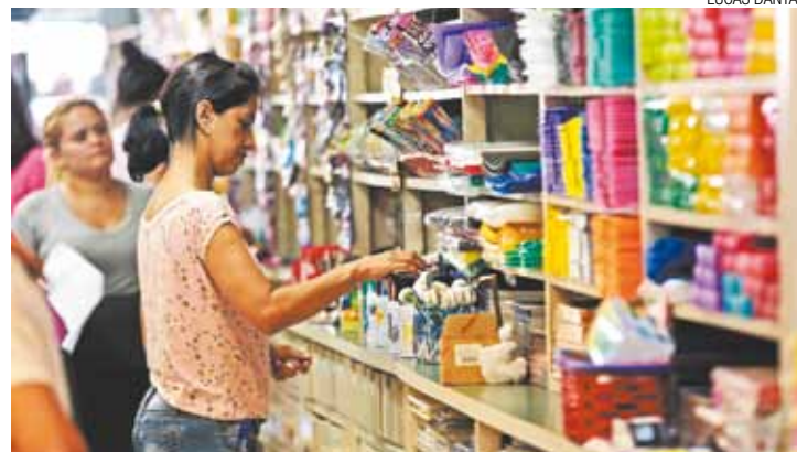
Janeiro - Consumidor não pode se esquecer dos gastos do início do ano

De acordo com o educador, para quem ainda quer comprar presentes de natal, o ideal é que até a metade do valor da parcela do 13º seja utilizado com esse tipo de compras. "Você tem que saber do que efetivamente precisa", disse. A professora concorda. "Tem que planejar a utilização desse salário, priorizar gastos necessários", afirmou.