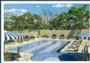
Ilustração artística da piscina