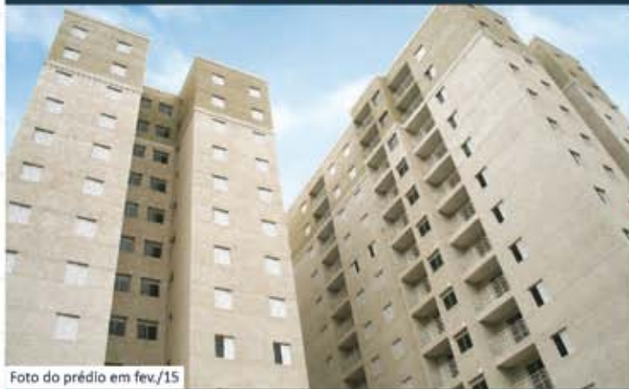
Foto do prédio em fev./15