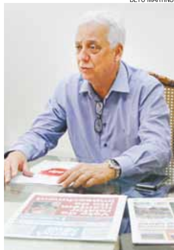
Confiança - Diretor acredita que clientes ficarão satisfeitos com a EDP

Em Guarulhos, os principais investimentos foram a ampliação da linha de distri-