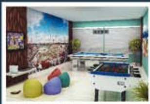
Ilustração artística do salão de jogos