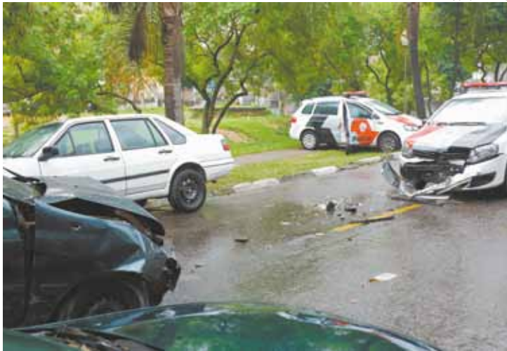
Colisão - Veículo guiado por acusados bateu em uma viatura da PM

Ao chegar na Rua Juquitiba, na Vila Flórida (Região Centro), o carro dos criminosos colidiu com uma viatura.