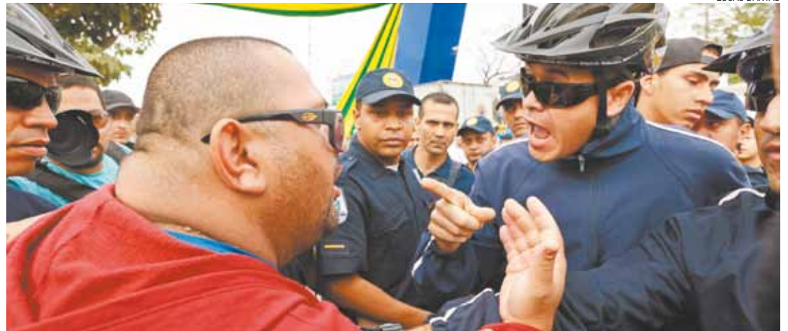
Discussão - Manifestante bate boca com guarda civil municipal durante confusão no desfile da Independência

O Guarulhos Livre ergueu uma faixa criticando a administração. Instantes depois, indivíduos simpatizantes do PT rasgaram a faixa e a confusão começou. A GCM apartou o empurra-empurra e chegou a utilizar gás lacrimogêneo. Duas crianças, que estavam junto ao grupo, exalaram o composto químico e precisaram ser retiradas. A PM teve que intervir e acalmar os participantes.