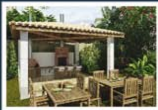
Ilustração artística da churrasqueira