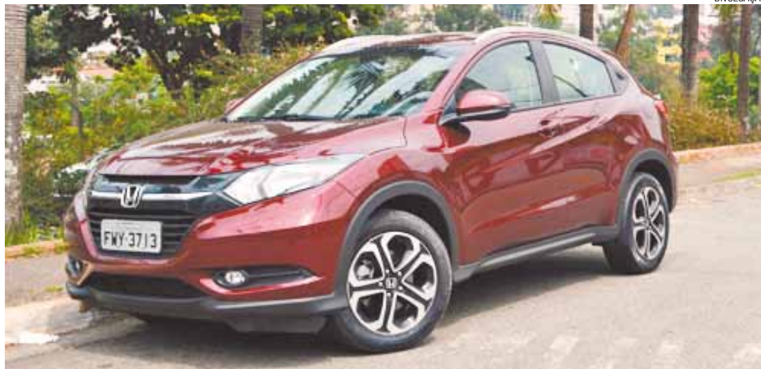
Líder - HR-V é bonito, funcional e robusto ao mesmo tempo. Por isso é o Honda que mais vende no Brasil

O bom espaço interno não significa um exagero do lado de fora. São 4.295 mm de comprimento (tamanho de carros compactos um pouco maiores), 1,586 mm de altura, 2,610 mm de entre-eixos, 1,770 mm de largura e a disposição central do tanque de combustível. Por isso, cinco passageiros vão muito bem, sem apertos. O porta-malas possui 437 litros de capacidade. Ou seja, dá para levar a bagagem de todo mundo.