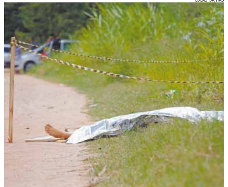
Assassinato - Vítima foi morta com tiros na cabeça em outro bairro

Até o final desta edição ninguém havia sido preso. O caso será investigado pelo Setor de Homicídios.