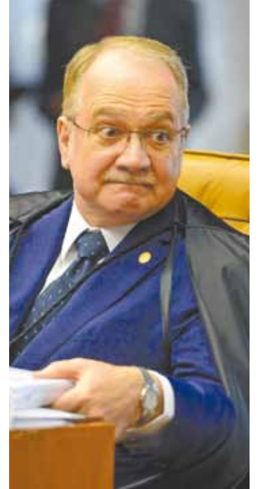
Fachin - Voto extenso do ministro foi rechaçado pela maioria ontem

Até o momento, o Senado tem base aliada mais fiel do que a da Câmara dos Deputados, conduzida pelo deputado Eduardo Cunha (PMDB-RJ), rompido com o governo.