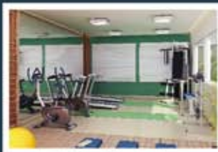
Ilustração artística do fitness