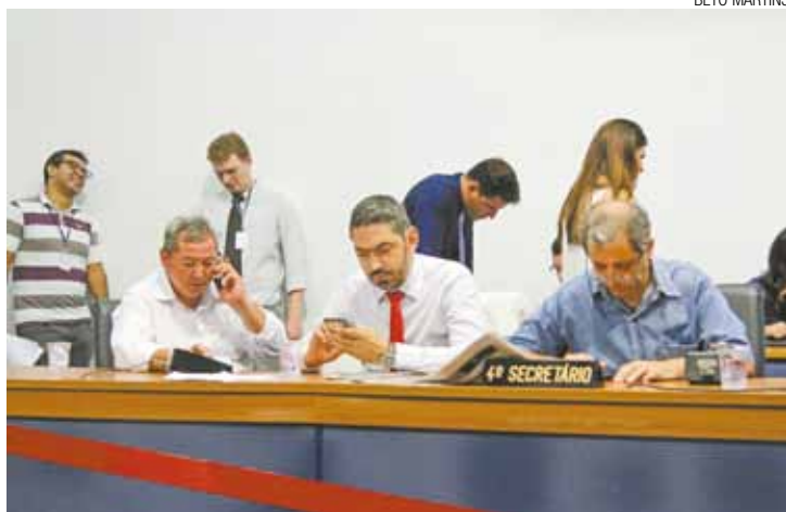
Quase férias - Votações da Câmara devem encerrar hoje com orçamento

A medida foi alvo de críticas do vereador Gutí (PSB). "Não se trata apenas de ade-