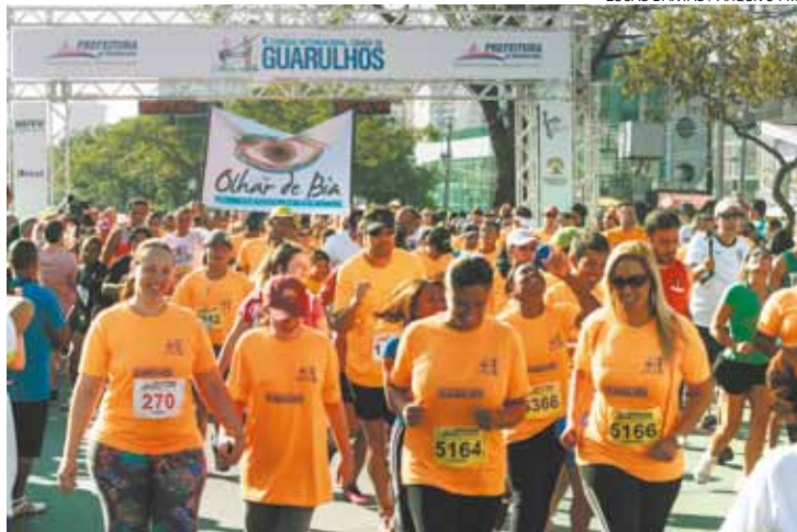
Fim de ano - Tradicional prova em Guarulhos quase não aconteceu

DA REDAÇÃO - Os atletas inscritos na 7ª Corrida Internacional Cidade de Guarulhos deverão retirar hoje os kits individuais de participação, compostos por camiseta, medalha e chip de cronometragem. A retirada deverá ser feita das 10h às 16h, no Shopping Pátio Guarulhos (ao lado da loja Marisa), que fica na Avenida Rosa Molina Pannocchia, 331, na Vila Rio de Janeiro. Não haverá entrega de kits no dia da prova.