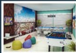
Ilustração artística do salão de jogos