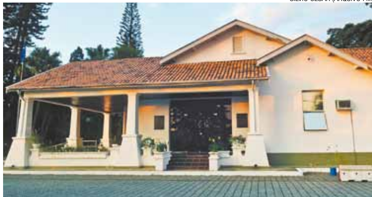
Casa Branca - O Paço Municipal é a sede da Prefeitura de Guarulhos