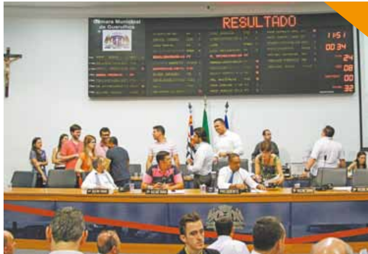
Recesso - Atividades da Câmara só retornam no dia 2 de fevereiro