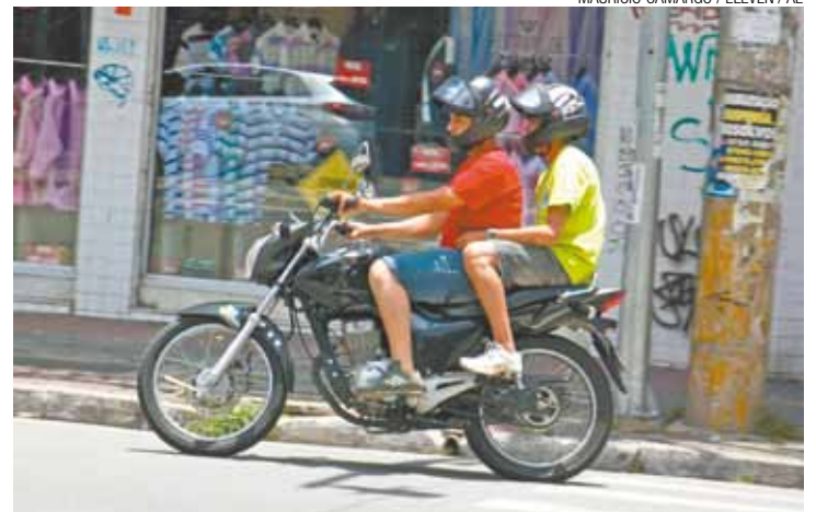
Segurança - Alckmin terá 15 dias para decidir se sanciona ou não

Nessa modalidade de crime, os assaltantes agem em dupla abordando pessoas no momento em que deixam as agências bancárias. Segun-