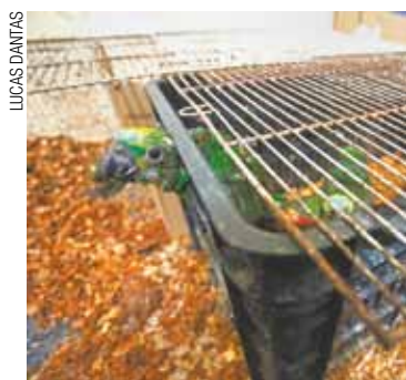
Prisão - Ave tenta sair da caixa

gou ao local por meio de denúncia anônima. No endereço há duas residências. Na casa da frente funcionava o cativeiro. As aves estavam espalhadas em quatro cômodos.