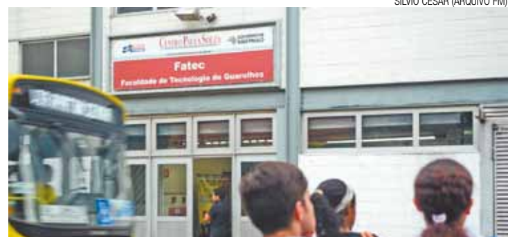
Futuro incerto - Estudantes ainda não sabem se serão despejados

O contrato de aluguel acaba agora no fim de dezembro e, mesmo sem ação de despejo, a não renovação pode obrigar a faculdade a mudar de endereço. Atualmente, uma nova sede para a instituição está em construção