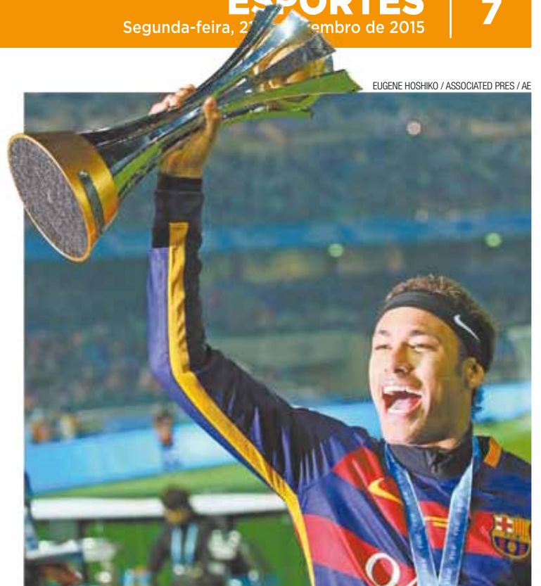
Vitorioso - Neymar disse que vive um dos melhores momentos da vida