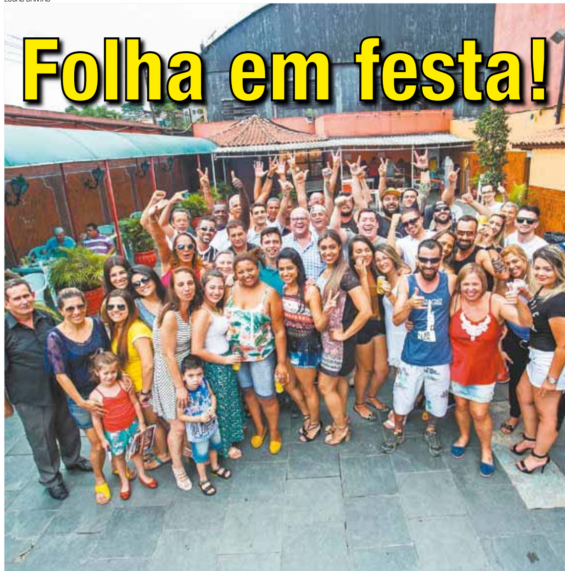
Comemoração - Funcionários celebraram o ano de conquistas com churrasco no Mansão Danças. Pág. 6

Após ficar três anos na 8ª posição nacional, a economia guarulhense perdeu fôlego e caiu cinco colocações, apontam dados divulgados pelo IBGE. O PIB guarulhense somou R$ 49,3 bilhões, contra R$ 57,3 bilhões de Porto Alegre, atual 8ª colocada. Em novembro de 2013, a Folha Metropolitana havia antecipado que a cidade registraria "Pibinho" naquele ano (reprodução abaixo). Pág. 4