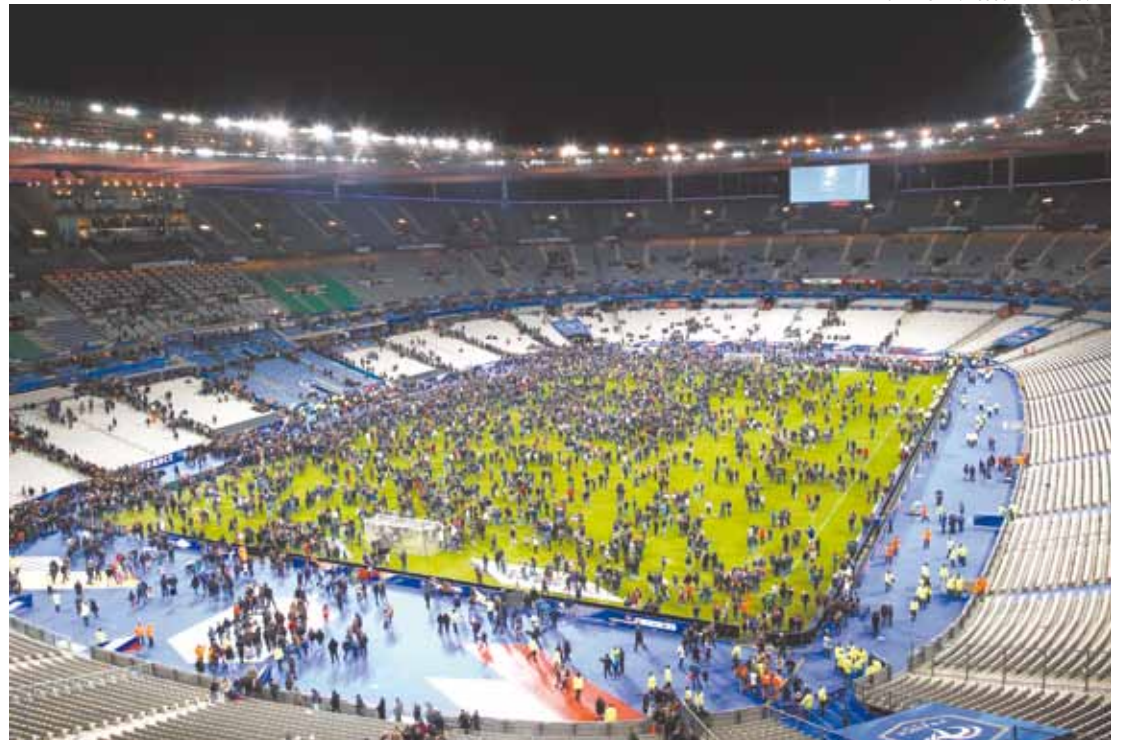
Terror - Grupo de terroristas agiram em três locais diferentes deixando centenas de mortos em Paris

O número de mortos na Bataclan, que abrigava um show de heavy metal do grupo Eagles of Death Metal, onde pessoas tinham sido feitas reféns. No total morreram 129 pessoas.