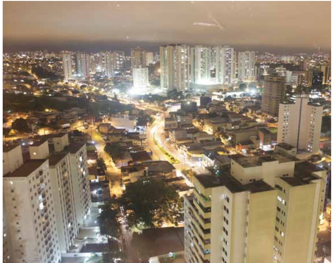
Passado foi melhor - Em 2010, o PIB guarulhense foi de R$ 38,1 bilhões, aponta dado atualizado pelo IBGE