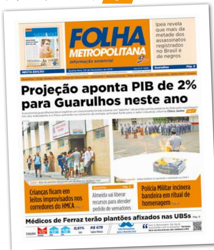
Na frente - Folha Metropolitana de 2013 antecipou resultado ruim

Após ficar três anos na 8ª posição nacional, a economia guarulhense perdeu fôlego e caiu cinco colocações, apontam dados divulgados pelo IBGE. O PIB guarulhense somou R$ 49,3 bilhões, contra R$ 57,3 bilhões de Porto Alegre, atual 8ª colocada. Em novembro de 2013, a Folha Metropolitana havia antecipado que a cidade registraria "Pibinho" naquele ano (reprodução abaixo). Pág. 4