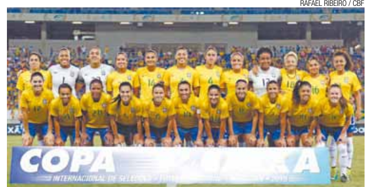
Revanche - Seleção se vinga de título perdido para o Canadá em 2010

No Torneio Internacional, o Brasil só precisava de