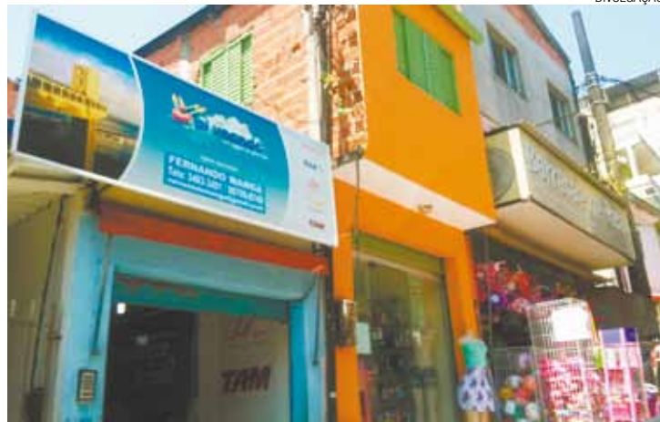
Fácil - Empresa já possui 315 unidades em periferias de todo o País

A primeira loja foi aberta em 2010, em São Vicente (Litoral Paulista). Hoje são 315 em todo o Brasil, vendendo cerca de 8 mil passagens por mês.