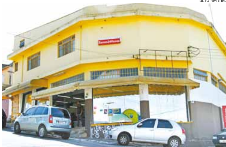
Conhecido - Um dos assaltantes seria ex-funcionário, segundo testemunha

Os criminosos chegaram ao local por volta das 6h e renderam dois funcionários do estabelecimento. Um deles chegou a ser agredido com uma arma por um dos assaltantes. Foram solicitados os apare-