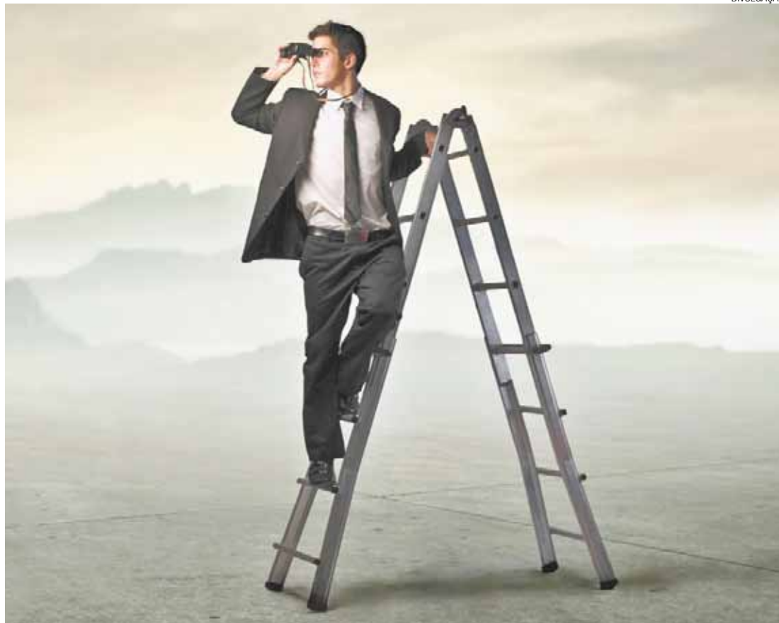
Prudência - O nascimento de uma nova empresa depende da visão a curto e médio prazos, afirma consultora