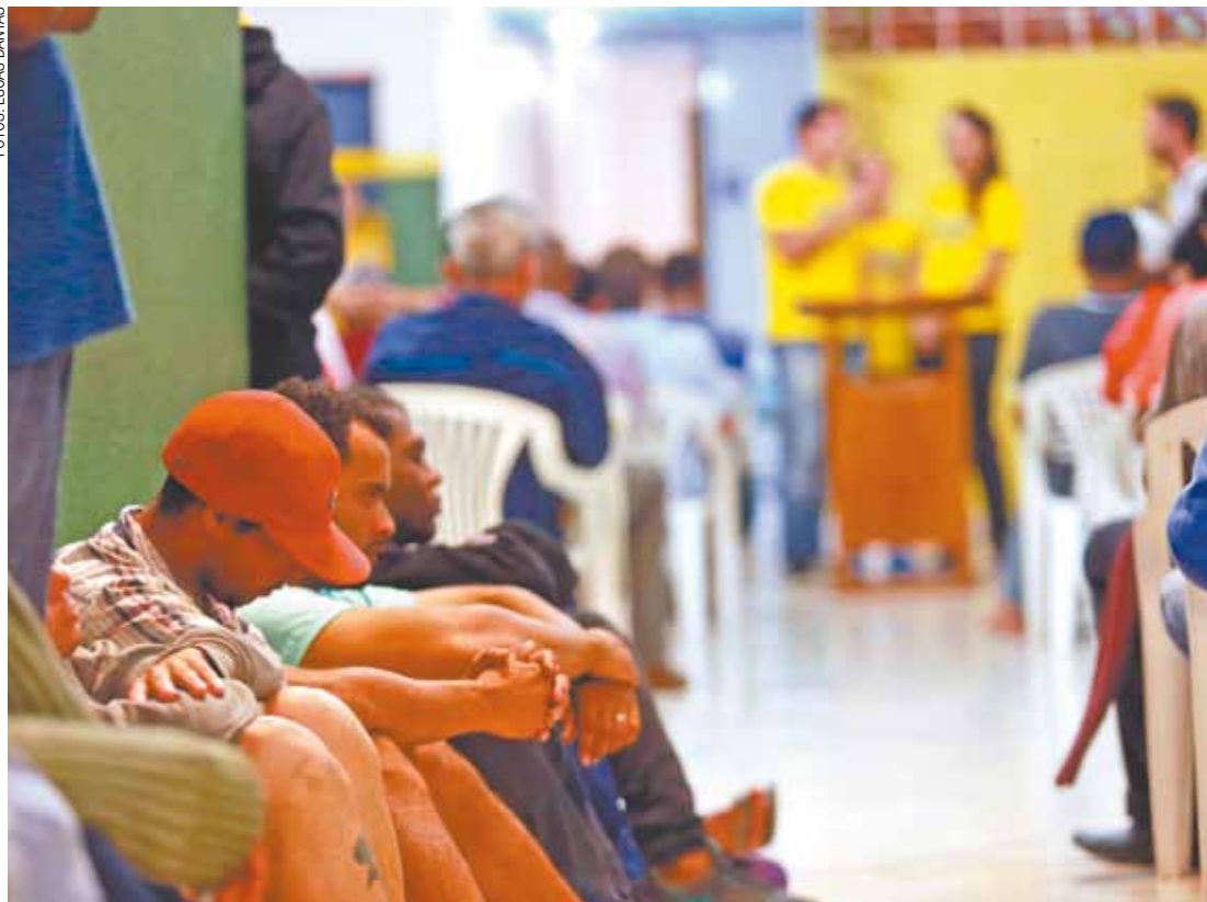
Nova chance - Moradores de rua e usuários de crack buscam reabilitação e uma nova oportunidade na vida