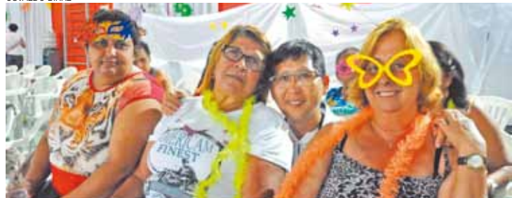
Folia - Este é o quarto ano consecutivo do "Carnaval da Melhor Idade"