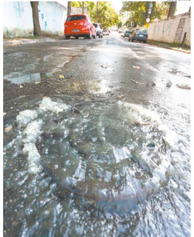
Dejetos - Água malcheirosa escorre pela Rua Assis Chateaubriand

O esgoto vazou por três bueiros existentes no local