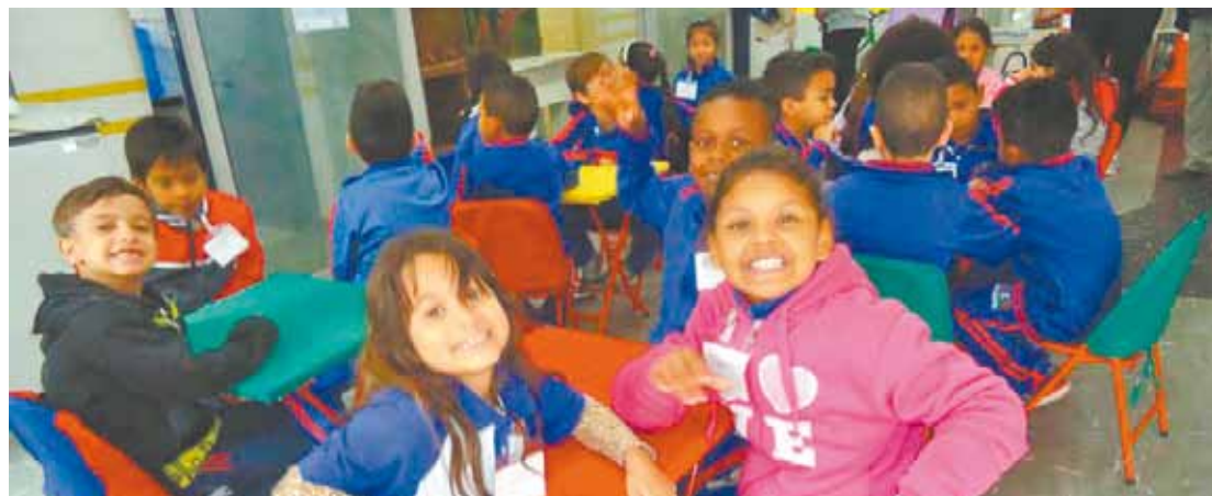
Atividades - A Cidade Mirim Ayrton Senna da Silva funciona dentro do Parque Fracalanza, na Vila Augusta