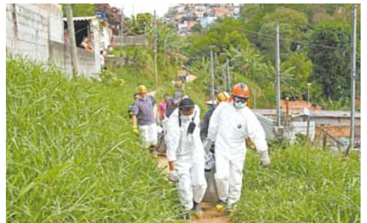
Medo - Peritos retiram corpos de cemitério clandestino no Recreio São Jorge