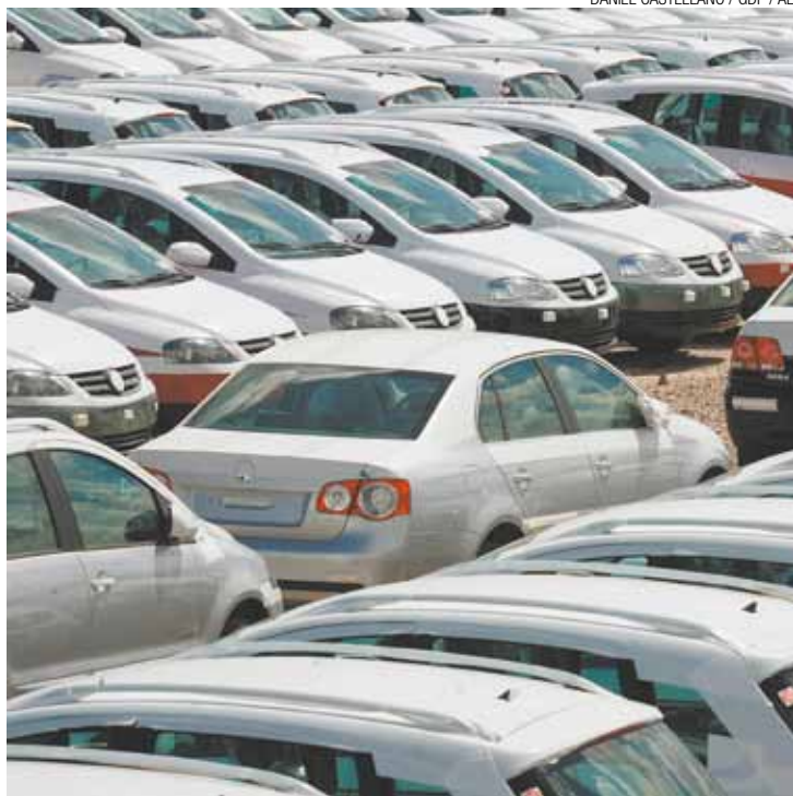
Retração - Resultado em Guarulhos é o pior dos últimos quatro anos

Em 2015, 14.686 automóveis foram emplacados na cidade. No ano anterior o número foi de 23.176. Se a comparação continuar com os anos de 2013, 2012 e 2011 a situação fica ainda pior, respectivamente com 25.339, 24.450 e 29.338 emplacamentos. Os números incluem também ônibus, motos, utilitários, cami-