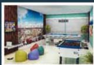
Ilustração artística do salão de jogos