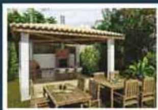
Ilustração artística da churrasqueira