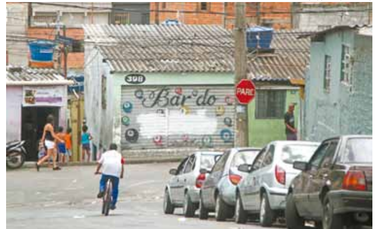
Suspeita - Polícia trabalha com a hipótese de vingança por morte de PM