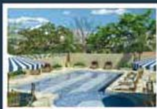
Ilustração artística da piscina