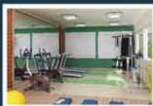
Ilustração artística do fitness