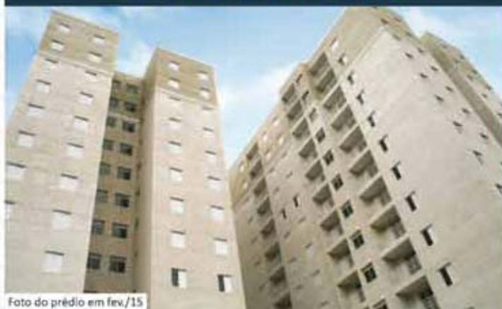
Foto do prédio em fev./15