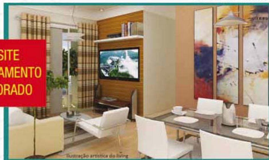
Ilustração artística do living