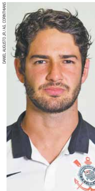
Fica ou sai? Atacante chegou a ser relacionado para viagem aos EUA

Os representantes de Pato acharam melhor que ele não viajasse com o time enquanto a sua situação continua indefinida. Os empresários do jogador buscam levá-lo para um clube na Europa.