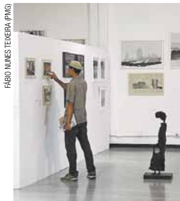
Exposição - Mostra que reúne 83 obras pode ser vista até sábado

Cerimônia de anúncio dos premiados no 14º Salão de Arte Contemporânea de Guarulhos e encerramento da exposição Sábado, dia 16, às 19h - Adamastor Centro – Avenida Monteiro Lobato, 734, Macedo - Entrada franca