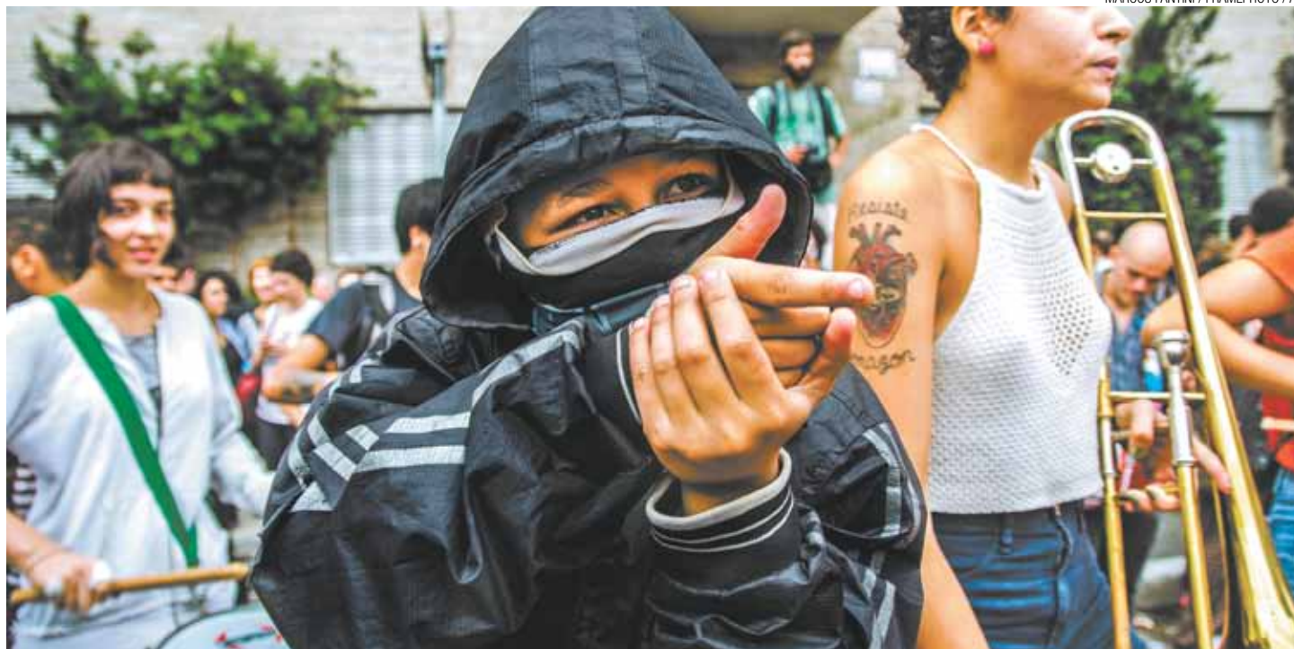
Quadrilha - Grupo esconde rosto e causa confusão em protestos; para secretário, imagens mostram que eles vandalizam e atacam a polícia

Moraes afirma que, apesar de estarem soltos, os suspeitos seguirão sendo investigados pela Polícia Civil. "Nós vamos continuar tipificando os casos não só como dano ao patrimônio público, como agressões, e, em se tratando de black blocs, vai ser tipificado também como organização criminosa", afirmou Moraes em coletiva no Palácio dos Bandeirantes, na Zona Sul.