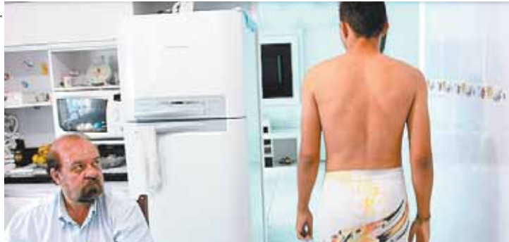
Produção local - Filme conta a história de quatro personagens

Dirigido por Fernando Laxus Kenpachi, 8/8o Sobrevivência mostra a vida de quatro personagens, que são obrigados a enfrentar seus medos e julgamentos para sobreviverem em Guarulhos. Amor, sexo, religião, amizade e cultura estão entre os tópicos que os levam a escolher mudar de comportamento ou per-