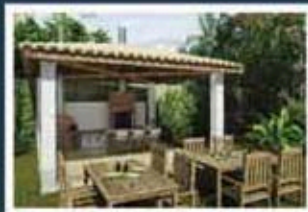
Ilustração artística da churrasqueira