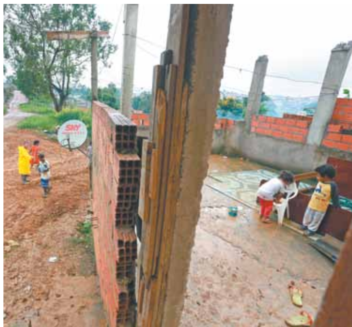
Despedida - Crianças brincam em casas já sem-teto após desocupação