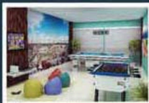
Ilustração artística do salão de jogos