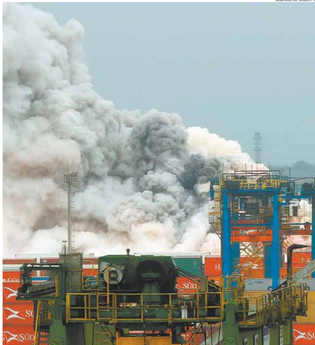
Reação química - Vazamento em container, junto com água da chuva, causou a nuvem tóxica no litoral de SP

A Prefeitura do Guarujá orientou os moradores da região a deixarem suas casas.