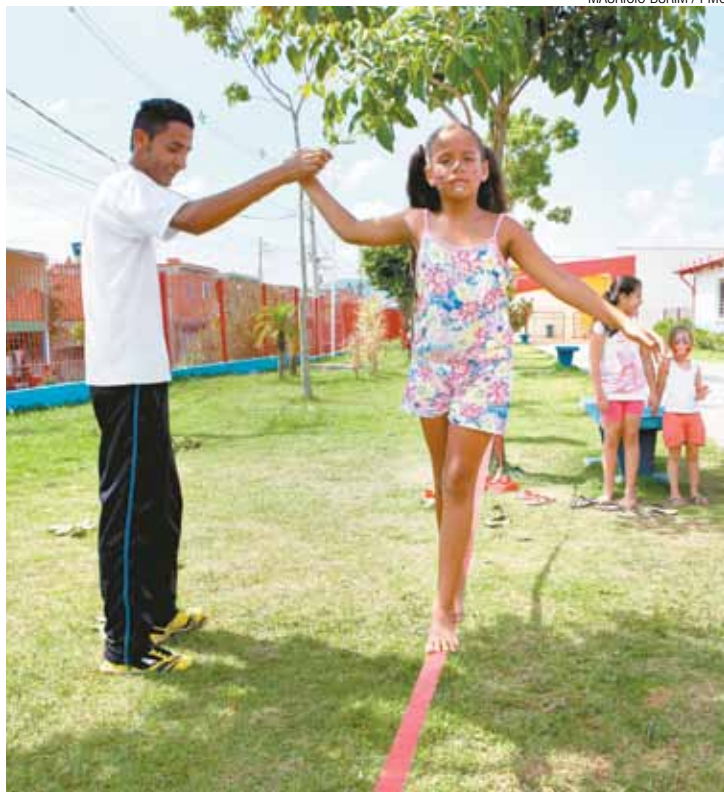
Projeto - Atividades propiciam desenvolvimento lúdico e comunitário

ter a forma, a programação do CEU Pimentas é ideal, com iniciação esportiva, tênis de mesa, dança do ventre, caminhada e corrida, e muitos jogos e brincadeiras para a criançada. Abaixo, link com programação completa do Brincando nas Férias, também publicado no Boletim Acontece na Rede: http://novo.guarulhos.sp.gov.br/index.php?option=com_content&view=article&id=21813