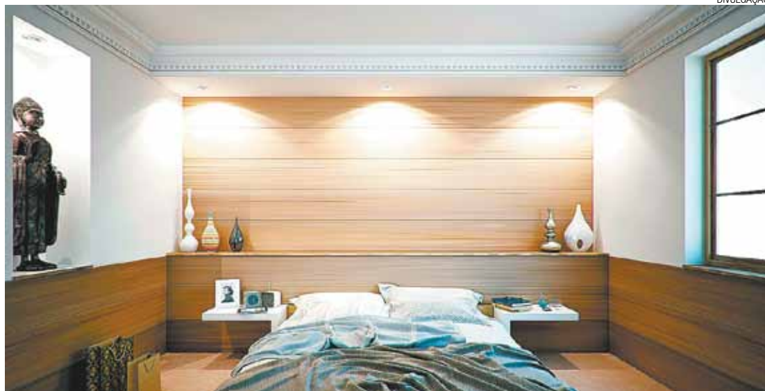
Casa colorida - Brasileiros têm aderido ao uso de cores para decoração dos ambientes internos das casas