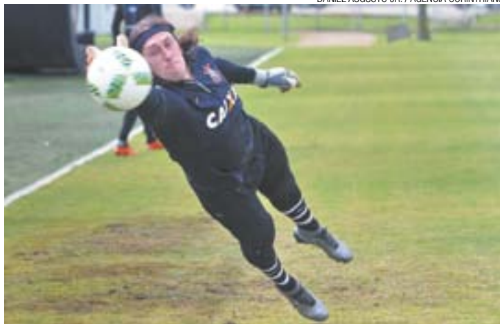
Calma - Após reviravolta em negociação, goleiro viajou para pré-temporada

“Nos primeiros jogos vamos precisar de um pouco de paciência para entrosar. Saíram jogadores que estavam acostumados a jogar juntos”, afirmou o goleiro, ontem, du-