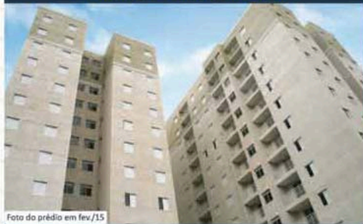
Foto do prédio em fev./15