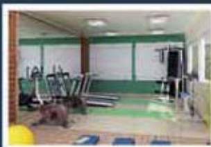
Ilustração artística do fitness