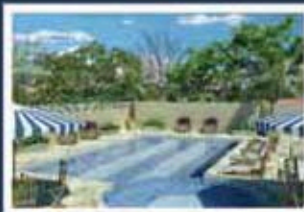
Ilustração artística da piscina