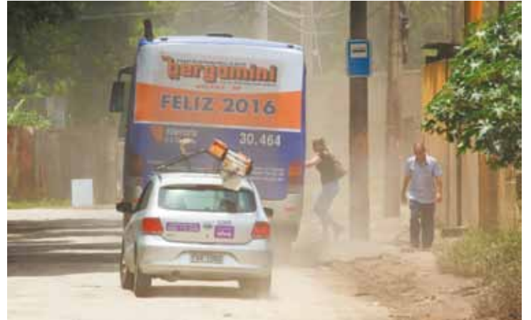
Pó - Usuários do transporte público também se queixam da poeira