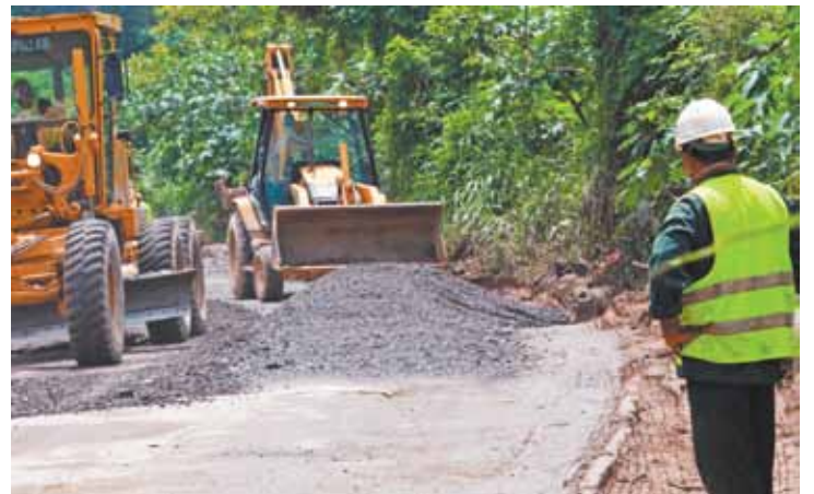
Reparos - Acciona diz que não compete a ela a manutenção deste trecho