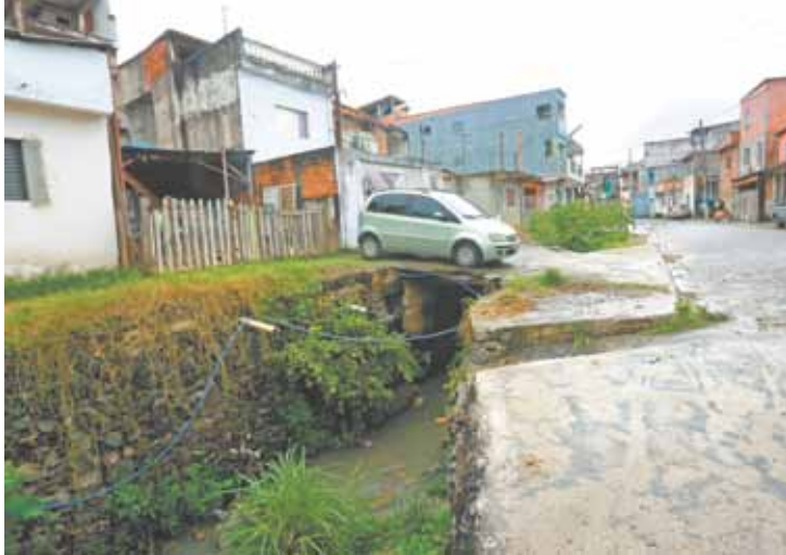
Defesa - Residentes notificados na Rua das Oliveiras não figuram na ação