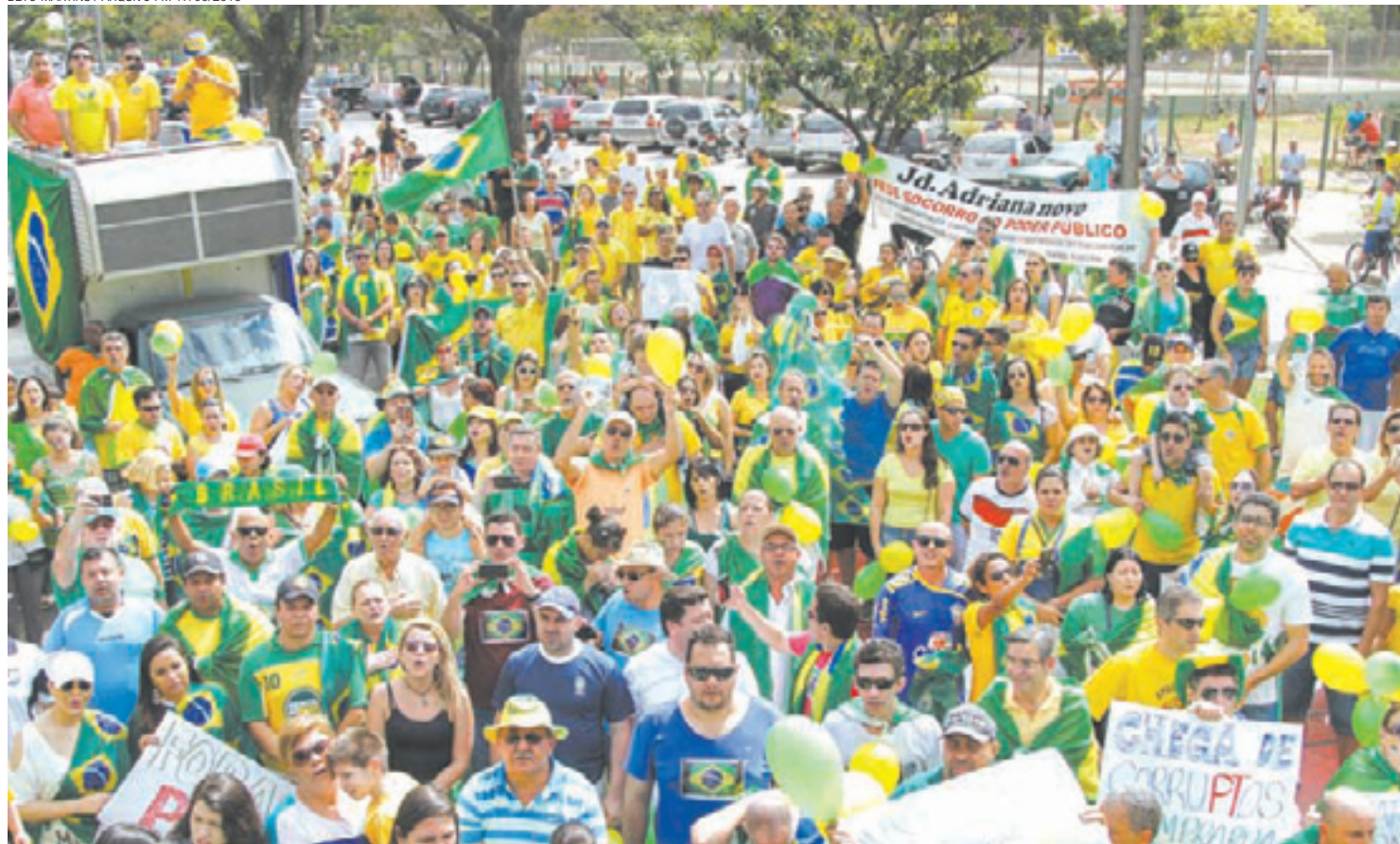
Basta de corrupção - Exigindo mais lisura nas administrações públicas, guarulhenses foram às ruas em 2015 protestar contra malfeitos dos governos