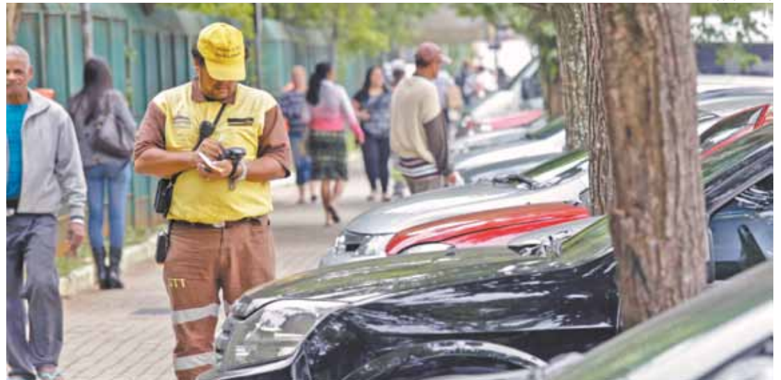
Rigor - No ano passado 24.748 condutores foram notificados a responder a processo de suspensão da carteira

Segundo o Detran de São Paulo, o crescimento no número de punições se deve ao aprimoramento do sistema interno da instituição, como a implantação do Sistema Integrado de Multas (SIM), em outubro de 2014, que detecta os motoristas com mais de 20 pontos na carteira.