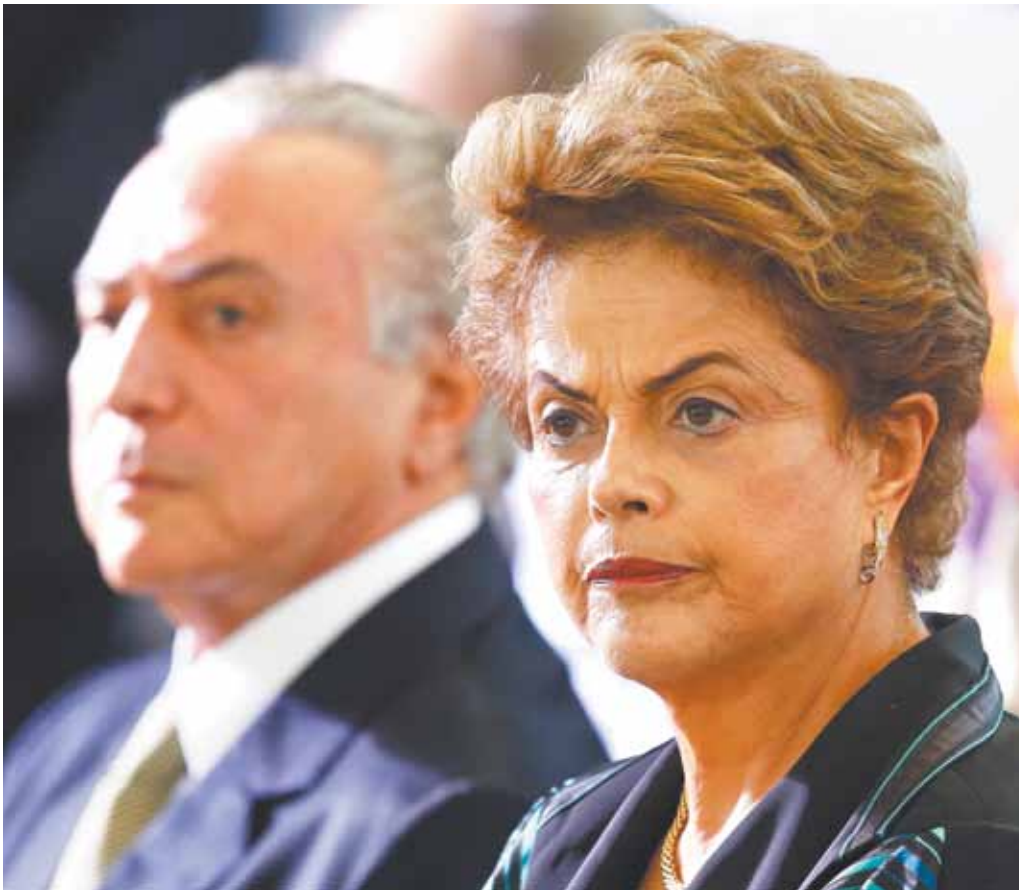
Amigos e rivais - Presidente Dilma Rousseff e o vice Michel Temer disputaram duas eleições juntos

No fim de 2015, Temer reclamou que é tratado como ‘vice decorativo’ pelo PT