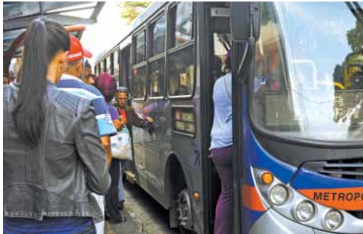
Tarifa - Passagem de ônibus subiu de R$ 3,50 para R$ 3,80 dia 3

“Com o aumento de demissões, em todos os setores, muitos desempregados estão tendo problemas para resol-