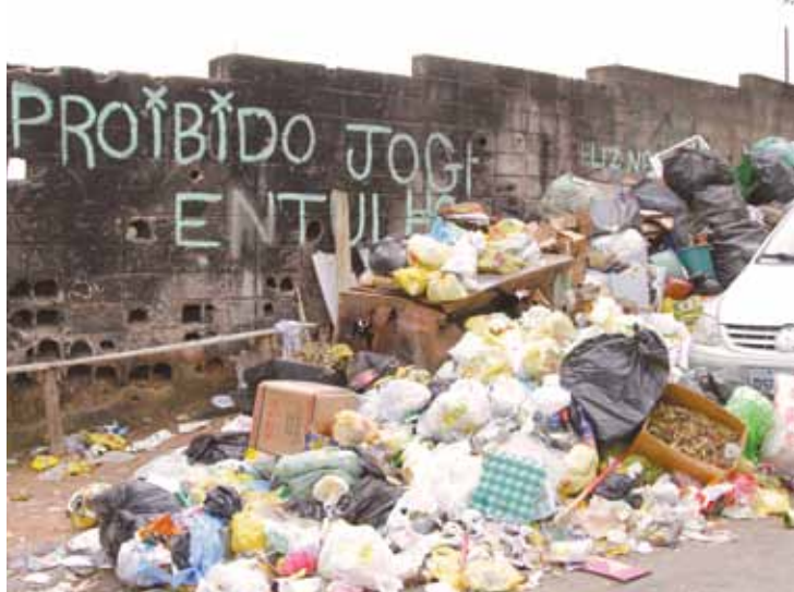
Sujeira - Apesar do aviso, lixo é despejado na Rua Conceição do Rio Verde