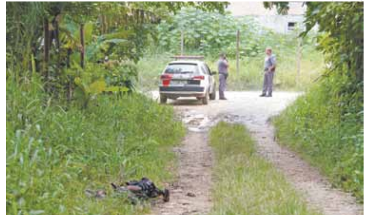
Matagal - Vítima encontrada em estrada ainda não foi reconhecida

Segundo a Polícia, por volta das 23h do domingo, 17, uma fumaça começou a sair de uma via paralela à estrada. Um dos moradores pensou que fosse lixo quei-