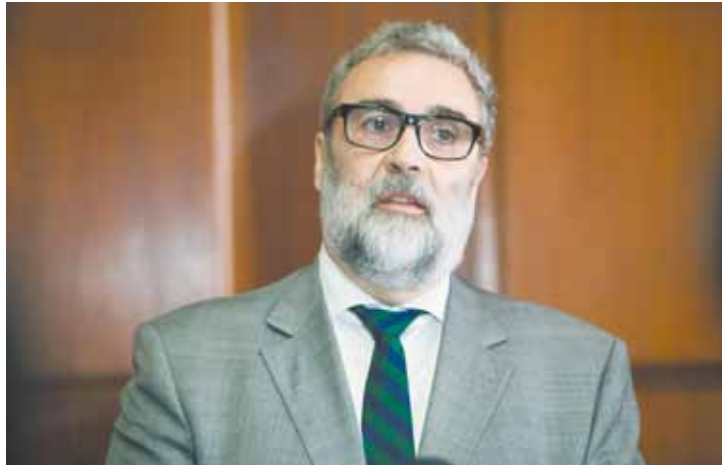
Conselho - Villela sugeriu que municípios se unam por securitização

A securitização consiste em transformar pendências financeiras em títulos para venda a instituições financeiras. Na tese, as prefeituras aceitam um valor menor pelo título e deixam a empresa responsável fazer a cobrança do devedor.