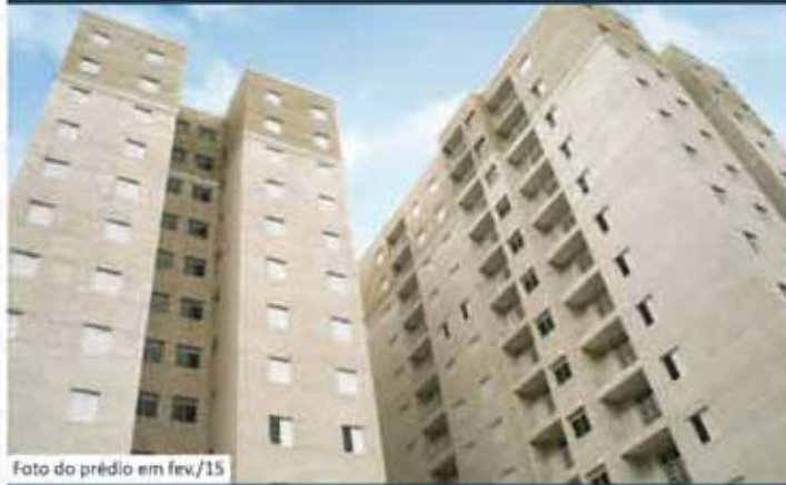
Foto do prédio em fev./15