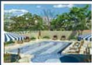
Ilustração artística da piscina