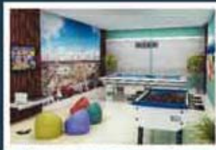
Ilustração artística do salão de jogos