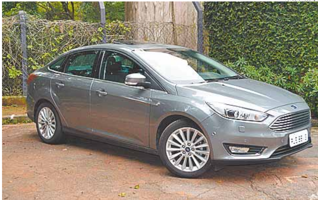
Design - Versão avaliada tem linhas modernas, inspiradas na silhueta dos demais carros globais da marca

A lateral tem linhas ágeis e o compartimento do porta-malas – com capacidade para 421 litros de bagagem – está integrado ao conjunto. Conta com rodas de liga leve de 17 polegadas de série.