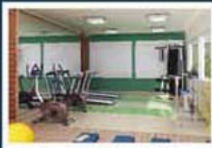
Ilustração artística do fitness