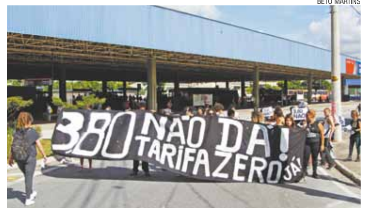
Protesto - Grupo partiu do Terminal de ônibus da EMTU, no Parque Cecap

A Secretaria de Transportes e Trânsito (STT) confirmou ter recebido o texto, o qual seguirá os trâmites normais de todos os documentos.