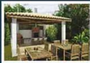
Ilustração artística da churrasqueira