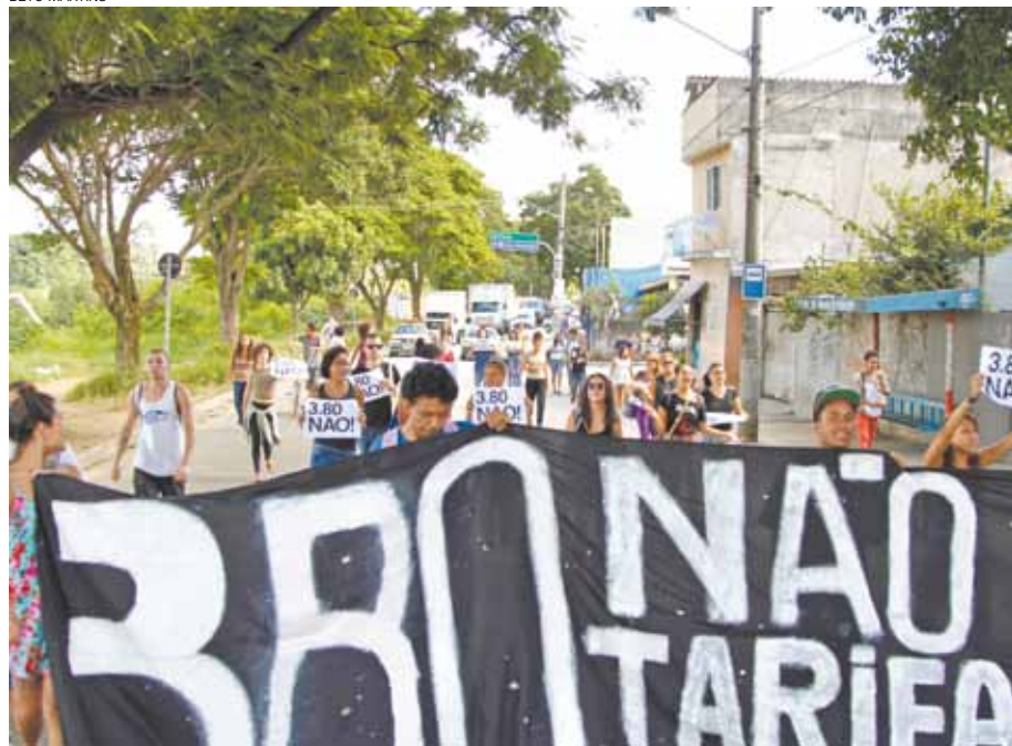
Protesto - Manifestantes caminharam do Terminal Cecap até a Secretaria de Transportes