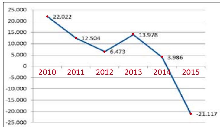
Balanço - Criação de vagas em 2015 despencou de 22 mil para 21 mil

A perda nacional de postos de trabalho chegou a 1.542.371. Esse total de trabalhadores cortados é maior que o número de habitantes no município de Guarulhos. A cidade guarulhense conta atualmente com 1,4 milhão de pessoas, conforme estimativas atuais do IBGE.