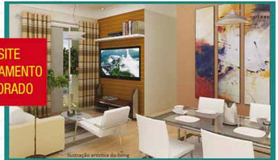
Ilustração artística do living