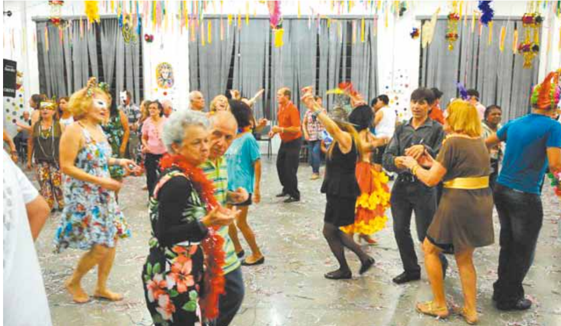
Festa para todos - Centenária, Banda Lira vai animar bailes no Adamastor Centro e também no Bosque Maia