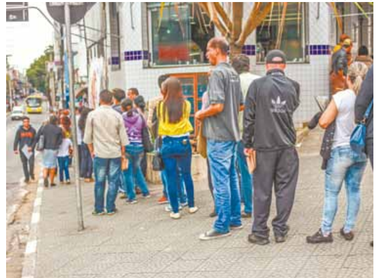
Na luta - Fila em agência de emprego na quarta, 20, tinha mais de 100 m

Em junho, o fundador da Azul, David Neeleman, venceu o processo de privatização da portuguesa TAP.