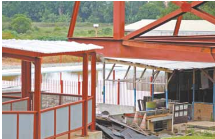
Acúmulo - Chuvas dos últimos dias deixou fosso da piscina cheio d'água

“Minha mulher está grávida e eu tenho medo dos riscos que ela e meu filho correm morando perto de um lu-