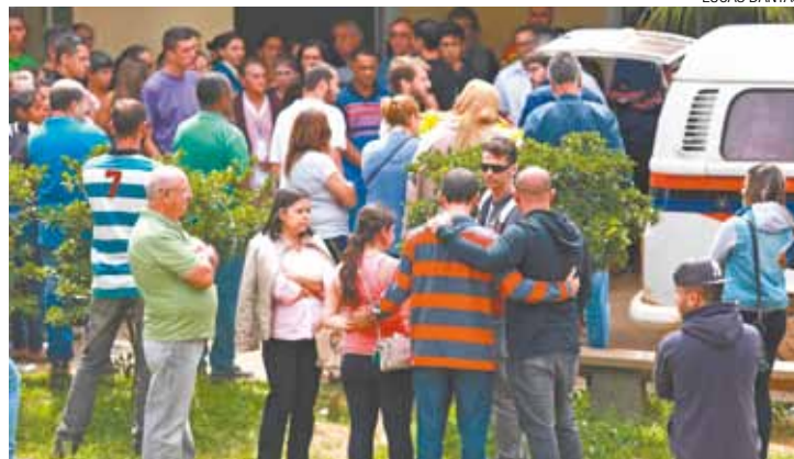
Enterro - Cerca de cem pessoas compuseram o cortejo no Vila Rio