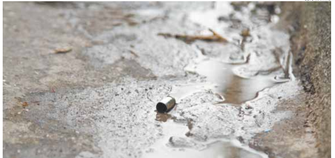
Crime - Projétil de pistola 380, deflagrado em latrocínio no dia 20 de janeiro, na Vila Galvão, encontrado na sarjeta

Furtos em geral fecham os números positivos da SSP. Foram 10.331 casos em 2014, e outros 9.625 no ano seguinte, uma queda de 6,8%.