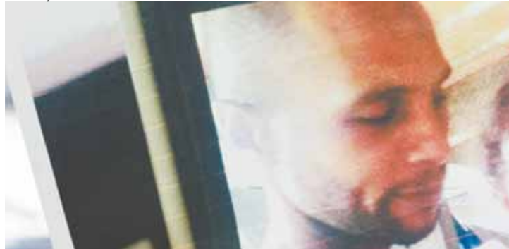
Foragido - Polícia investiga paradeiro de suspeito de assassinato (acima)