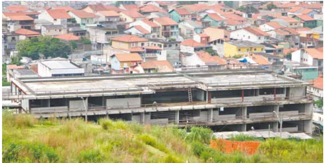
Esqueleto - Atividades estão paradas desde agosto do ano passado; estrutura permanece abandonada

Terreno está tomado por mato alto; insetos são cada vez mais comuns no entorno