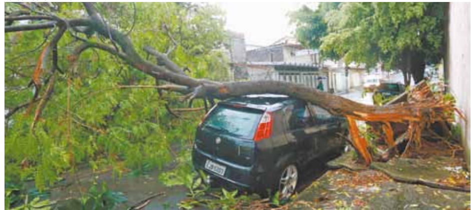
Queda - Árvore desaba em cima de carro estacionado no Gopoúva, assustando moradores; motorista saiu sem ferimentos