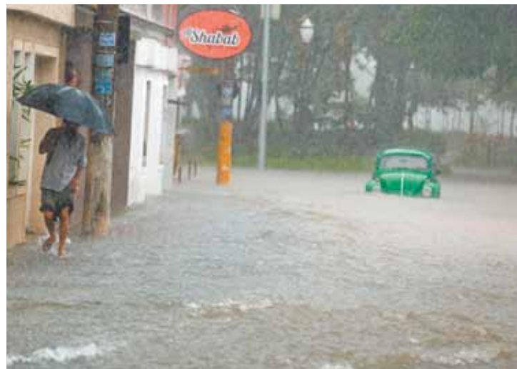
Ilhado - Motorista tenta atravessar alagamento, porém sem sucesso

Piscinão inacabado poderia ajudar na Vila Galvão