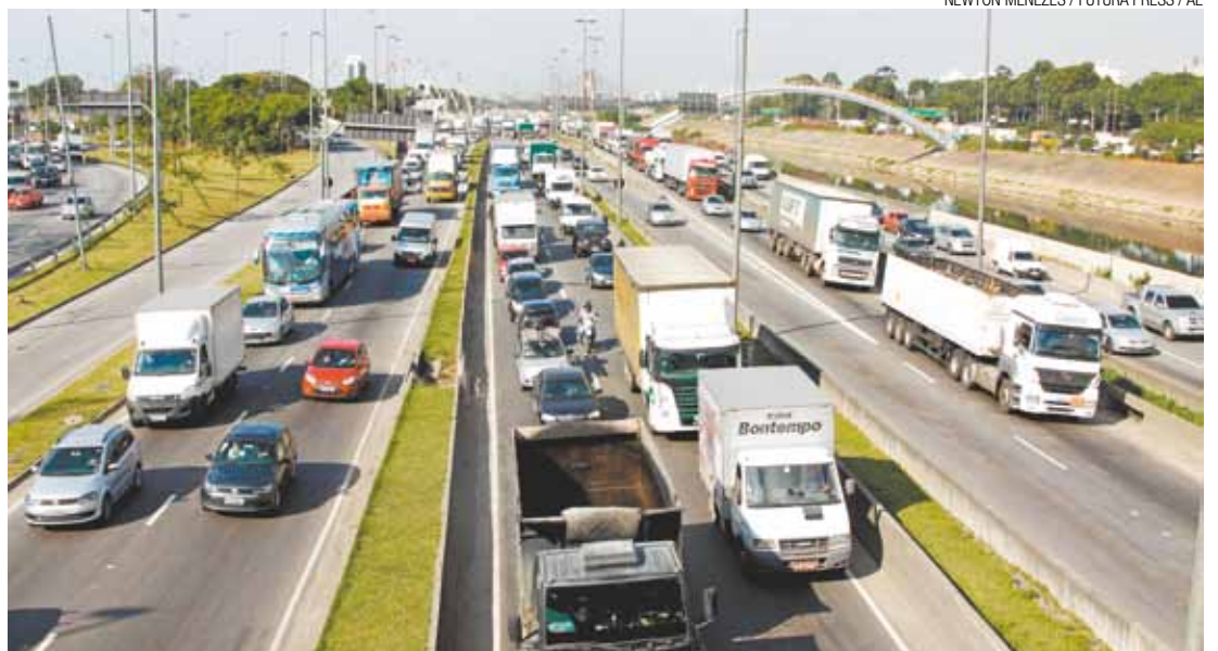
Suspeita - Obra investigada foi tocada na gestão do ex-prefeito Gilberto Kassab e do ex-governador José Serra

De acordo com a investigação do Gedec, feita após o recebimento do relatório, o Consórcio Nova Tietê, formado pelas empresas Delta Construções e Sobrenco Engenharia, venceu a licitação para a ampliação do lote 2 da Marginal do Tietê, pelo valor de R$ 287,2 milhões. A concorrência foi realizada por meio de um convênio entre a Prefeitura e o Governo do Estado, e previa a empreitada por preço global, que é caracterizada pela fixação antecipada do custo da obra em sua totalidade, excluindo-se apenas, excepcionalmente, o pagamento para obras e/ou serviços extraordinários, não constantes do projeto ou das planilhas em que