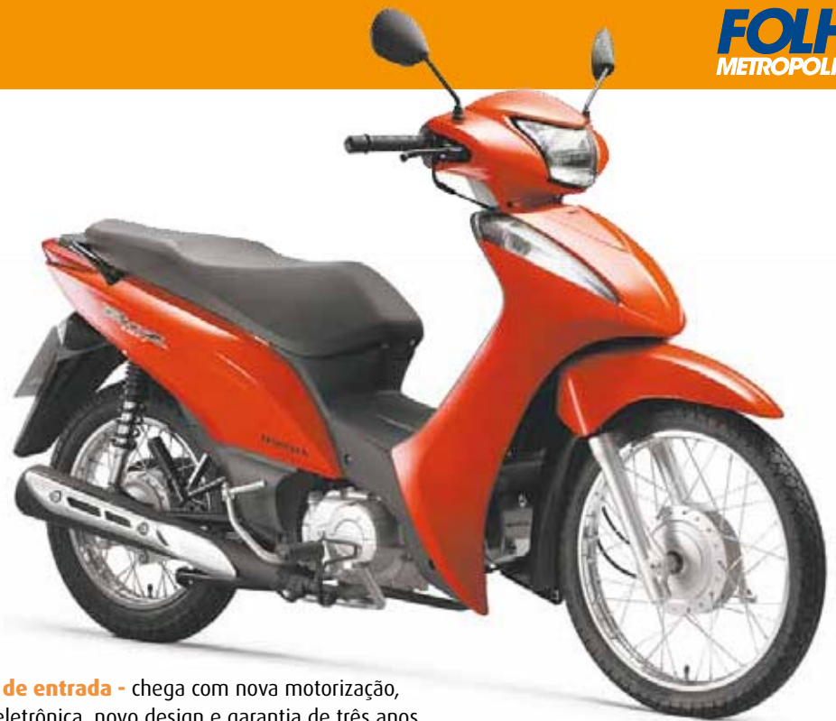
Modelo de entrada - chega com nova motorização, injeção eletrônica, novo design e garantia de três anos

A Honda Biz 110i modelo 2016 se diferencia por inovações como o painel de instrumentos, que é exclusivo da versão com destaque para o hodômetro e marcador de nível de combustível. Sob o assento está o compartimento exclusivo, agora com maior espaço para armazenar objetos pessoais, como bolsas e capacete. Características como a facilidade de pilotagem e conforto permitem ao usuário um posicionamento mais cômodo e menos cansativo. Outro diferencial de destaque é a sua praticidade, sobretudo com a transmissão semi automática e rotativa de quatro marchas, que não necessita do acionamento da embreagem.