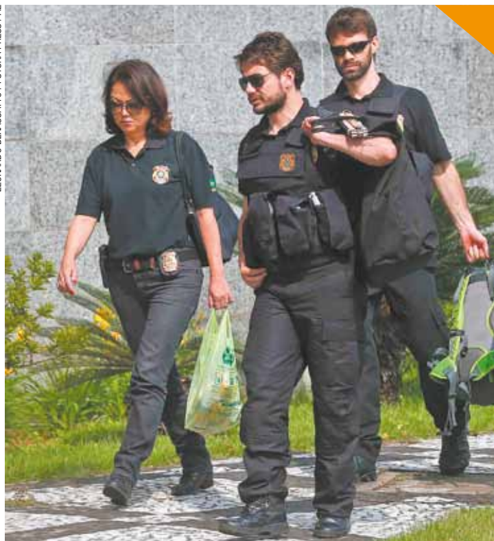
Triplo X - Ponto de partida da apuração da PF é o imóvel no Guarujá