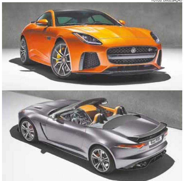
F-Type SVR - Modelo estará disponível no mercado brasileiro ainda em 2016

"O resultado é um modelo capaz de alcançar 321 km/h de velocidade máxima, um supercarro que também pode ser um veículo utilizado no dia a dia. Nós também desenvolvemos uma versão conversível do modelo, para que os entusiastas da marca consigam ouvir todo o som que sai pelo seu novo sistema de exaustão de titânio", complementou o executivo.