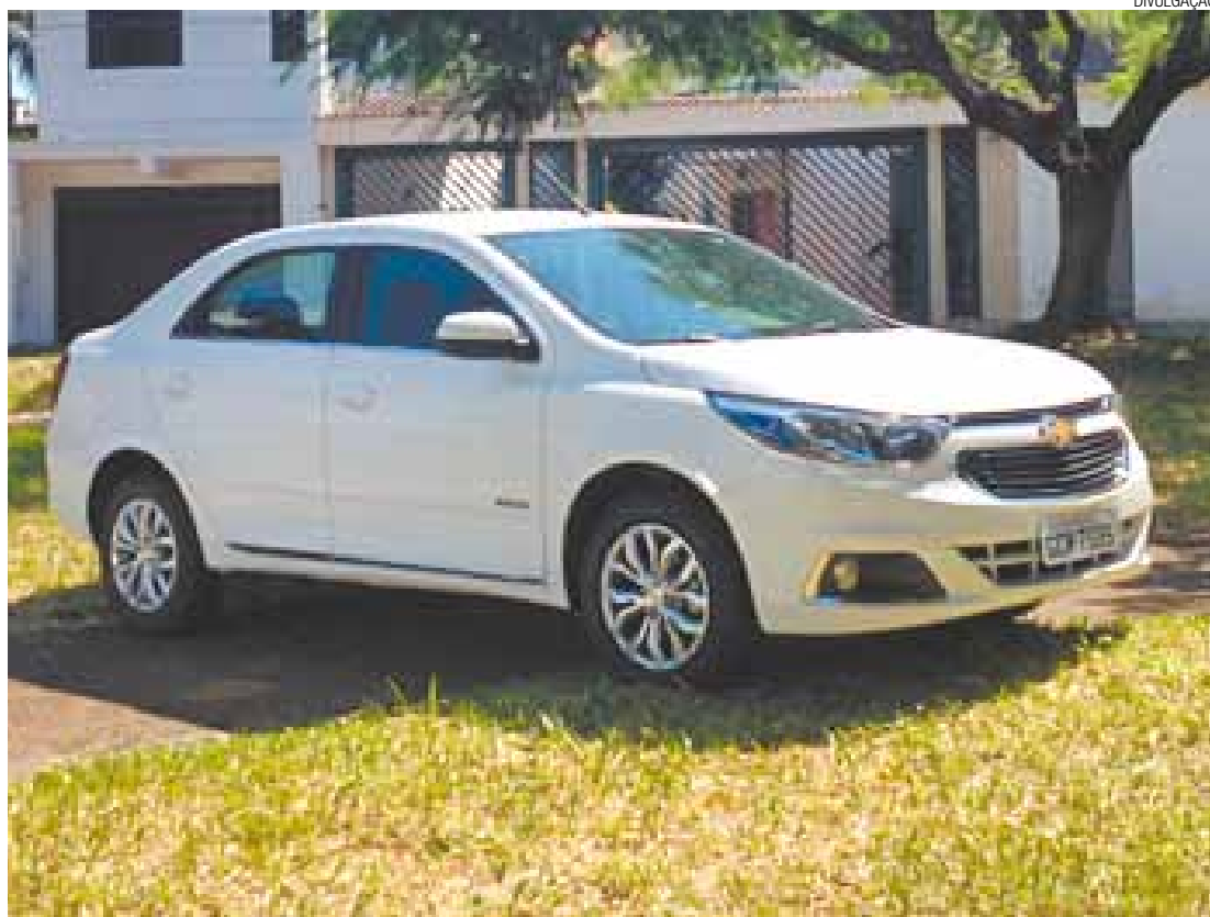
Mais bonito - Apesar do ótimo espaço interno, modelo lançado em 2011 não era visualmente agradável

A carroceria foi praticamente toda redesenhada e traz agora linhas mais expressivas e dinâmicas, em sintonia com a nova linguagem global de design da marca - inaugurada recentemente nos EUA pelo Malibu.