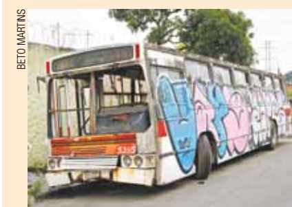
Ônibus largado no Jd. Ottawa