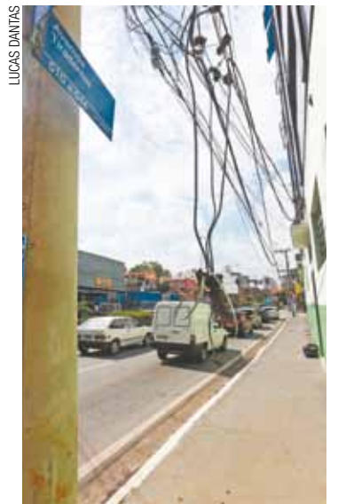
Perigo - Emaranhado de fios está na altura da cabeça das pessoas

Comerciantes dizem que a EDP Bandeirante chegou a