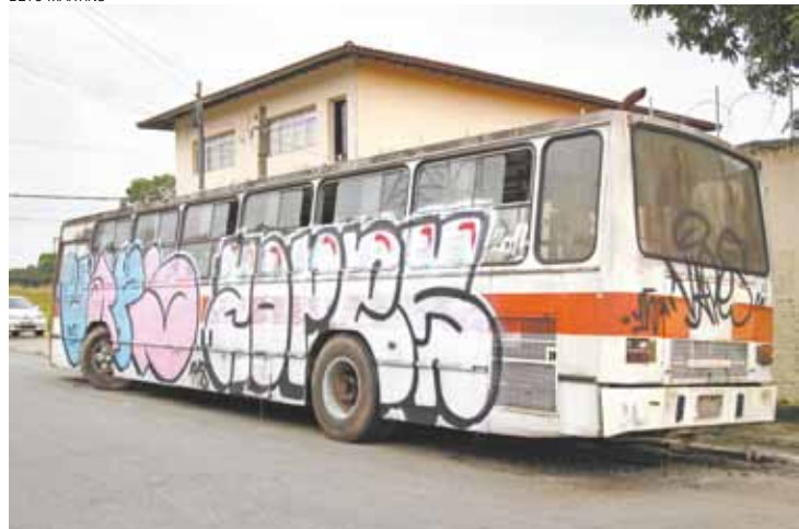
Vandalismo - Pichadores e grafiteiros fizeram pinturas no veículo

local de reprodução do mosquito da dengue. "Há mais de quatro meses o ônibus está abandonado", disse.