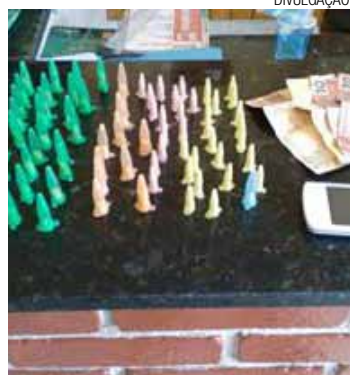
Drogas - Apreensão aconteceu por volta das 14h, no Jardim Eldorado

Durante vistoria no matagal, os policiais acharam a sacola, que continha 34 porções de cocaína e 49 pedras de crack. Os entorpecentes foram apreendidos e serão periciados pelo Instituto de