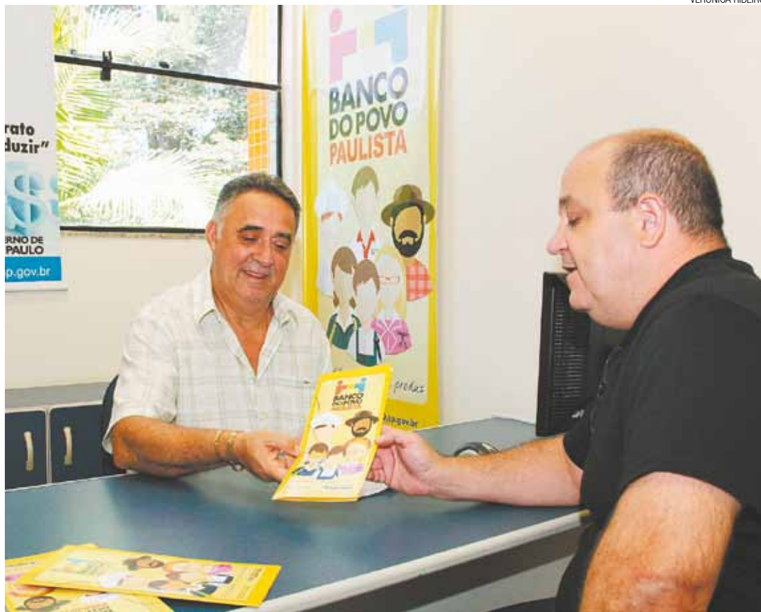
Específica - Secretaria de Indústria, Comércio, Ciência e Tecnologia oferece linha de crédito para ovos de Páscoa

Empréstimo pode ser adquirido junto ao Banco do Povo