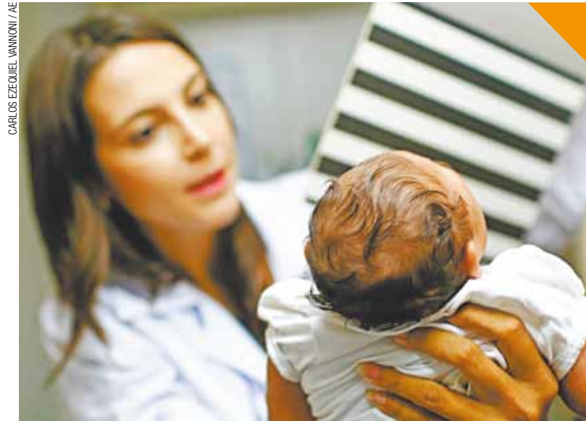
CARLOS EZEQUIEL VANNONI / AÉ

Cientistas já comprovaram que o zika vírus pode ultrapassar a placenta