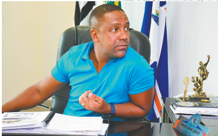
Limpeza - Contrato assinado pelo presidente Jesus é válido por dois anos

(07/01/16)