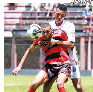
Marcação - Comercial foi melhor durante todo o segundo tempo

O último duelo entre os times, antes do jogo de ontem, foi em 2009, quando o Corvo ganhou por 2 a 0.