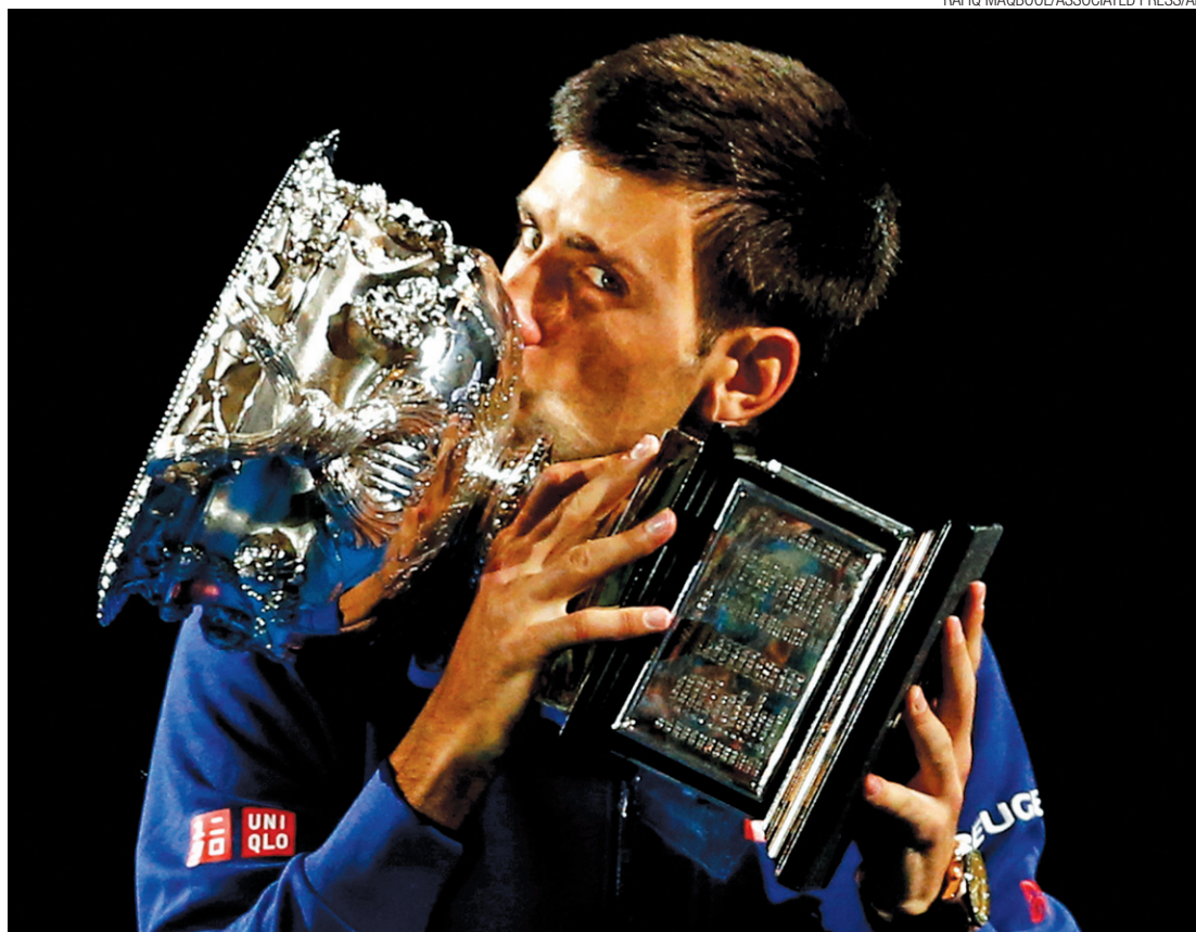
Mito - Djokovic iguala recorde de Roy Emerson e alcança incrível marca de apenas uma derrota nos últimos 34 jogos

Já são 11 títulos de Grand Slam para o líder do ranking. Djokovic ainda alcançou a incrível marca de apenas uma derrota nos últimos 34 jogos. Ele também ampliou sua hegemonia perante Murray, já que venceu 22 de seus 31 confrontos diante do rival britânico.