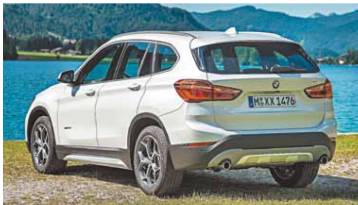
Exclusivo - Marca conta com uma série de acessórios para personalização