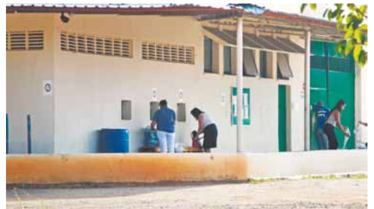
Triagem - Visitantes dos presos entregam pertences para passar por revista

No local há 141% presos além da capacidade