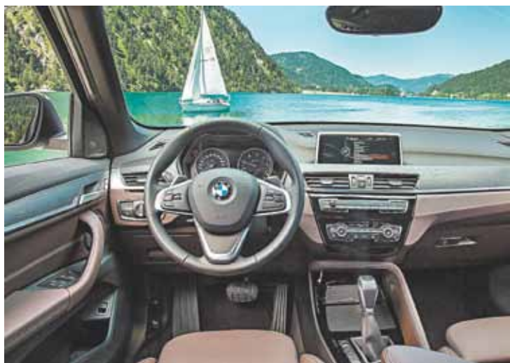
Tecnologia - Sistema BMW ConnectedDrive com serviço de concierge

uma aceleração de 0 a 100 km/h em apenas 6,5 segundos. E, além da segurança em quaisquer situações, a tecnologia xDrive propicia máxima liberdade e versatilidade na condução. O X1 sDrive20i, por sua vez, passa a vir com tração dianteira, o que garante redução de peso, mais eficiência em termos de consumo, além de mais espaço interno na cabine. O novo BMW X1 é comercializado nas concessionárias autorizadas com preços sugeridos de R$ 166.950, R$ 179.950 e R$ 199.950, para as versões sDrive20i GP, sDrive20i X-Line e xDrive25i Sport, respectivamente.