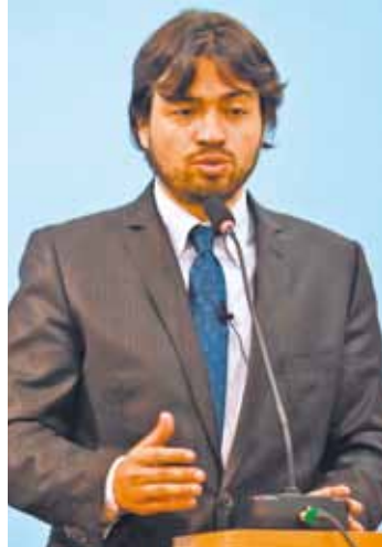
Estudos - Vereador quer cobrar governo no combate às enchentes

Câmara implantou duas Comissões de Estudos este ano