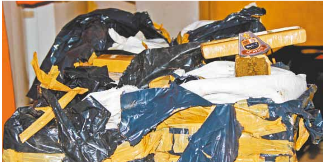
Casa caiu - Maconha apreendida ontem nos Pimentas estava estocada na sala da residência dos suspeitos

O bebê, filho da suspeita presa em flagrante, foi deixado com familiares