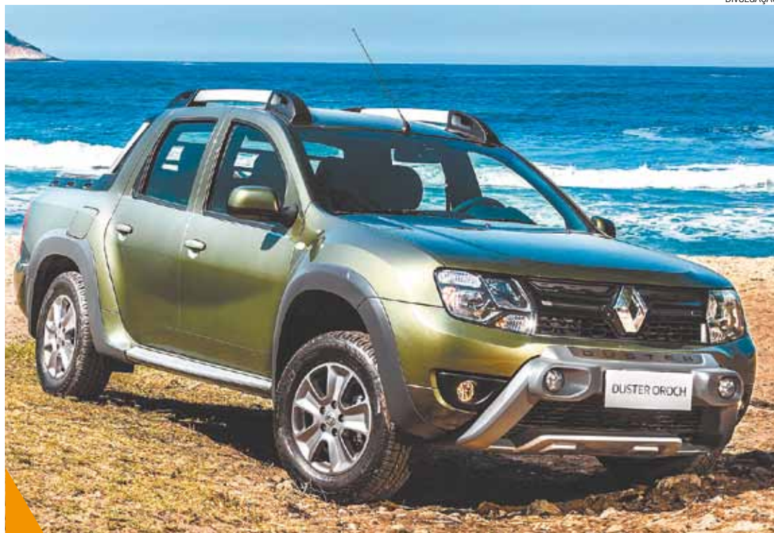
Potente - Versão com motor 2.0 vai bem na cidade e na estrada. A 6ª marcha parece até automática

A Oroch Dynamique 2.0 custa R$ 73,5 mil. Com motor 1.6 e câmbio de 5 marchas sai por R$ 69,3 mil. A versão de entrada, Expression 1.6, tem o preço a partir dos R$ 64 mil.