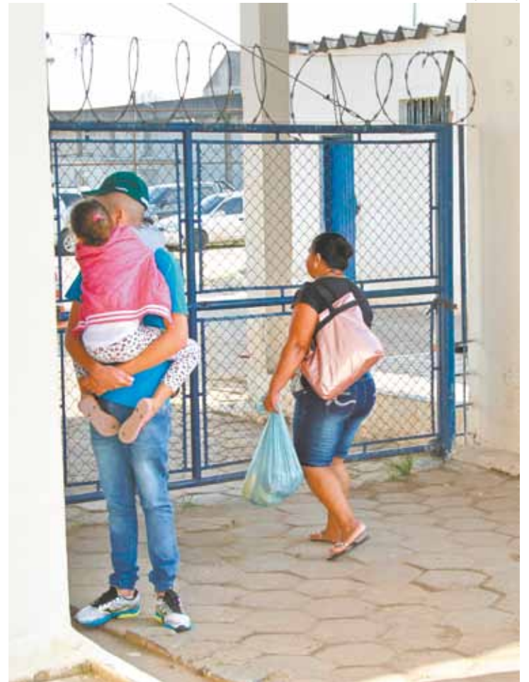
Rotina - Mulher leva 'jumbo' para parentes do Pavilhão Dois