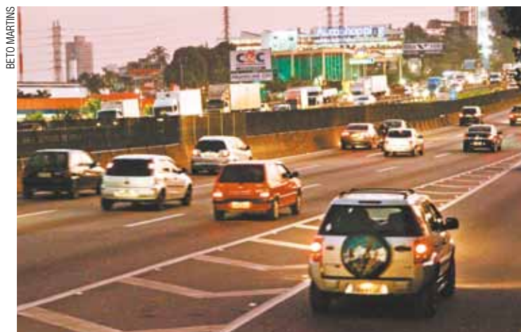
Carnaval - NovaDutra estima que 320 mil veículos devam deixar São Paulo

A NovaDutra estima que cerca de 320 mil veículos deva deixar São Paulo entre hoje e amanhã. Durante o feriado, as estradas serão inspecionadas por viaturas e profissionais para auxiliar os usuários.