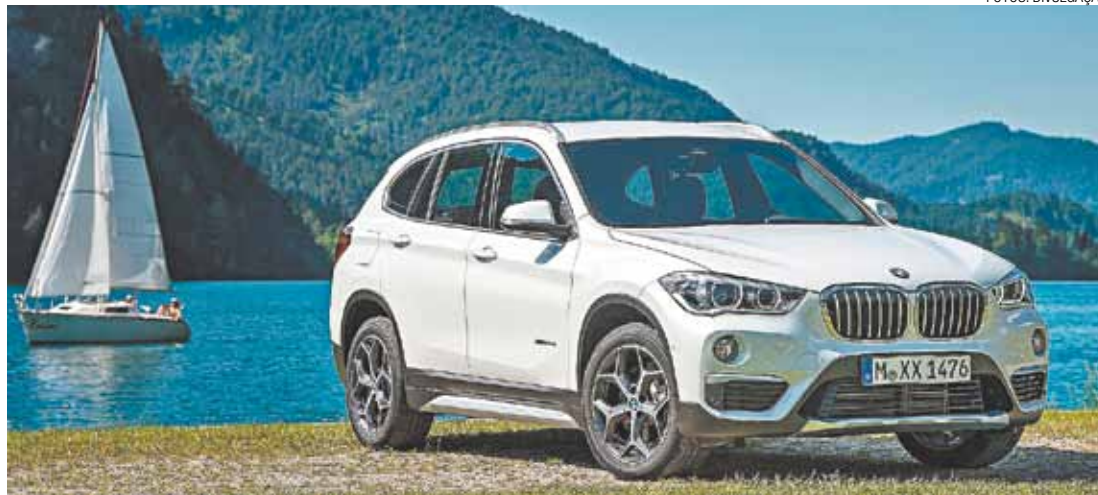
Segurança - De série com seis airbags, controles de estabilidade e tração e faróis com tecnologia full-LED

rior. Como consequência, a vida a bordo ficou ainda mais agradável. A posição de dirigir, por exemplo, cresceu 40 mm, garantindo maior visibilidade ao motorista. O espaço para quem viaja atrás também foi ampliado e, agora, o vão entre as pernas e o encosto dos bancos dianteiros conta com 74 mm a mais de distância. O porta-malas seguiu esta mesma tendência e passa a dispor de 505 litros de capacidade, podendo alcançar 1.505 l com os bancos traseiros rebatidos.