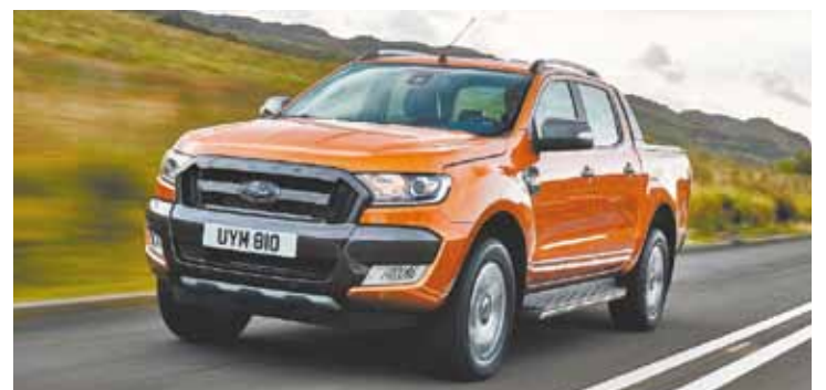
Mercado europeu - Picape teve um crescimento de 27% nas vendas

Conhecida por aliar capacidade para enfrentar todo-terreno, excelente dirigibilidade e conforto para os ocupantes, a Ford Ranger eleva ainda mais o padrão no novo modelo.