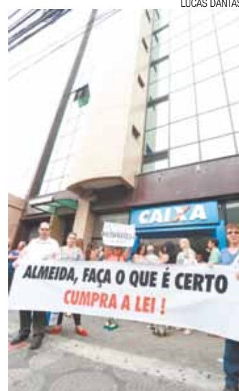
Inquérito - Se não ocorrer acordo, MPE pode instaurar ação civil pública

Todas as partes debateram o tema ontem em reunião no Ministério Público. O principal impasse é a quantidade de vagas. No concurso de acesso, o funcionário público faz uma prova e pode ser promovido a um cargo melhor e com maior remuneração. Os trabalhadores querem uma vaga por participante. A Prefeitura alega que precisa avaliar até mesmo a condição de uma vaga para cada dois candidatos, pois o aumento na folha de paga-