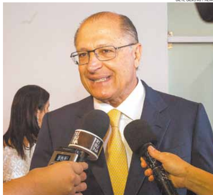
Investigação - Governador garantiu que políticos culpados serão punidos

‘Moita’ foi flagrado por grampos da polícia operando com a quadrilha da merenda de sua sala no Palácio dos Bandeirantes. Ele orientava um lobista a renegociar contratos.