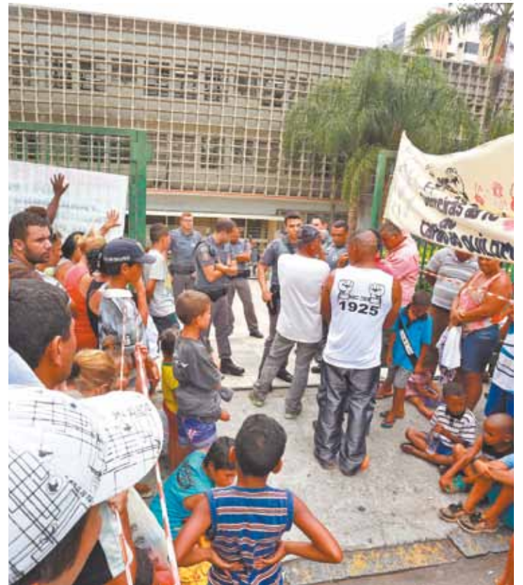
Protesto - Manifestantes reunidos em frente ao Fórum, no Centro