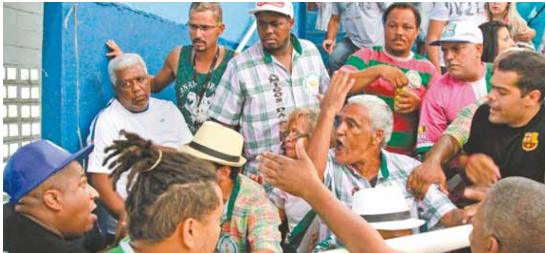
Bate-boca - Falhas de jurados na divulgação das notas das escolas gerou briga generalizada entre torcedores