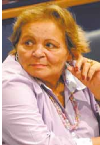
Inelegível - Condenação pode tirar ex-vereadora das eleições

Ex-vereadora tem cargo de confiança no atual governo