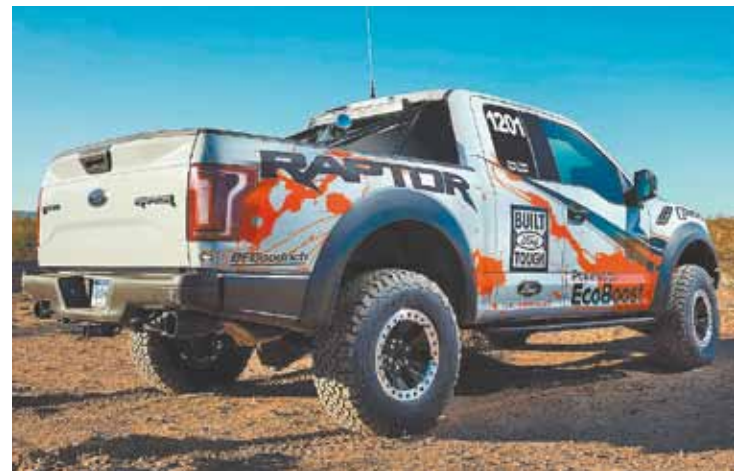
Competição - Picape reforça a tradição da marca no automobilismo esportivo