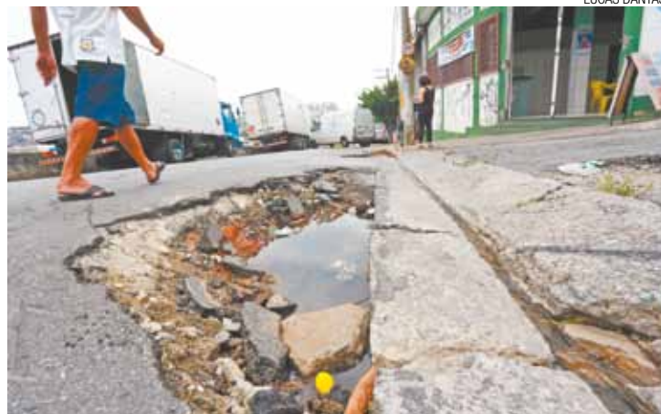
Obstáculos - Buracos são comuns na rua e estão acumulando água

A Proguaru informou que realizará vistoria.