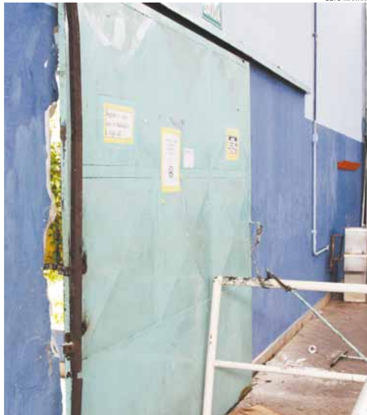
Rotina - Porta que dá acesso à piscina foi arrombada por vândalos

A Secretaria de Esportes informou que o prejuízo ainda não foi calculado, tendo em vista que os técnicos voltaram a trabalhar ontem. “Foi feito contato com a GCM para reforçar as rondas no entorno do Ginásio, visando coibir esse tipo de ação”, diz nota.