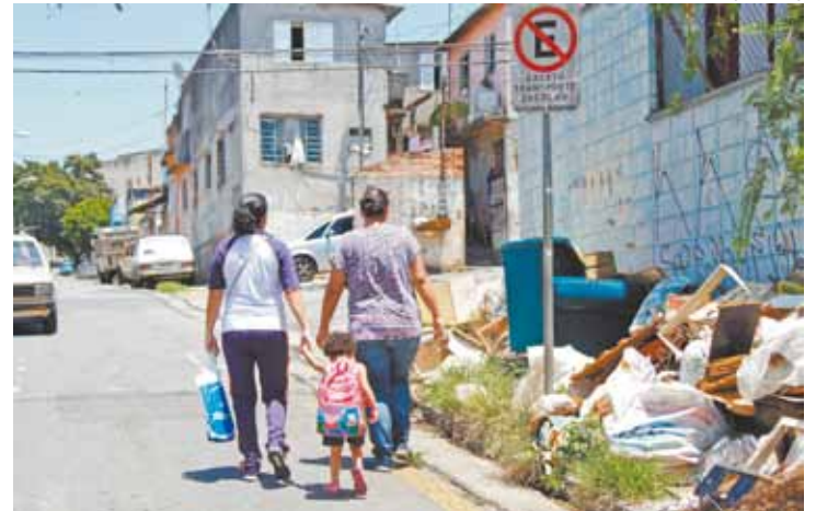
Sujeira - Descarte irregular de lixo é o maior problema na região

"A situação está muito feia. Eu nem consigo lembrar quando essa calçada esteve limpa. É horrível porque isso atrai insetos e ratos à escola. Quem