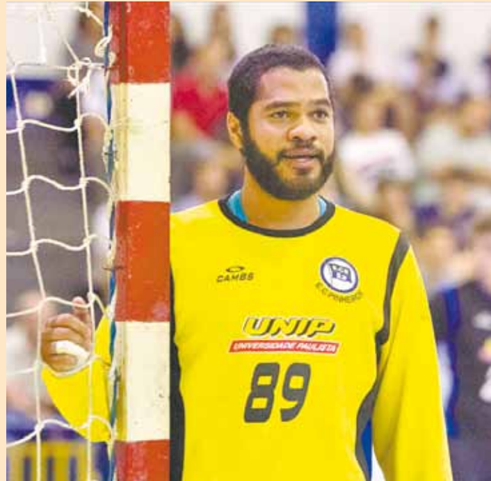
Prata da casa - Goleiro pretende defender a Seleção nas Olimpíadas

Eu tento não pensar (nas ofensas). Até já tive outro jogo depois e jogamos bem. Infelizmente existem pessoas assim no mundo inteiro, e como trabalho e trabalhei com duas excelentes psicólogas na minha carreira, aprendi