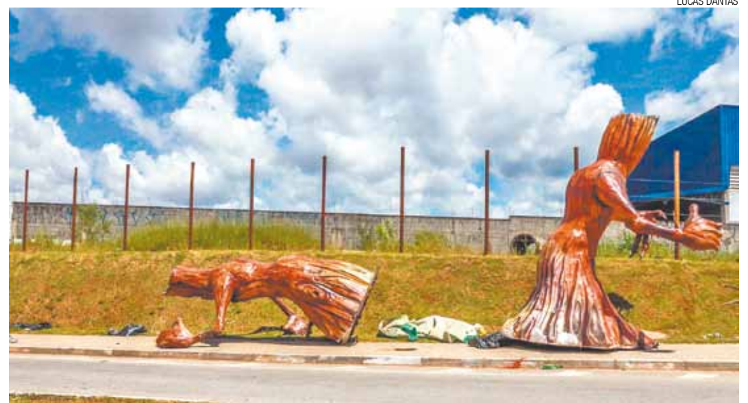
Efêmero - Hoje, primeira segunda-feira depois do Carnaval, inspira deixar a fantasia e voltar à realidade