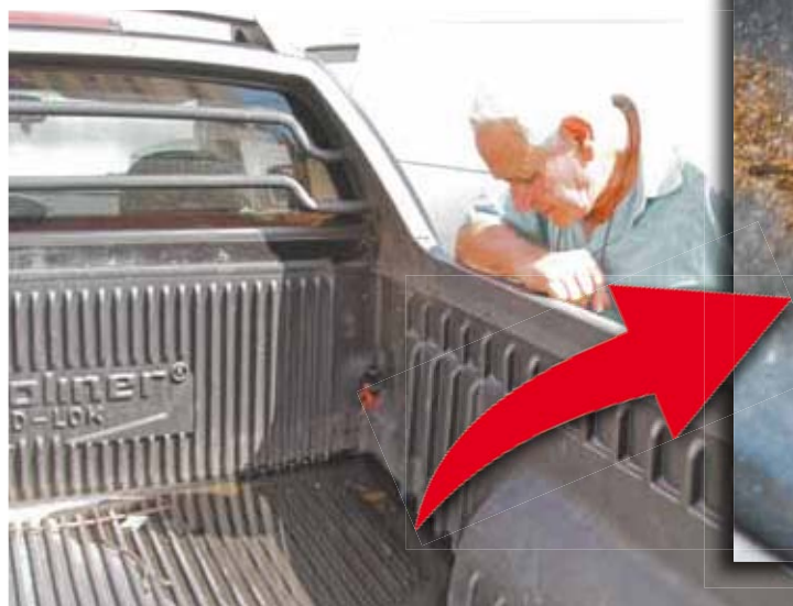
Receio - Idoso observa larvas nadando em água acumulada

A Secretaria Municipal de Saúde afirmou que, após autorização da polícia, enviará agentes ao local. “Os agentes de saúde farão vistoria nos veículos, bem como no entorno do local indicado”, diz nota.