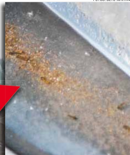
Espera - Prefeitura irá ao local após autorização da polícia

Outros dois veículos acumulam possíveis focos de reprodução para o mosquito aedes aegypti