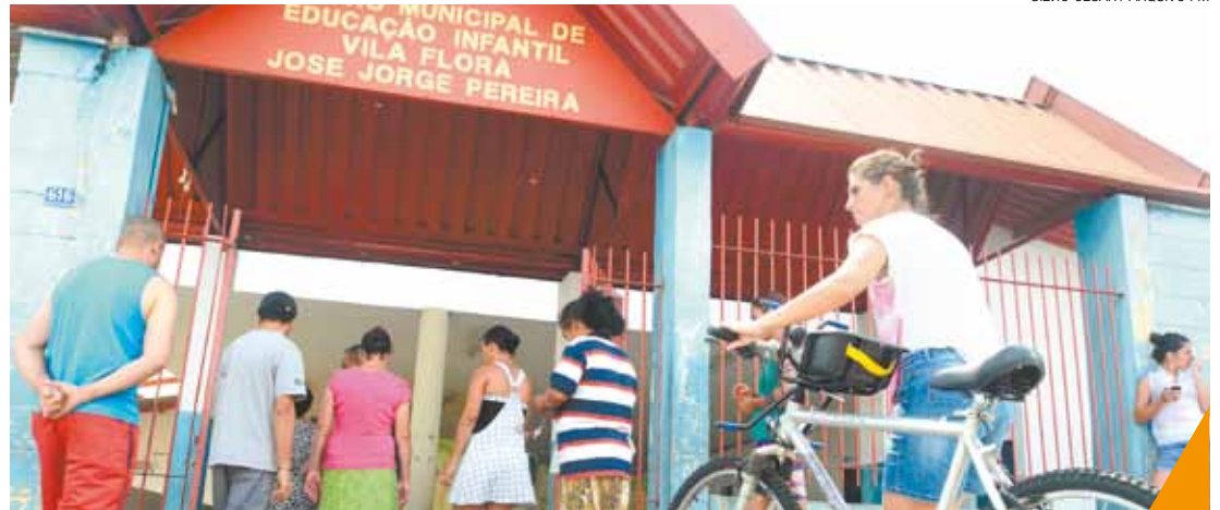
“Negligente” - Segundo MPE, Prefeitura deixou alunos em área de risco por quase dois anos inteiros

Morte de criança pode estar relacionada com área contaminada