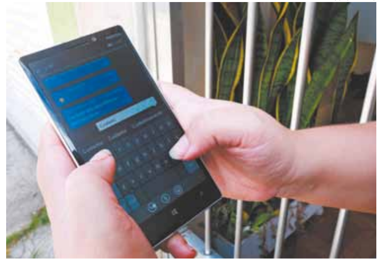
Conectados - Mensagens são enviadas por um grupo criado no WhatsApp

A 2ª Cia do 15º Batalhão da Polícia Militar conversou com os moradores e estuda montar um esquema para realizar rondas na via. De acordo com a Secretaria de Segurança Pública, oito pessoas foram presas por roubo e furto na região e um Boletim de Ocorrência foi registrado esse ano. A secretaria ressaltou que o policiamento na área será intensificado.