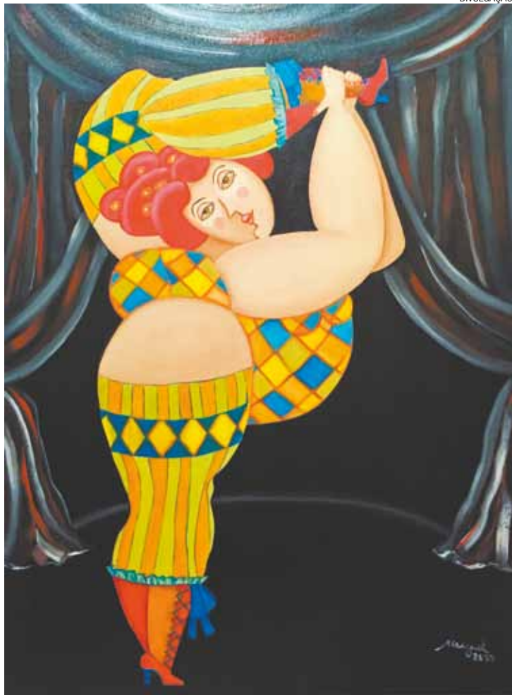
Tela - “A Contorcionista” é uma das obras inspiradas na arte circense