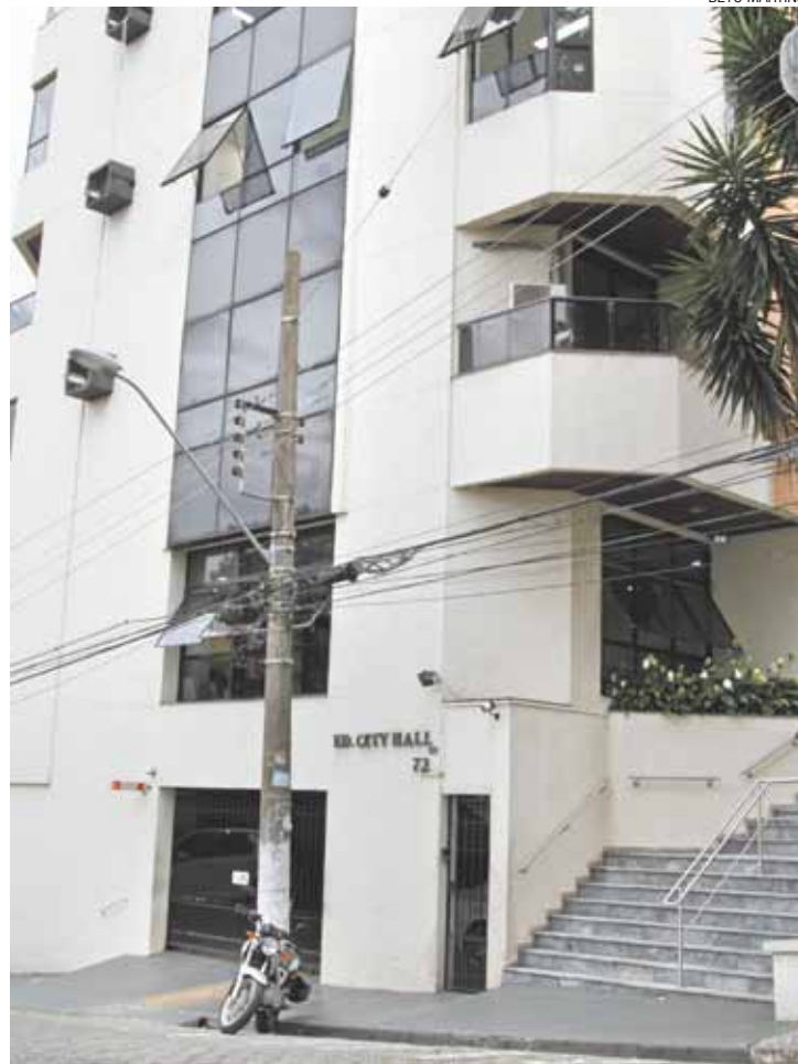
Improvisto - Agência reguladora funciona em duas salas alugadas no Centro

Segundo o Portal de Transparência da Agru, a entidade conta com cinco funcionários, todos com salários superiores a R$ 10 mil e com carga horária de 40 horas por semana.