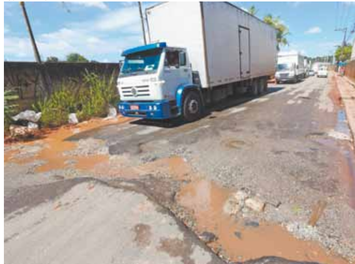
Trafégo - Circulação de veículos é prejudicada; motoristas reclamam