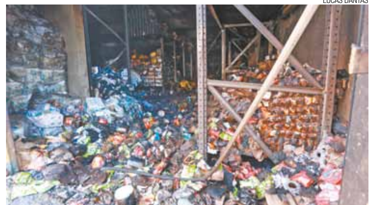
Produtos - Estabelecimento perdeu diversas mercadorias no incidente

Segundo um ex-funcionário, o incêndio começou após o calor das lâmpadas aquecer os rolos de papel higiênico em-