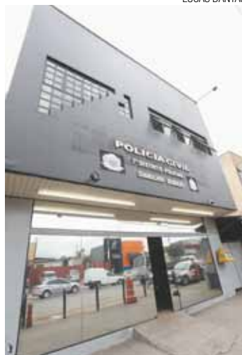
Locações - SSP municipal gastou, em 2015, pouco mais de R$ 1 mi

Dos nove DPs somente o 1º DP pertence ao Estado