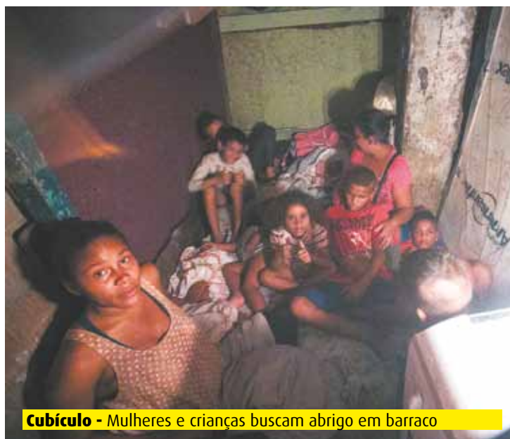
Cubículo - Mulheres e crianças buscam abrigo em barraco