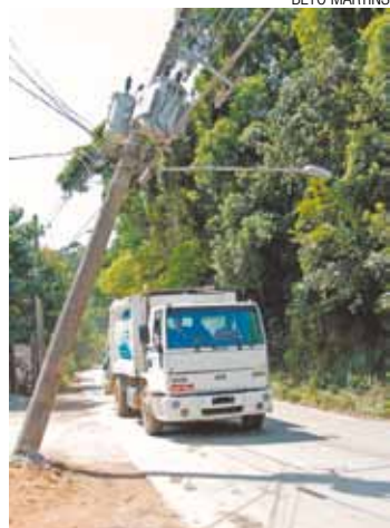
Medo - Colisão fez poste se deslocar do chão; fios 'sustentam' estrutura

Segundo a moradora, a EDP Bandeirante esteve no local e garantiu que não havia risco de queda. A energia elétrica do bairro não