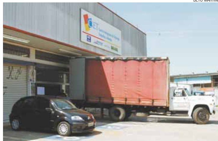
Realocado - Caminhão de mudança da Prefeitura é carregado com móveis

Não há previsão para reabertura da nova unidade