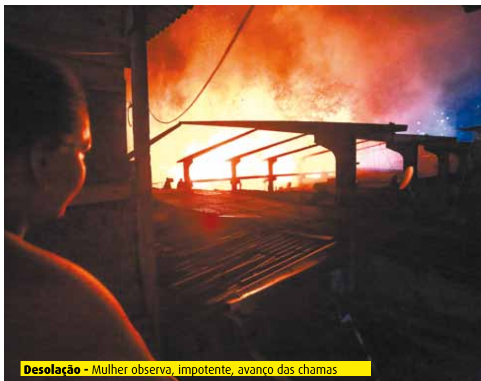
Desolação - Mulher observa, impotente, avanço das chamas