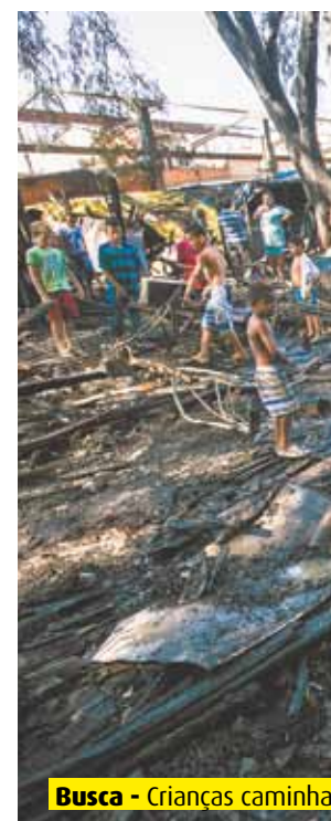
Busca - Crianças caminha