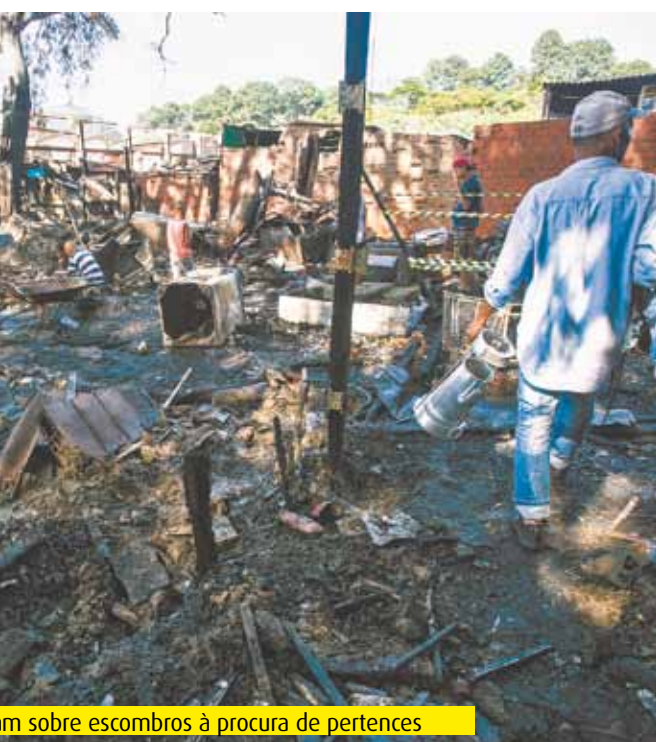
Um sobre escombros à procura de pertences