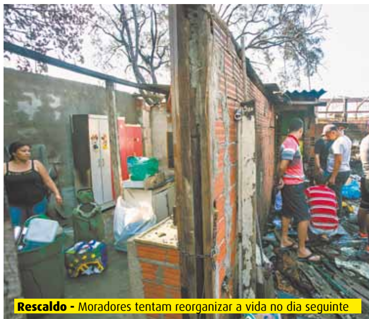
Rescaldo - Moradores tentam reorganizar a vida no dia seguinte