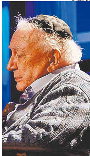
Ator - Mamberti na pele do Sr. Green, um velho e solitário judeu

No velho apartamento do Sr. Green, lotado de coisas que parecem ter sido adquiridas nos anos 1950 e mantidas intocáveis desde então, a circunstância legal que uniu os dois personagens, os envolve em situações inusitadas, com traços de humor e profunda emoção.