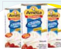
Chantilly Amelia 1L