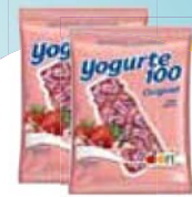
Bala Dori Yog100 600g