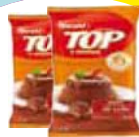
Harald Gotas leite 1,05kg