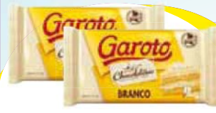
Garoto Branco 2,1kg