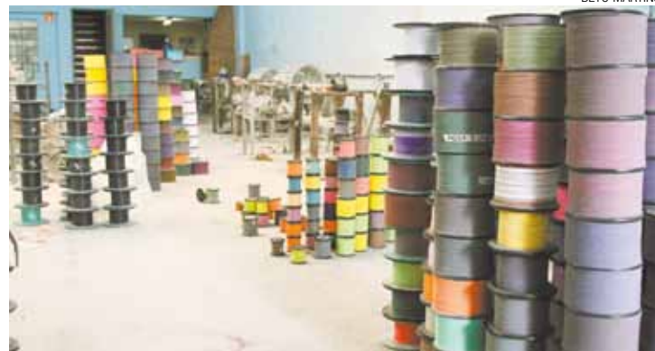
Perigo - Produto pode provocar sérios ferimentos em motociclistas