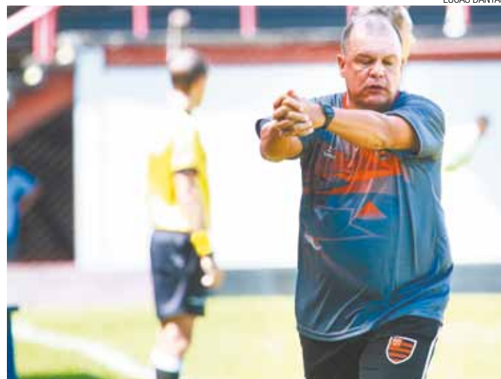
Queixas - Técnico critica sequência de jogos de quarta e domingo