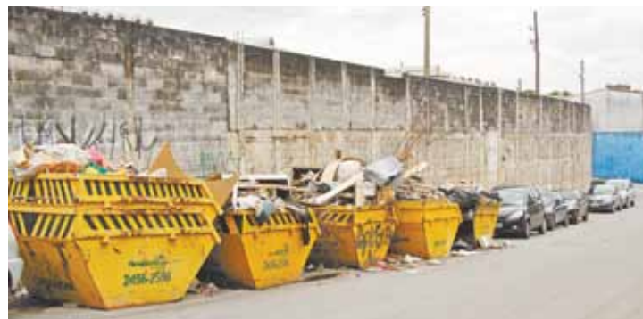
Rua da Imprensa - Caçambas cheias ocupam vagas de estacionamento