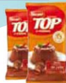
Harald Gotas leite 2,1kg