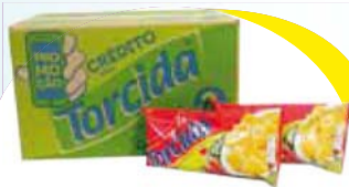
Salg Torcida 80g