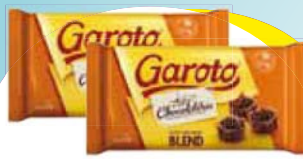
Garoto Blend 2,1kg