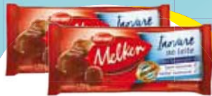
Harald Melken Inov leite 1kg