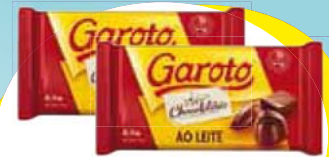
Garoto Leite 2,1kg