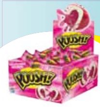
Chicle Poosh dp