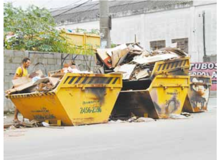
Nova Cumbica - Sujeira já tomou conta da via e de parte da calçada

Problema começou há cerca de 30 dias e atrapalha a circulação de veículos, além de atrair mais sujeira