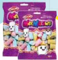
Maxmallow Docile 250g