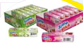
Simo Stick dp12un