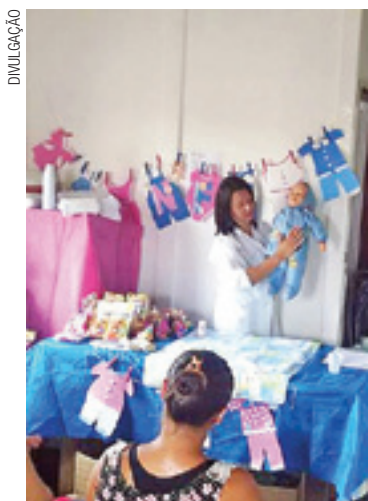
Presente - Participantes de cinco encontros recebem um enxoval

Vale lembrar que qualquer gestante atendida pela rede pública pode participar do projeto "Nascer Feliz", que além de oficinas promove palestras, orientações e dicas de cuidados durante a gravidez e após o nascimento do bebê,