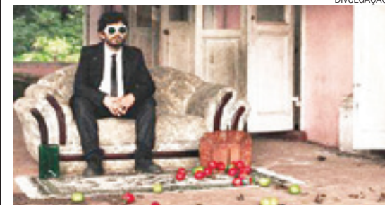
Politizado - Disco fala de país com problemas sérios