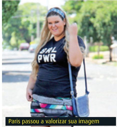
Paris passou a valorizar sua imagem