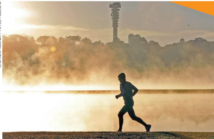
Exercícios físicos - Evitar sedentarismo reduz os sintomas do Alzheimer

Em 2013, houve duas propostas de emenda no Senado com o intuito de mudar este cenário. A primeira propõe a proibição de publicidade infantil com alimentos de baixo valor nutricional; a segunda visa a proibição e venda de refrigerante a menores de 18 anos. As propostas falam da prevenção do ganho de peso. “Meu neto é muito influenciável e ele sabe que esses alimentos são gostosos”, disse uma avó.