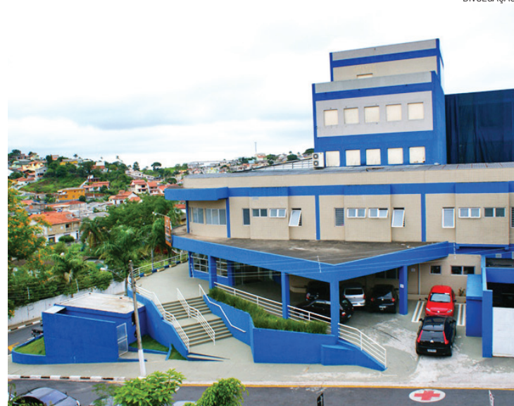
Santa Casa - Em Arujá, vai operar normalmente nos dias de feriado