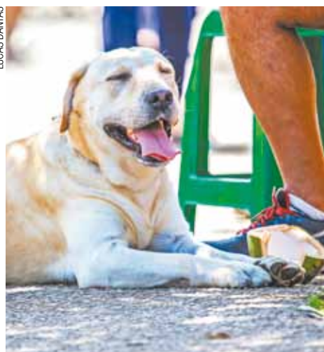
Zelo - Animais precisam de atenção no verão