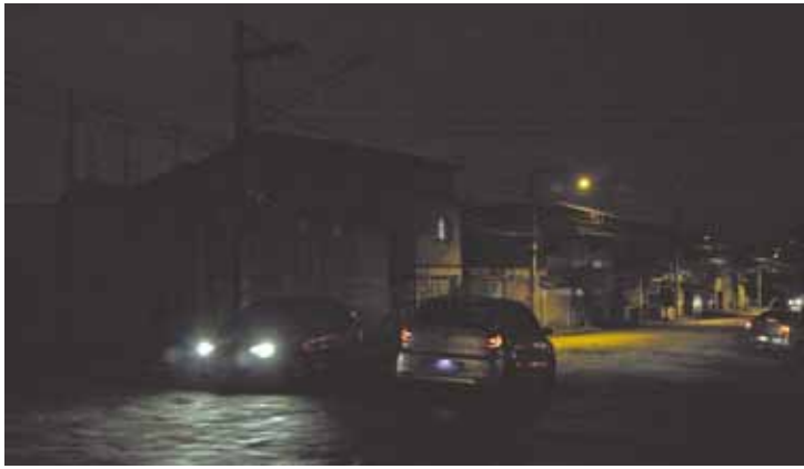
Breu total - Rua às escuras no Jardim Rosa de França (Região Centro)