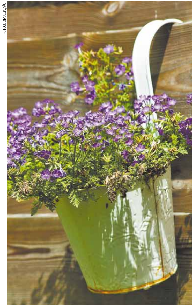
Parede - Vasos suspensos são boas opção de decoração criativa