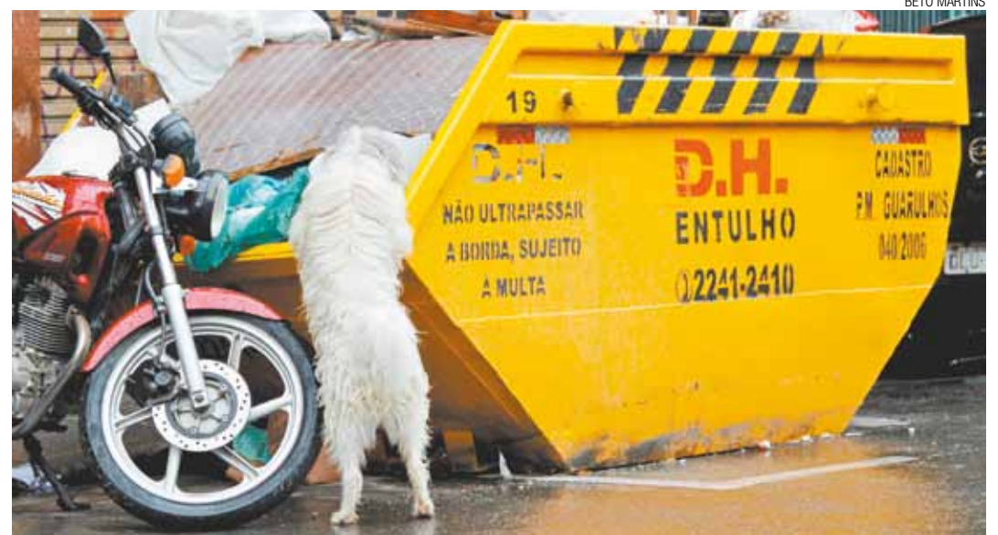
Crise? - A situação está tão complicada que em vez de revirar lixo cachorro apela para caçamba de entulho