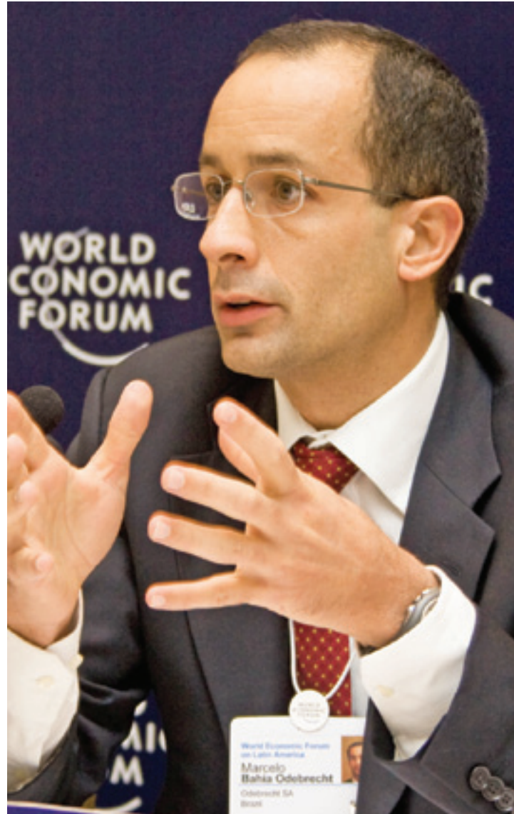
Na cadeia - Marcelo Odebrecht já está negociando a delação premiada

CICERO RODRIGUES / WORLD ECONOMIC FORUM / ARQUIVO 15/04/2009