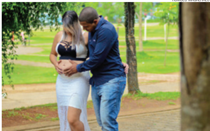
Dicas - Planejamento entre casal é importante para a formação do bebê