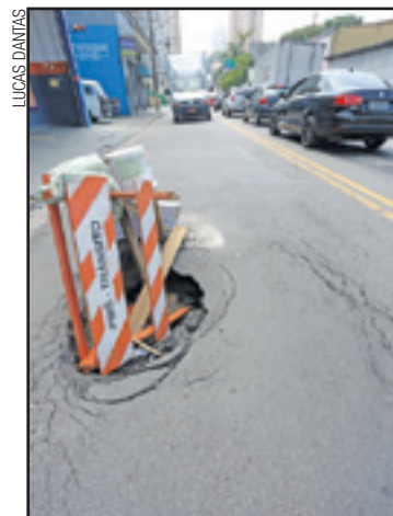
Cavalete - Objeto deixado pela Prefeitura foi colocado no buraco