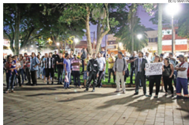
Manifestação - Cerca de 150 trabalhadores participaram do ato na praça

lho”, afirmou. “Sempre que o governo tem problemas, ele joga na conta dos servidores. Isso não é justo”, completou.