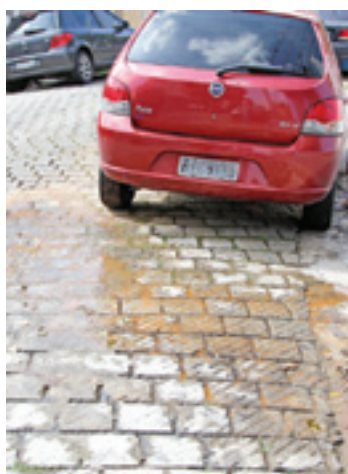
Conserto - Saae informou que manutenção está na programação