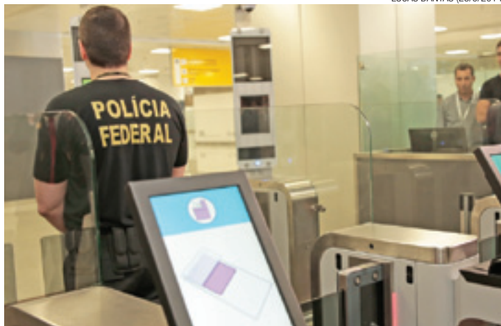
Acesso - Dados do MRE estavam restritos a agentes da PF desde 2012

Atualmente, além de terceirizada, a verificação é feita de forma manual. A previsão era de que um novo sistema fosse