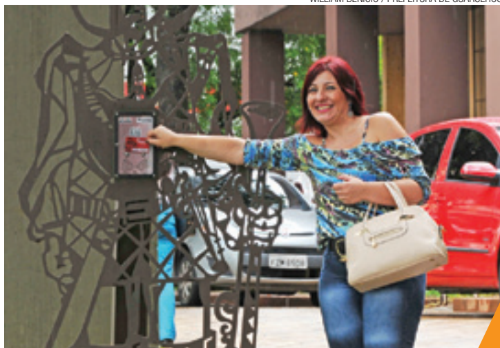
Era digital - Cartão servirá como identificação para obter descontos

O cartão servirá como identificação para que o turista receba descontos em pousadas e restaurantes. Ele contém um chip que registrará a passagem do peregrino pelos pontos da rota onde estarão pórticos eletrônicos de metal em formato do bandeirante Fernão Dias. Esses regis-