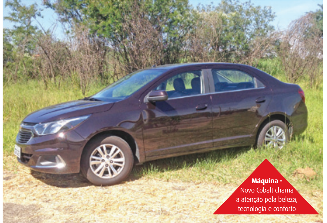
Máquina - Novo Cobalt chama a atenção pela beleza, tecnologia e conforto