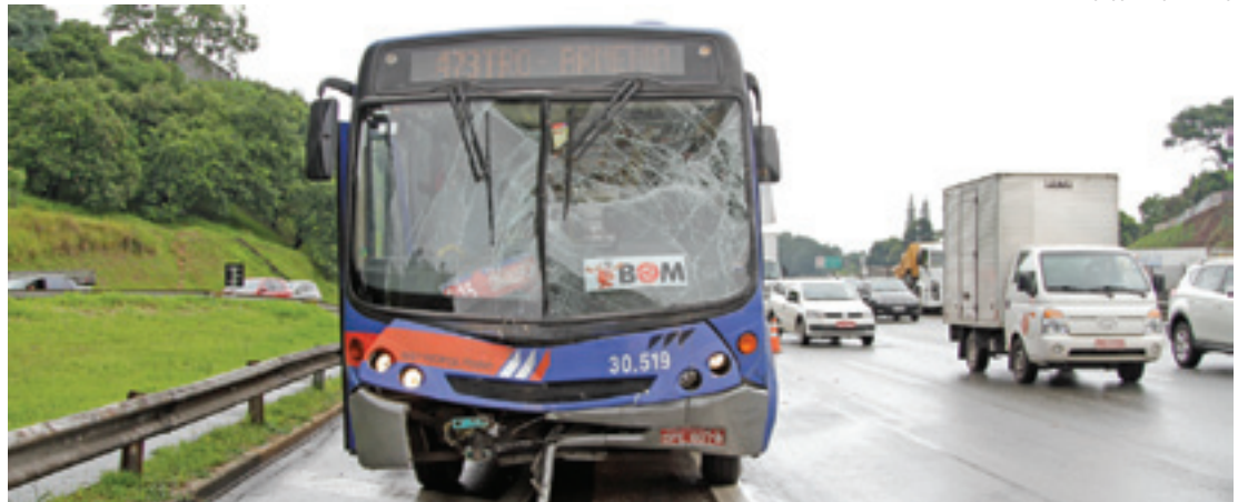
Destruição - Forte choque entre ônibus e van deixou quatro passageiros feridos; todas as vítimas estão bem

As quatro pessoas feridas, que estavam na van, foram resgatadas pelo Corpo de Bombeiros e encaminhadas ao hospital. Todas passam bem. O helicóptero Águia da Polícia Militar ajudou a fazer o resgate dos feridos.