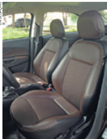
Atraente - Design interno agrada; modelo oferece boa dirigibilidade