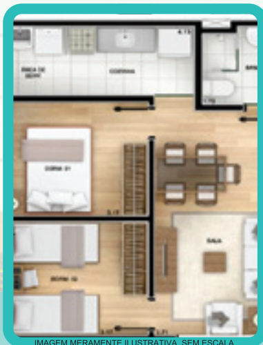
IMAGEM MERAMENTE ILUSTRATIVA, SEM ESCALA

LOCAL: ESTRADA DO ZIRCÔNIO, ALT. Nº 960 - JD. PRIMAVERA - GUARULHOS