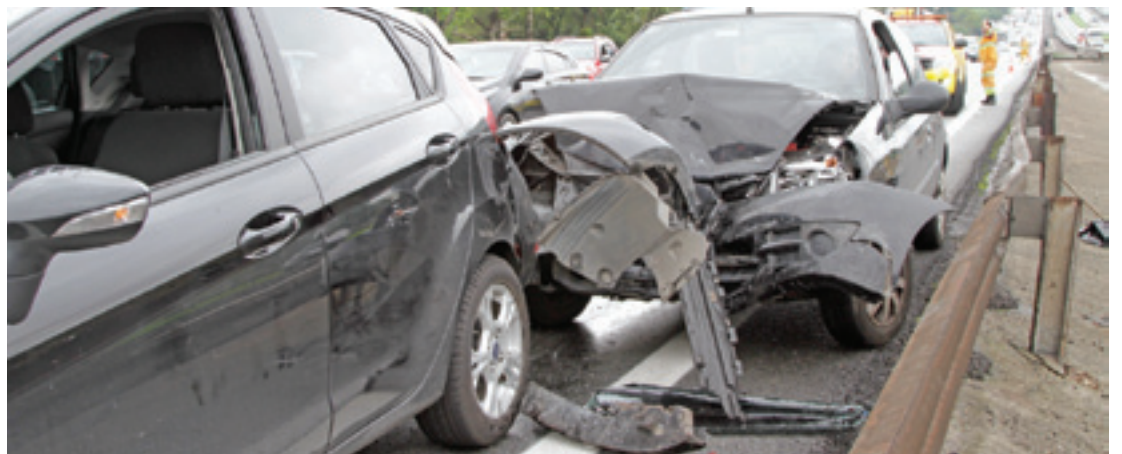
Susto - Minutos após a batida, Folha flagrou colisão no outro lado (sentido Rio). Mulher ferida também passa bem

Batida entre van e ônibus causou 7 quilômetros de congestionamento