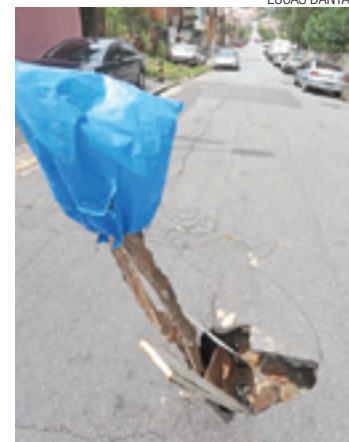
Alerta - Ao redor da abertura há rachaduras que preocupam

O buraco foi coberto com restos de madeira e galhos para impedir que os veículos caíssem nele. "Olha a profundidade dele",