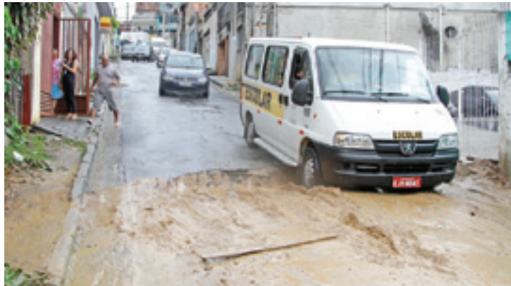
Cratera - Extenso buraco toma a rua, atrapalhando motoristas e moradores

a calçada para passar com mais facilidade. Essa manobra causa prejuízo aos moradores.