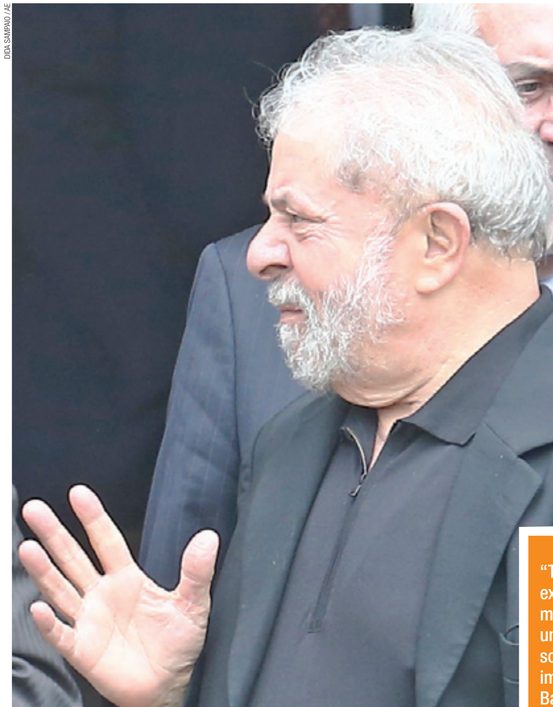
Desanimado - Lula recebeu convite para ser ministro de Dilma Rousseff e deve aceitar para ficar imune