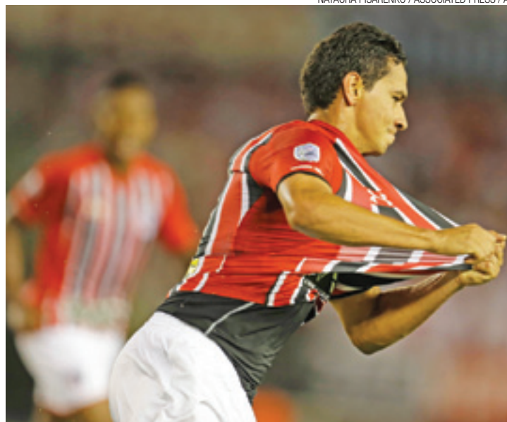
Brilhau - Autor do gol do São Paulo, Ganso foi o melhor em campo

A partida decisiva contra o atual campeão da Liber-