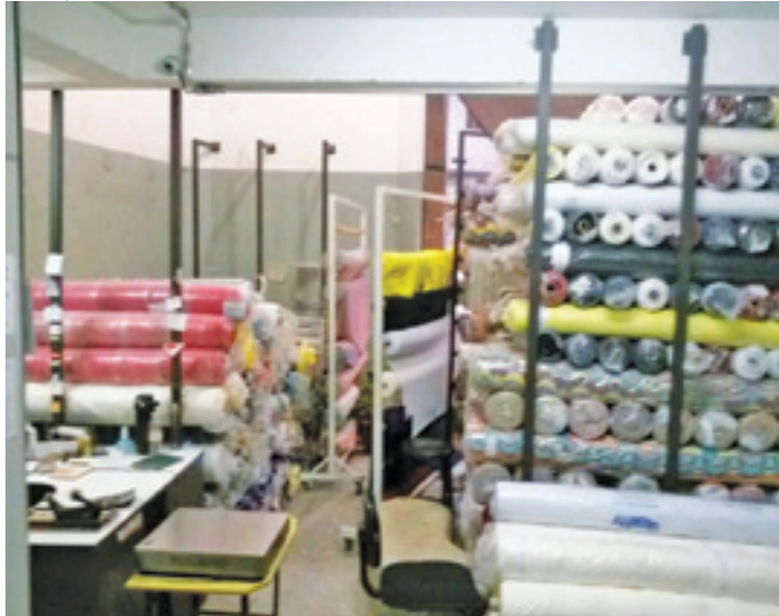
Crime - Comerciantes do Peri (Zona Norte de SP) compravam mercadoria

ram os registros das cargas dos três estabelecimentos e, após consultar os inventários das empresas, constataram que a carga comercializada pelos três empresários era roubada. Ao todo, foram apreendi-