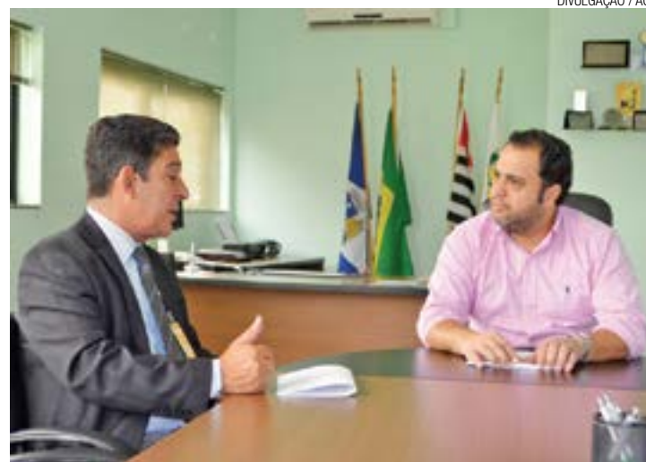
Retrocesso - Lei prejudica o comércio e os bons consumidores, diz ACE

Em 2014, o resultado anual foi a criação de 5,4 mil vagas de emprego na cidade. Os dados foram coletados no Caged.