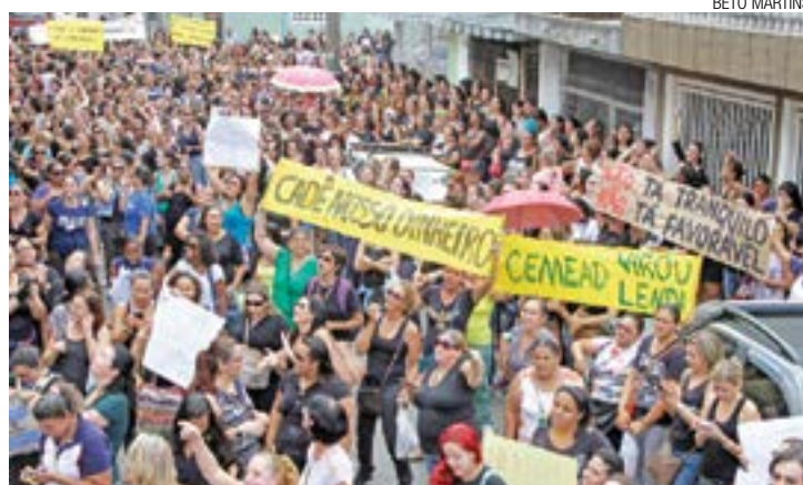
Piquete - Professores exibem cartazes em frente à Secretaria de Educação

O Sindicato dos Trabalhadores na Administração Pública (Stap) avalia a possibilidade de fazer greve contra a medida. “Eu quero que o pre-