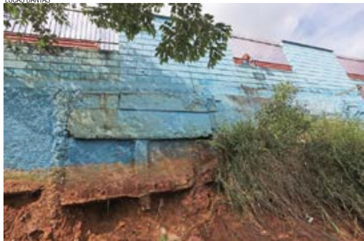
Risco iminente - Muro escorado em barranco deixa pais apreensivos