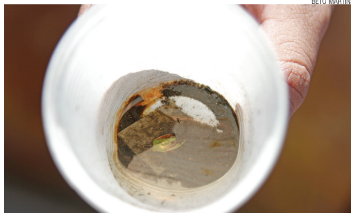
Perigoso - Água parada pode ser criadouro do mosquito aedes aegypti

Em uma semana, 48 casos foram confirmados