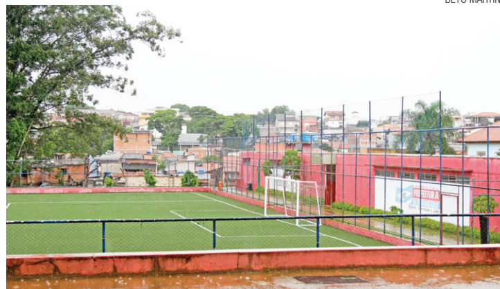
Cadê? Secretário de Esportes prometeu 10 campos, mas não entregou