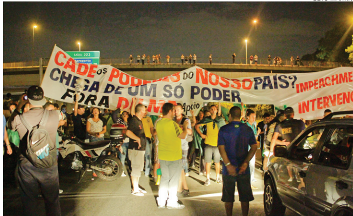
Protesto - Manifestantes saíram do Centro e caminharam até a rodovia

“Não precisamos chamar comissionados para mostrar nossa indignação. Já colocamos dez mil pessoas na rua e muitas ainda irão aderir”, dis-