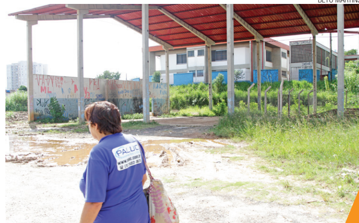
Largado - Falta manutenção em área do entorno de restaurante