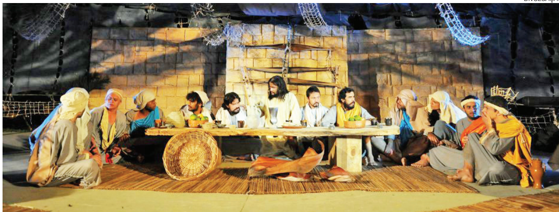
Tradição - Encenação a céu aberto acontece na Sexta Feira da Paixão e no Sábado de Aleluia, no Pq. Cecap