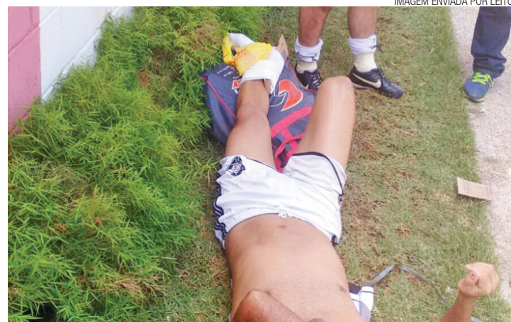
Vítima - Jogador do Vasco da Vila Galvão sofreu grave lesão no local