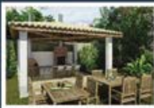
Ilustração artística da churrasqueira