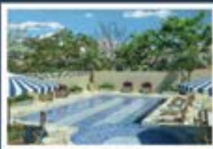
Ilustração artística da piscina