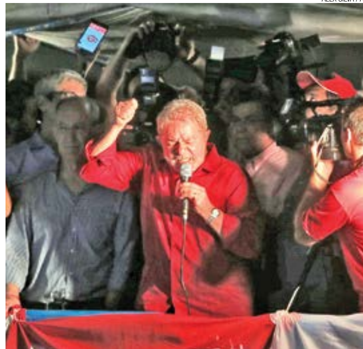
Populista - Lula repetiu o velho discurso dos "pobres" contra os "ricos"

Sobre o cargo de ministro-chefe da Casa Civil, que assumiu na quinta, mas está suspenso por decisão judicial, Lula disse que relutou muito em aceitar ir para o governo, desde agosto do ano passado. "É, ao aceitar, veja o que aconteceu comigo, virei outra vez 'Lulinha paz e amor'". Ele garantiu que vai integrar o governo para ajudar a fazer o País voltar a crescer. "Não vou lá para brigar, vou lá para ajudar a fazer as coisas que tem que fazer nesse país. Não vou achando que os que não gostam de nós são menos brasileiros que nós."