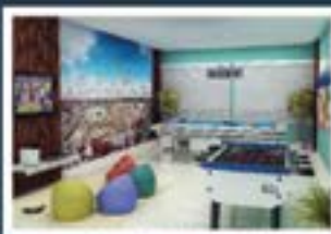
Ilustração artística do salão de jogos