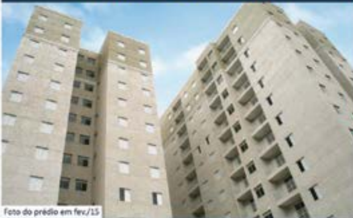
Foto do prédio em fev./15