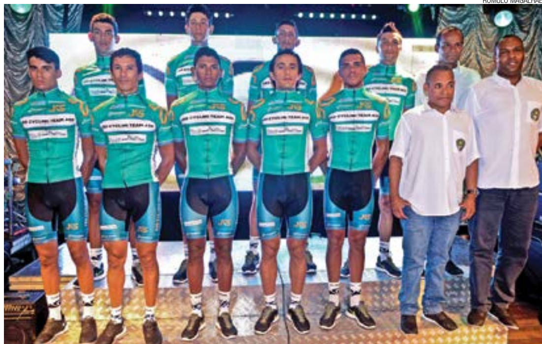
Apresentação - Nova equipe de Guarulhos foi apresentada na última terça, 15, no Nosso Clube Vila Galvão

Hoje, todas as equipes inscritas na prova irão realizar