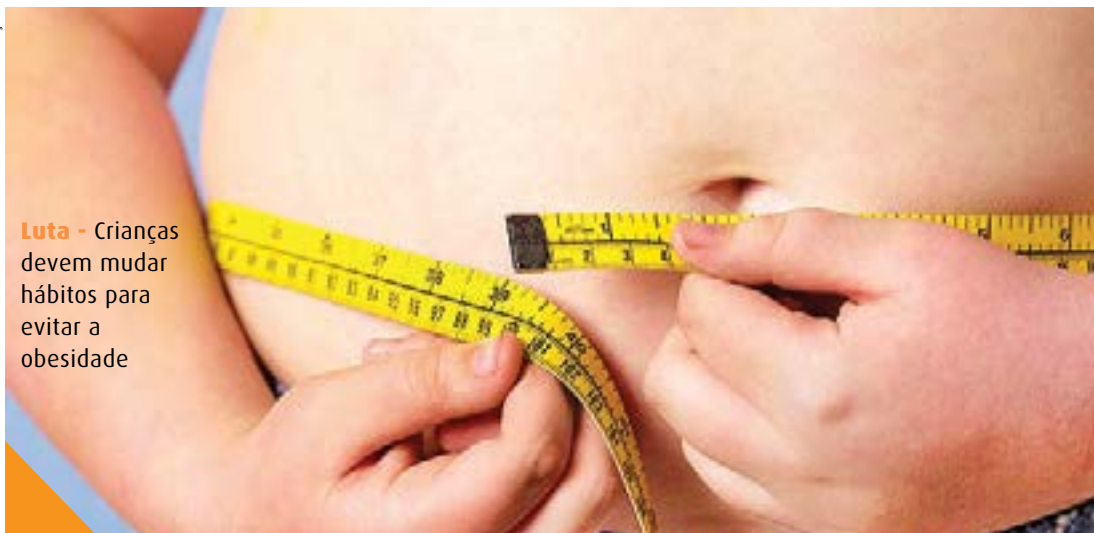
Luta - Crianças devem mudar hábitos para evitar a obesidade