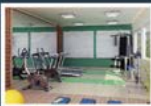
Ilustração artística do fitness