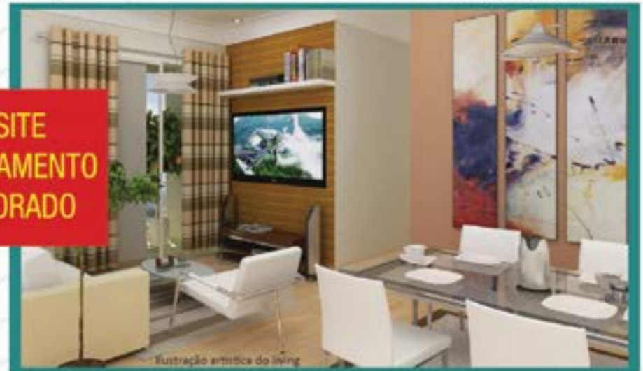
Ilustração artística do living