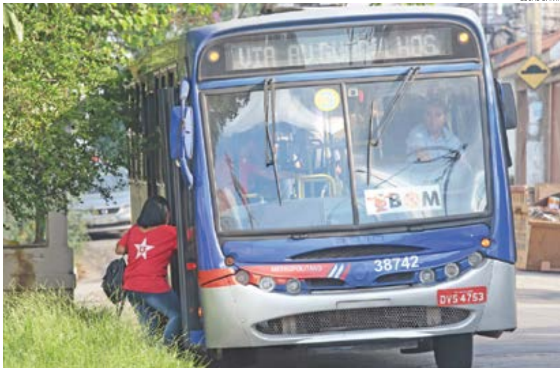
Embarque - Reportagem questionou ao motorista se aquele ônibus iria direto à Paulista e ele confirmou