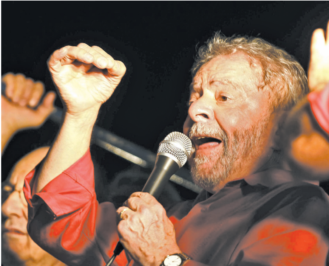
Caiu - Rejeição ao ex-presidente atinge nível recorde (57%), segundo pesquisa do Datafolha publicada ontem