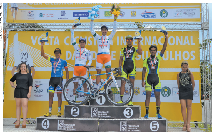
Velocidade máxima - Velocista de São José conquista primeira edição