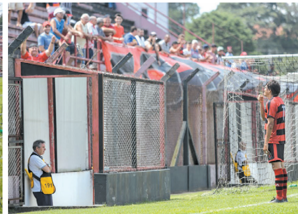
Maestro - Atacante do Rubro-Negro comandou a goleada marcou três e disparou na artilharia do time de Guarulhos.