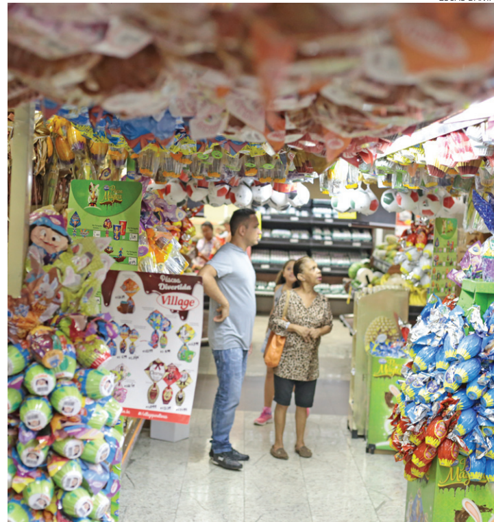
Crise - Com o difícil momento econômico, consumidor deve se retrair

A Abras mostrou que em relação à variação de preços dos produtos, na comparação com a Páscoa de 2015, o grupo dos chocolates em geral foi o que apresentou maior alta de preços, com quase 9% de variação. Se você pagou R$ 100 em um ovo no ano passado, por exemplo, provavelmente terá de desembolsar R$ 110 no mesmo produto em 2016.