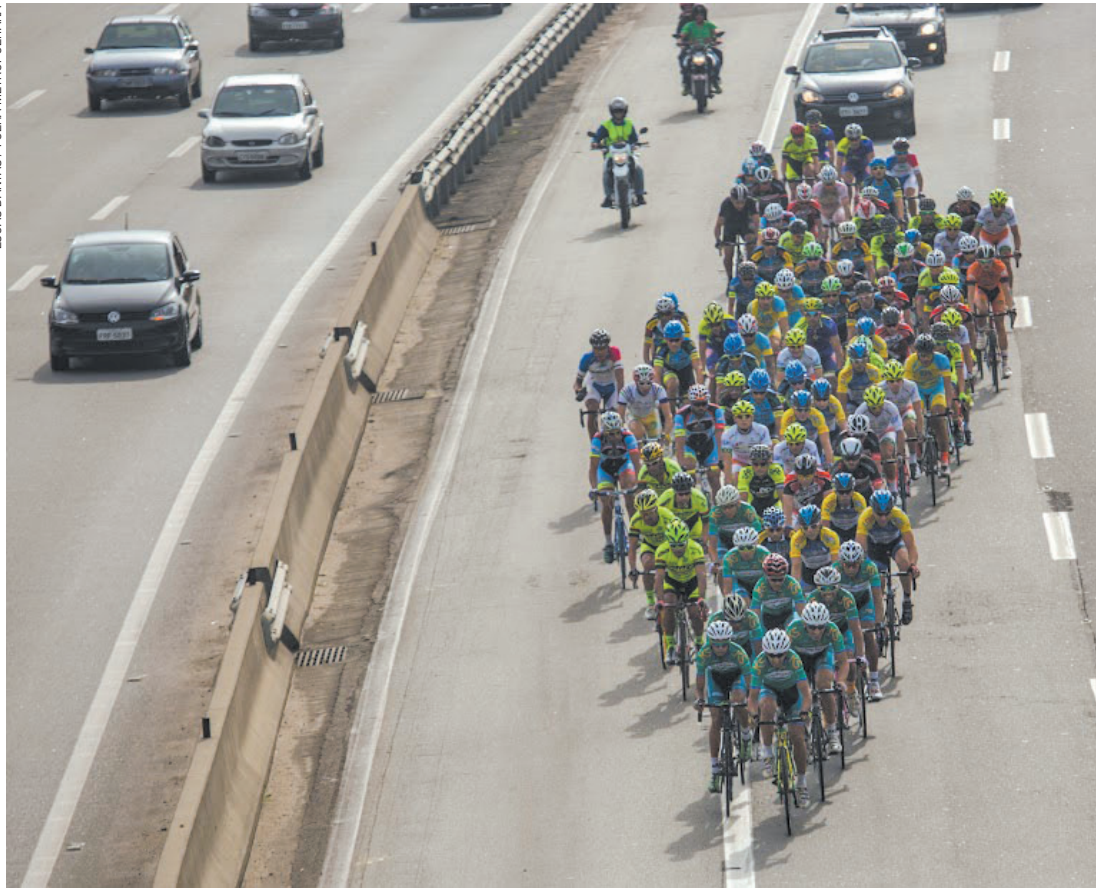
Pela cidade - Atletas percorreram 131 km em vias locais e completaram a prova em aproximadamente 3 horas