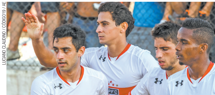
Só uma parte - Meia jogou bem e pôs time na frente, porém, zaga dormiu

No segundo tempo, viu-se, porém, os mesmos erros do início. E o Ituano deixando passar as oportunidades de abrir o marcador. Não fez, recebeu o castigo. Mesmo sem merecer, o São Paulo tirou o zero do placar graças a seu novo artilheiro: Ganso. Em papéis invertidos, o meia recebeu assistência de Calleri e