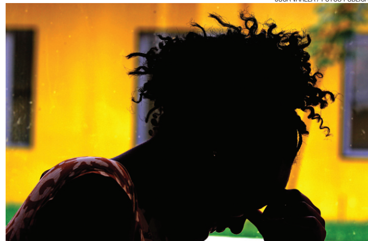
Ainda pior - Vítimas deixam de registrar casos e jogam dados para baixo