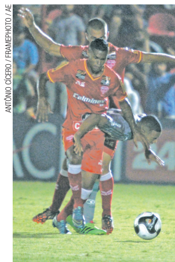
Trancos e barrancos - Gabriel Jesus tentou, mas time não ajudou

LOCAL - Estádio José Liberatti, em Osasco (SP).