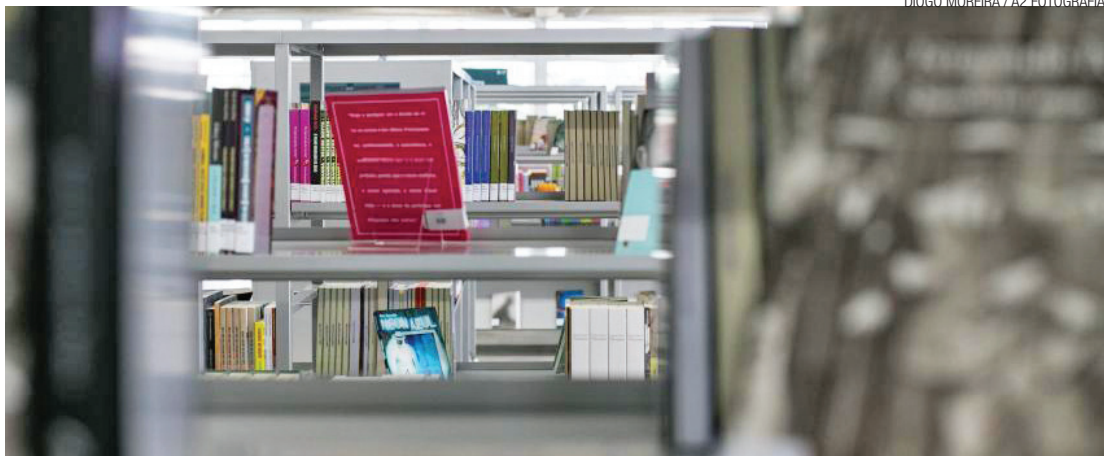
Verso a verso - Livros de poetas famosos são comuns em livrarias e muito procurados pelas mulheres