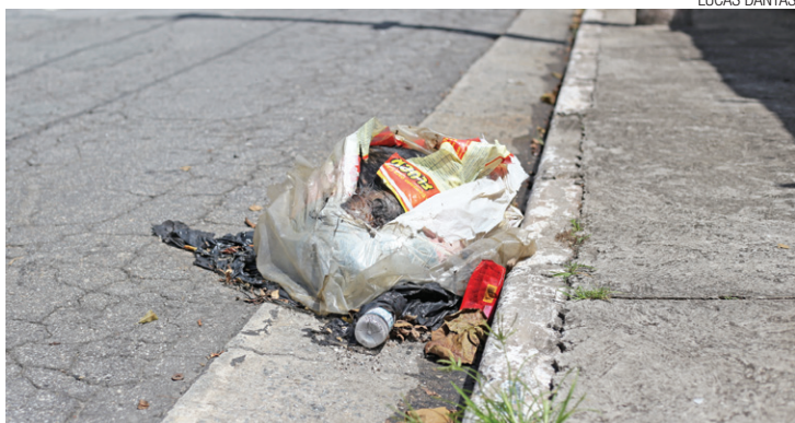
Desinformação - Muita gente não sabe o que fazer em casos parecidos