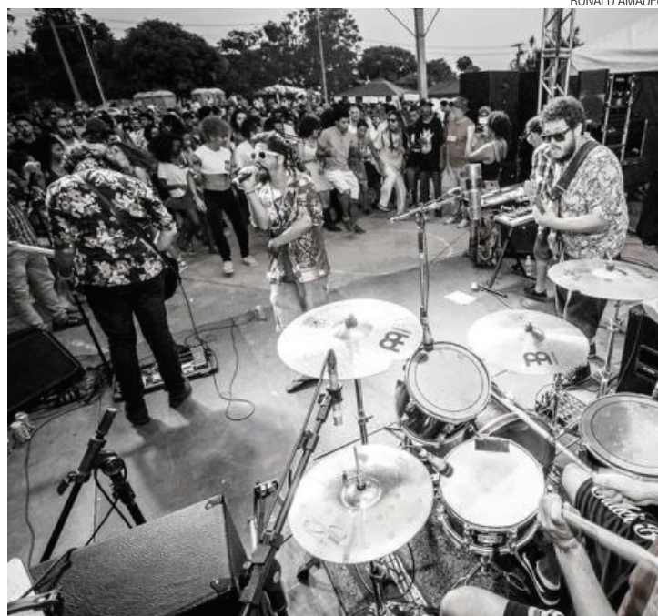
Da gema - Banda nasceu na cena independente da música de Guarulhos