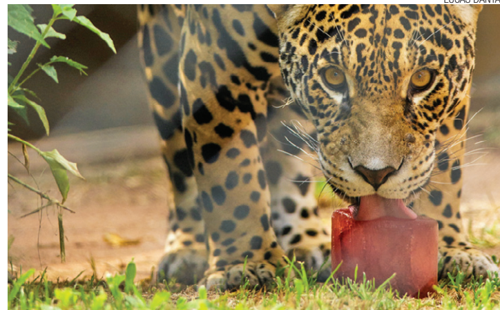
Atração - Zoológico municipal estará aberto durante o feriadão de Páscoa