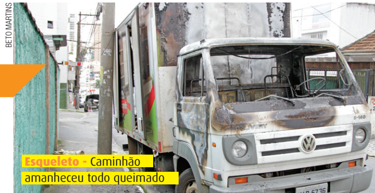
Esqueleto - Caminhão amanheceu todo queimado

A Folha Metropolitana acompanhou o combate ao incêndio, por parte dos Bombeiros. Assista em na página do jornal no Facebook