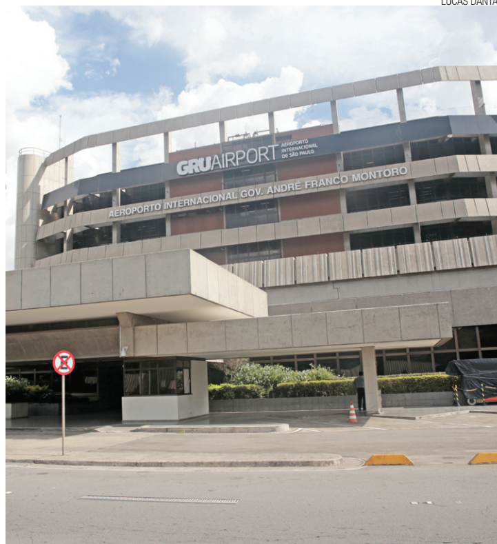
Cumbica - Obras no aeroporto teriam sido 'ajustadas' entre empreiteiras

Em 2002, FHC terminava seu segundo mandato