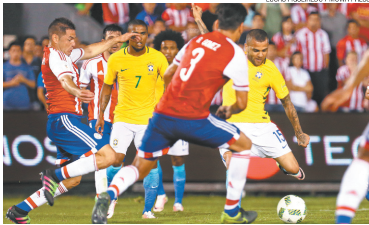
Decisivo - Daniel Alves prepara chute que evitou a derrota do Brasil

Com o resultado, a Seleção Brasileira caiu para a sexta colocação, com nove pontos. Ainda faltam 12 jogos para acabar as Eliminatórias, mas o time brasileiro terá que ficar até setembro passando vergonha na parte de baixo da tabela de classificação. E pior, sem perspectiva de melhora, pelo menos caso a CBF mantenha a comissão técnica e continue de braços cruzados enquanto coleciona vexames.