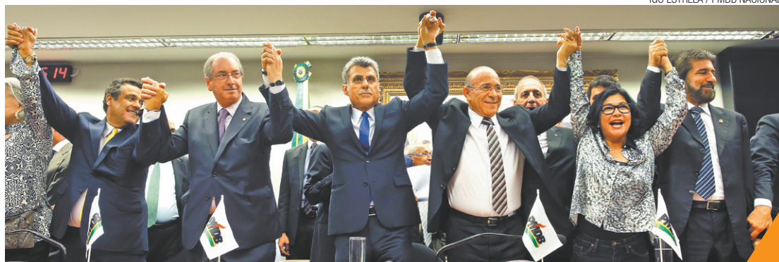
Acabou! - Romero Jucá, vice-presidente nacional do PMDB, declarou a aprovação por votação simbólica

Após a comemoração dos presentes, um grupo gritou, em coro, "Brasil, pra frente, Temer presidente" e Jucá emendou. "A partir de hoje, nessa reunião histórica, o PMDB se retira da base e ninguém no País está autorizado a exercer qualquer cargo federal em nome do PMDB". Jucá encerrou o encontro com um "Viva o Brasil" e membros do partido ainda tiveram tempo para entoar um "Fora PT".