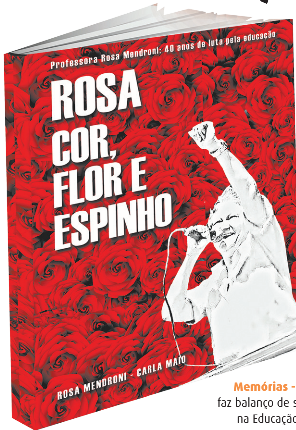
Memórias - Professora faz balanço de sua história na Educação da cidade