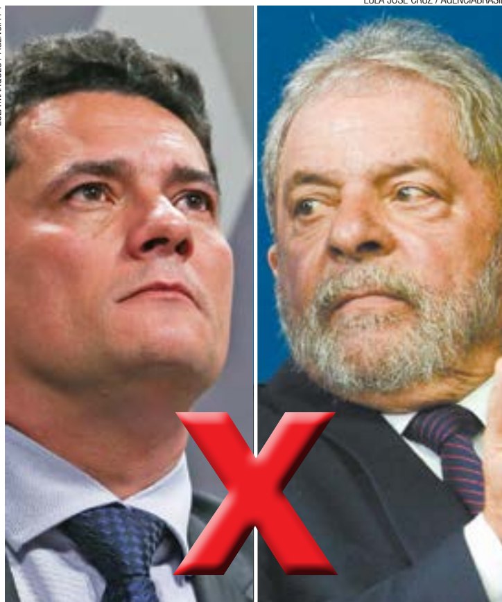
Moro - Juiz foi exaltado em protestos no domingo pelo País