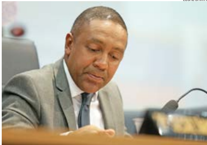
Pressão - Presidente da Câmara, Jesus (PDT), atende pedido da Justiça

Outra determinação do projeto é criar um cargo a mais entre os procuradores da Câmara Municipal, o de procurador chefe, o que culminou na extinção da função de diretor de Assuntos Jurídicos.