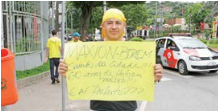
De saída - Manifestante protesta contra saída da Maxion (antiga Borlem)