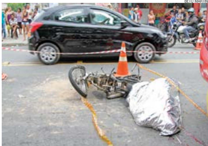
Vítima fatal - Menor de 15 anos morreu no local após ser atropelado

Abalada, a família não comentou o assunto. Segundo apurado pela reportagem, o adolescente costumava andar sem capacete pela avenida com a