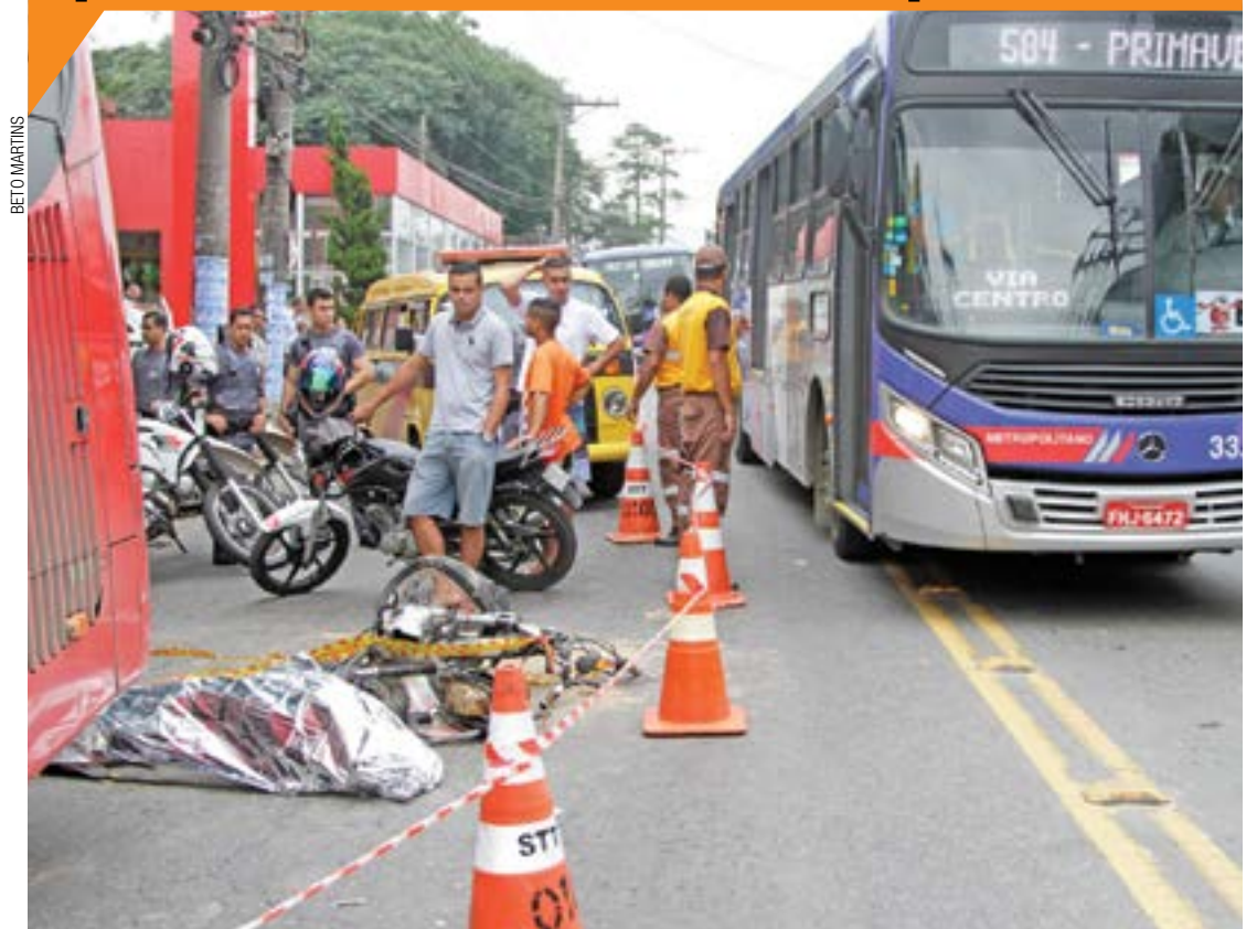
Tragédia - Carro colidiu contra a mobilete e jogou o menor de 15 anos sob o coletivo, na Avenida Otávio Braga

Cotações -1,55% 48.867 +1,48% 3.64 +0,92% 4.04 14,25% Selic (ano) R$ 880 Salário Mínimo