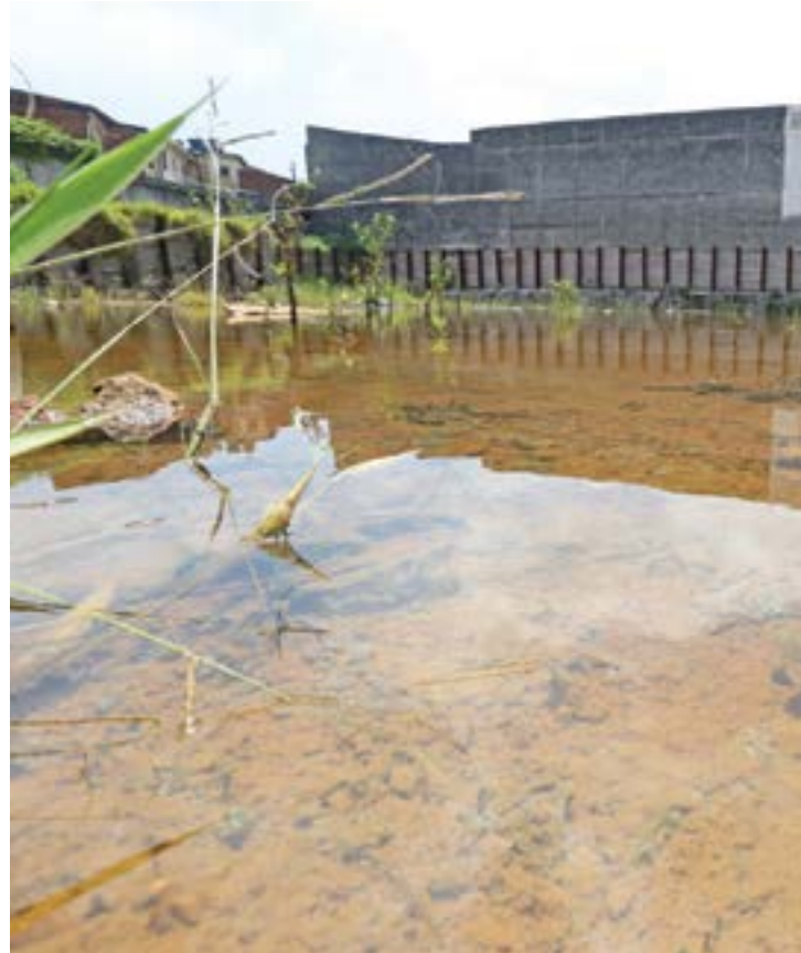
Autuação - Prefeitura já multou proprietário da área, localizada na Vl. Barros