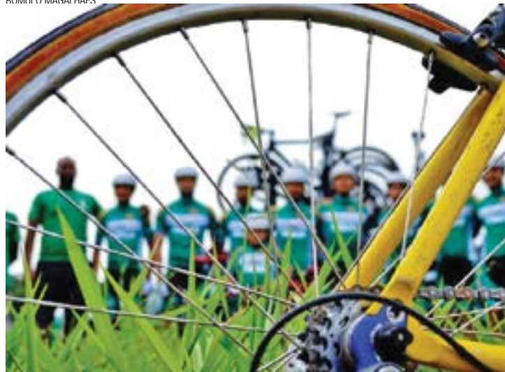
Reforçado - Time contará com nove atletas, entre eles um estrangeiro